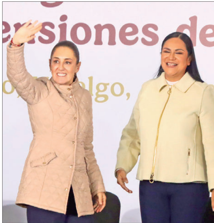
MEDIOAMBIENTE. La mandataria federal informó sobre el proyecto de recuperación ambiental que realizarán en Tula de Allende, que es una de las zonas más contaminadas de México, principalmente sanear los cuerpos de agua y reconfigurar la termoeléctrica.

Luego, la titular de la Secretaría del Bienestar, Ariadna Montiel Reyes, informó que las tarjetas que dotaron son para apoyos económicos de 3 mil pesos bimestrales dirigidos a mujeres que cumplieron 63 y 64 años, en una