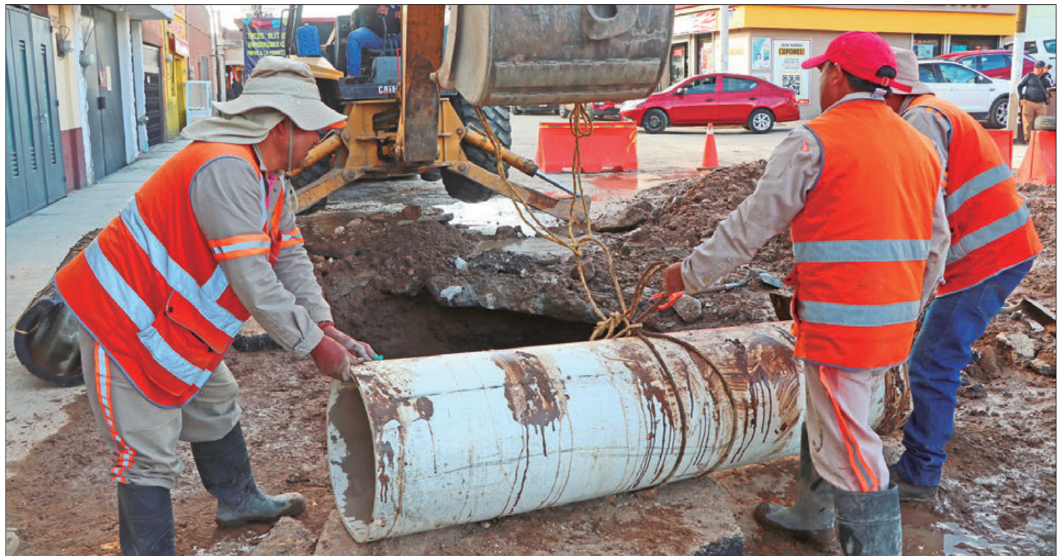
ORÍGENES. De los reportes recibidos, mil 378 se han presentado en líneas de distribución y conducción de agua potable.

Los trabajos de proximidad se realizaron además en plazas públicas de 43 municipios como Pachuca, Tulancingo, Mineral del Monte, Chapanetongo, Tula, Nopala, Tepeji, Zempoala, Tenango, Yahualica y Huejutla, con una asistencia de más de 41 mil personas. (Staff Crónica Hidalgo)