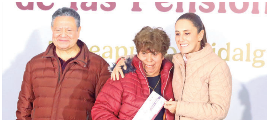
Este fin de semana, la presidenta de México, Claudia Sheinbaum Pardo, visitó Tepeapulco donde atestiguó la entrega de tarjetas de El Bienestar para mujeres beneficiarias de pensiones, a dicho acto, le acompañó el gobernador de Hidalgo, Julio Ramón Menchaca Salazar.

Este sábado 4 de enero, la mandataria federal entregó nuevas tarjetas correspondientes a la pensión mujeres bienestar y para adultos mayores en Puebla e Hidalgo. .4