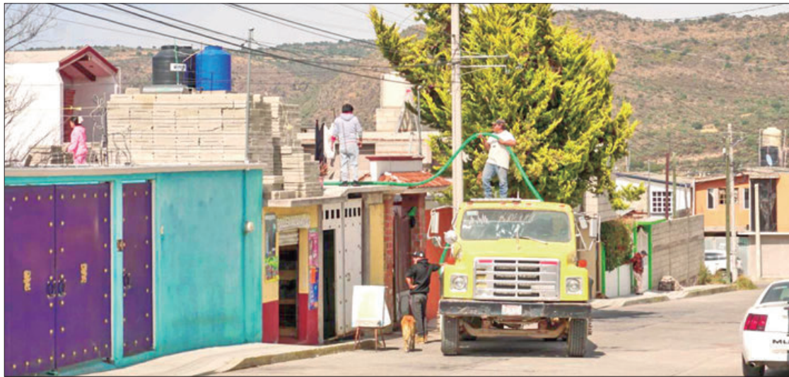
ARGUMENTO. El ayuntamiento dio a conocer que la falta de agua que afecta de forma preocupante a la población se debe al trabajo de reparación de pozos, tanques, entre otras operaciones.

cer que la falta de agua que afecta de forma preocupante a la población se debe al trabajo de reparación de pozos, tanques, líneas de conducción, bombas líneas de distribución, problema en el que ya trabajan para dar una solución definitiva.