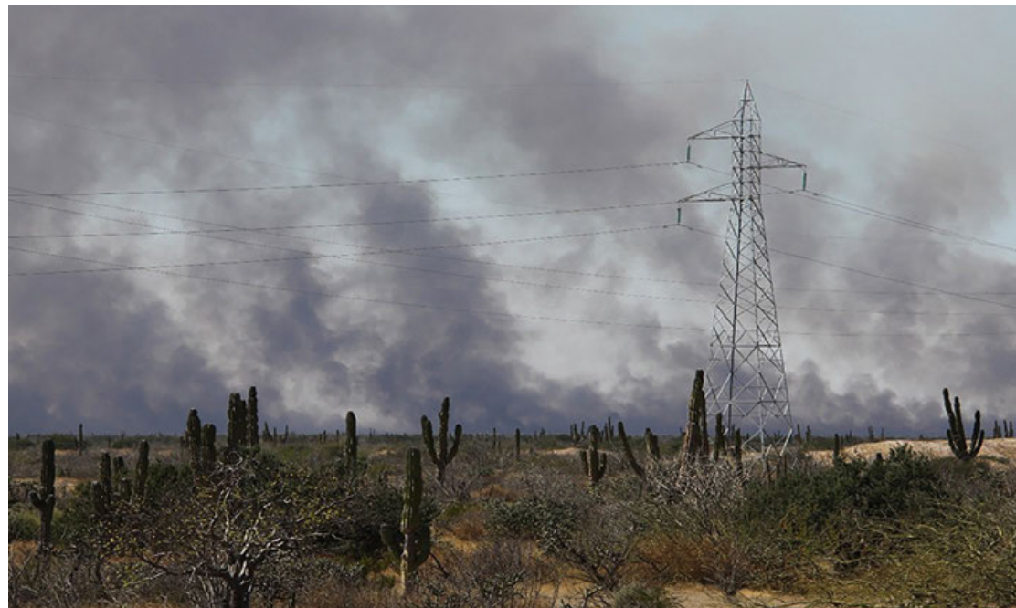
Incendio en Baja California Sur, México (2016). El humo negro tiende a tener más dioxinas.

La 2,3,7,8-tetrachlorodibenzo-p-dioxina (TCDD) es la dioxina mejor estudiada y es la que se utiliza para comparar la toxicidad de las demás. La exposición a la TCDD se ha asociado con efectos adversos a nivel endocrino, reproductivo en ambos géneros, sobre el desarrollo e incluso cáncer. Su toxicidad varía de manera importante para las distintas especies de mamíferos debido a las rutas metabólicas que tiene cada una para transformar un mismo