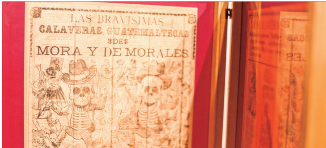
HORARIOS. La exhibición estará abierta al público de martes a sábado de 10:00 a 18:00 horas y los domingos de 10:00 a 15:00 horas.

El recorrido permite a los visitantes sumergirse en la historia y cultura de un México vibrante, donde el arte fue utilizado como herramienta de denuncia, resistencia y conexión con