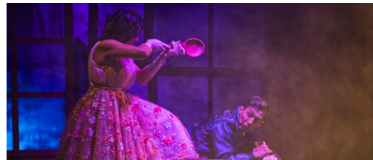
La temporada inicia el 9 de enero.