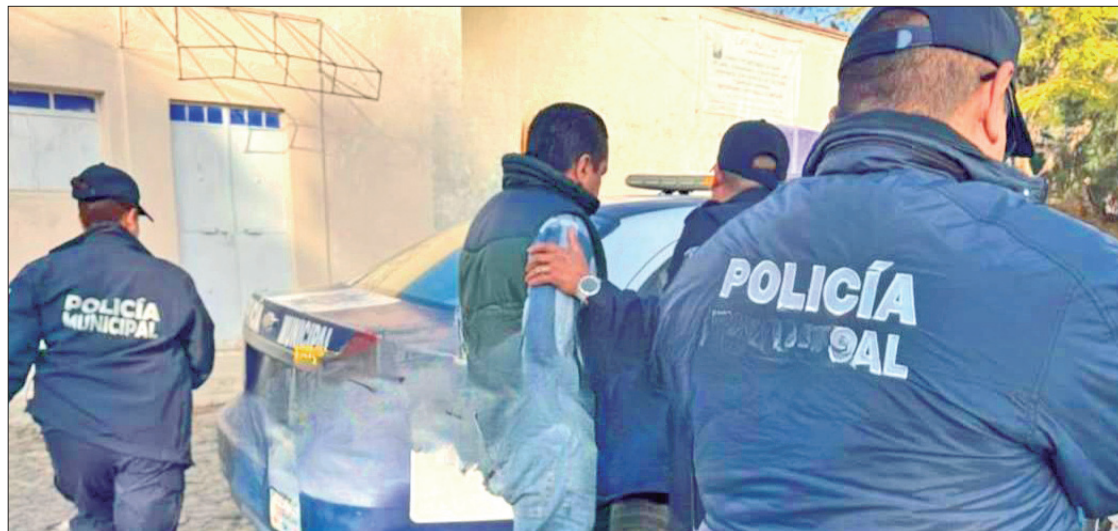
HECHOS. El funcionario municipal fue detenido tras ser señalado de agredir físicamente a su pareja sentimental, con quien discutía dentro de un vehículo.

Más tarde, la Secretaría de Seguridad Pública de Huichapan, a través de un comunicado reite-