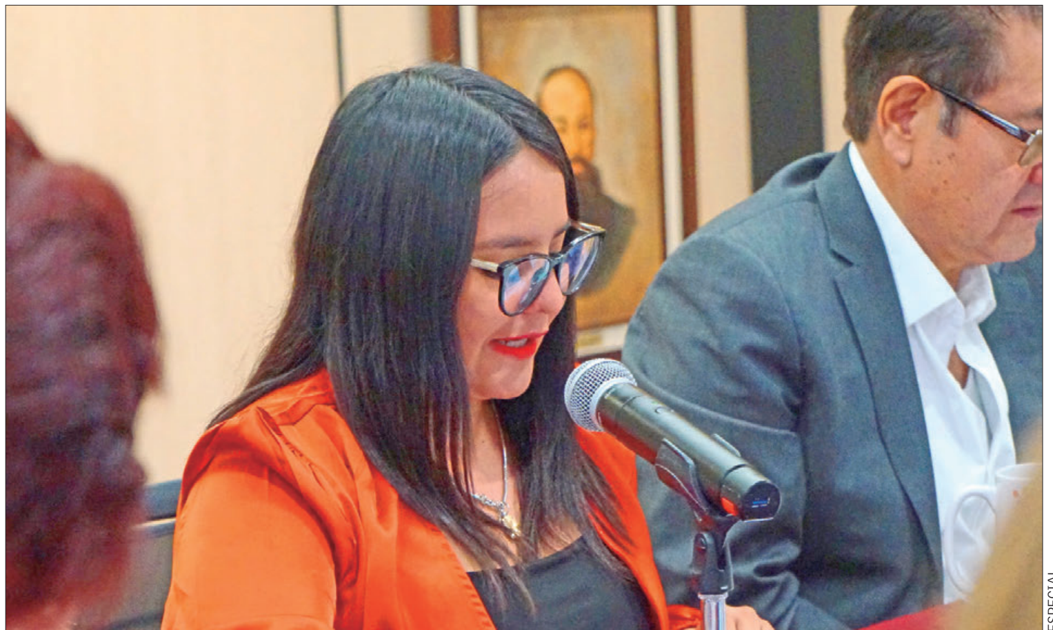
DATOS. El 81% de estas entidades elaboran propuestas para incorporar la perspectiva de género en sus programas, proyectos, acciones y reglas de operación.

Asimismo, se insistirá en que cumplan con la obligatoriedad de ofrecer atención especializada a mujeres en situación de violencia y cuenten con espacios temporales para proteger a mujeres en peligro extremo, entre otras acciones medibles que reflejen su nivel de compromiso con la agenda de género.