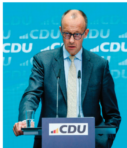
Friedrich Merz, candidato favorito en las próximas elecciones en Alemania.