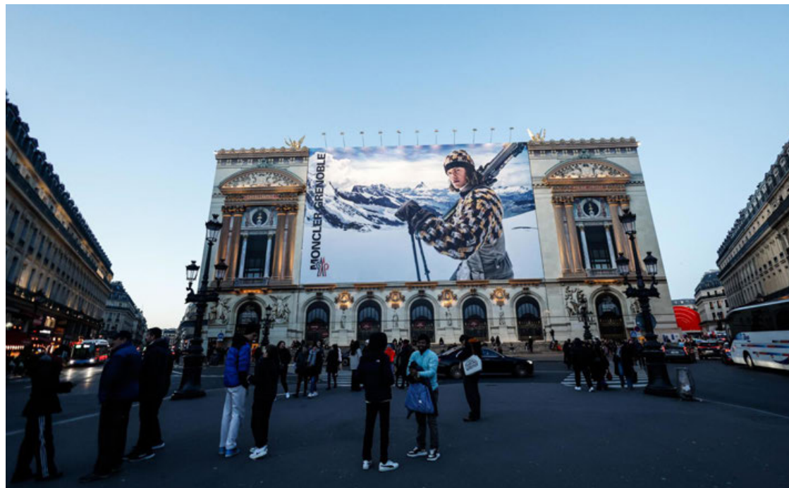
Una vista del Palacio Garnier.

núen las visitas a sus áreas públicas, que cada año ascienden a un millón, ni las representaciones, que atraen anualmente a unos 350 mil espectadores. El Palacio Garnier es el escenario más prestigioso de los que posee la Ópera parisina -que cuenta con otro teatro de grandes dimensiones y más moderno en la plaza de la Bastilla- y el techo de su gran audito-