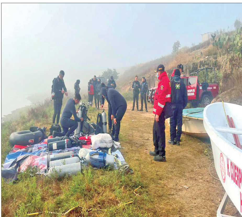
METEPEC. Un saldo de tres personas muertas, un desaparecido y un sobreviviente, esto tras el hundimiento de una lancha en la presa de Palo Gordo.

Para el parque vehicular optaron por Qualitas Compañía de Seguros, S.A. de C.V. por un monto de 41 millones 443 mil 732 pesos, lo cual contempla 193 maquinarias y vehículos pesados valuados en... 3