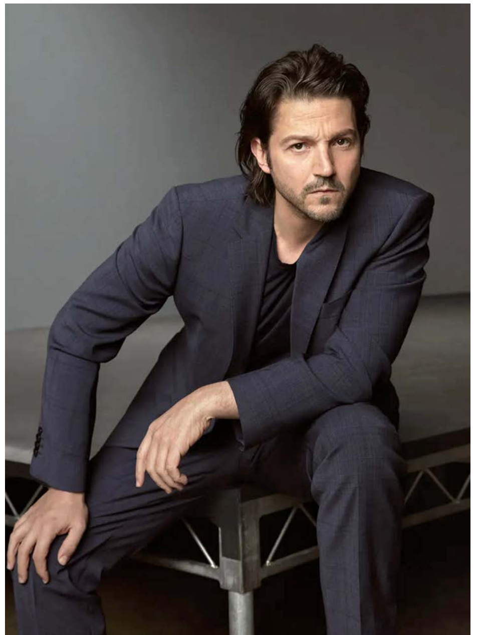
El actor Diego Luna.

Luna resaltó la importancia de obtener una nominación por este proyecto latino. “Hoy el público festeja ver historias que pasan y suceden en otros contextos, sobre todo en la televisión. Es un momento muy interesante, porque de pronto un trabajo