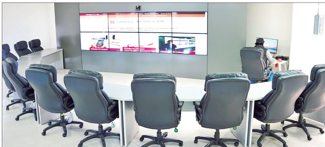
ACTIVOS. Referente para el diseño de políticas públicas basadas en evidencia, se enfoca en atender las necesidades específicas de cada región, localidad y comunidad del estado.

► En Hidalgo consolidan el Laboratorio Estatal de Políticas Públicas; acciones en función análisis científicos y técnicos