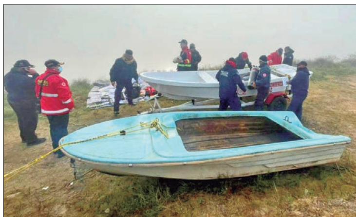
ZONA. Este jueves reiniciaron los trabajos de búsqueda en la presa de Palo Gordo.

Manifestó ser tío del masculino desaparecido que responde por el nombre de *M. Y. N., con domicilio conocido como prolon-