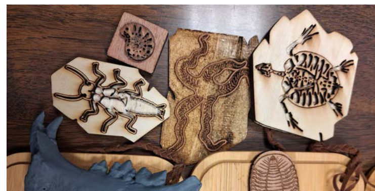
Algunas de las piezas de la exposición.

para la muestra de divulgación científica se decidió trabajar con ejemplares que no son tan comunes y para los cuales se elaboró material tifológico en braille y alto relieve en bambú, amigable al tacto.