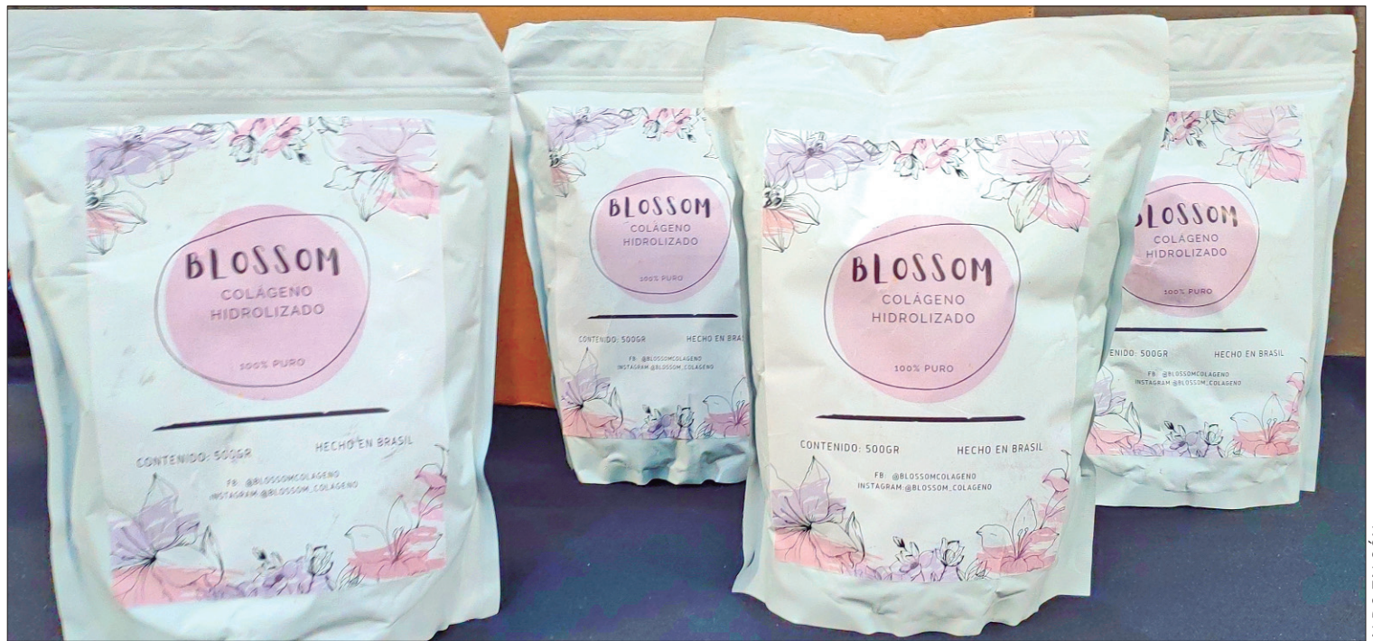
SINERGIAS. El esfuerzo conjunto entre el gobierno de Hidalgo, la Secretaría de Desarrollo Económico y el IMPI, es un claro ejemplo de cómo las alianzas estratégicas y esquemas accesibles logran transformar la economía local y proyectar el talento hidalguense hacia nuevos horizontes.

Esta iniciativa ha sido reconocida a nivel nacional, ya que el Instituto Mexicano de la Propiedad Industrial (IMPI) reconoció al gobierno de Hidalgo por su desempeño, otorgándole el tercer lugar a nivel nacional en el incremento del número de solicitudes de registro de marca durante el año 2023.