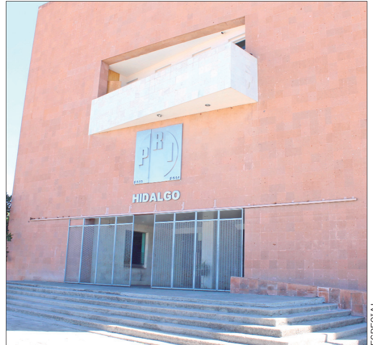
CLÁUSULAS. Entre abril y septiembre del 2020, terminaron los periodos estatutarios de 83 comités municipales, sin embargo, era imposible la renovación de los mismos ante el empate de procesos electorales de ayuntamientos en 2020, así como el que transcurrió en 2021 para elegir integrantes de los Congresos local y federal.

El artículo 176 de los estatutos priistas señala que la convocatoria para la elección de las dirigencias será expedida por el comité del nivel inmediato superior y conforme al procedimiento estatutario que hubiere determinado el Consejo Político que corresponda a la elección, igualmente, todo edicto lo consignarán previo acuerdo de la persona titular de la presidencia del Comité Ejecutivo Nacional.