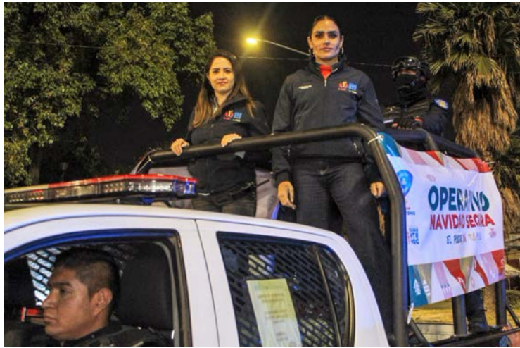
Operativo "Navidad Segura" en Cuauhtémoc.

Entre el 12 de diciembre de 2024 y el 6 de enero de 2025, elementos de la Policía Auxiliar de la alcaldía Cuauhtémoc, detuvieron a 96 personas por distintas faltas administrativas o delitos de alto o bajo impacto, resultado que forma parte del Operativo 'Na-