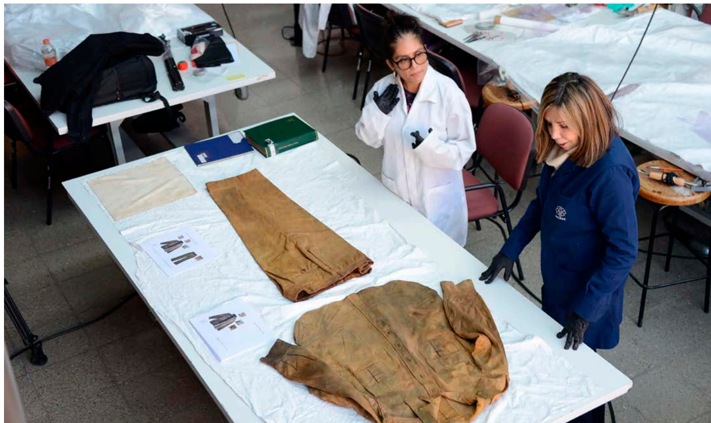
Los especialistas del INAH durante los trabajos de restauración.

La ropa presentaba una decoloración importante, causada por las condiciones ambientales extremas propias de la enti-