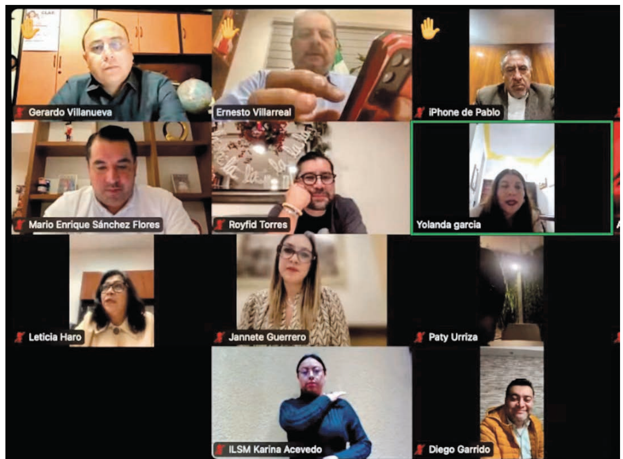
En sesión virtual las y los diputados del Congreso capitalino eligieron a los integrantes del Comité de Evaluación.