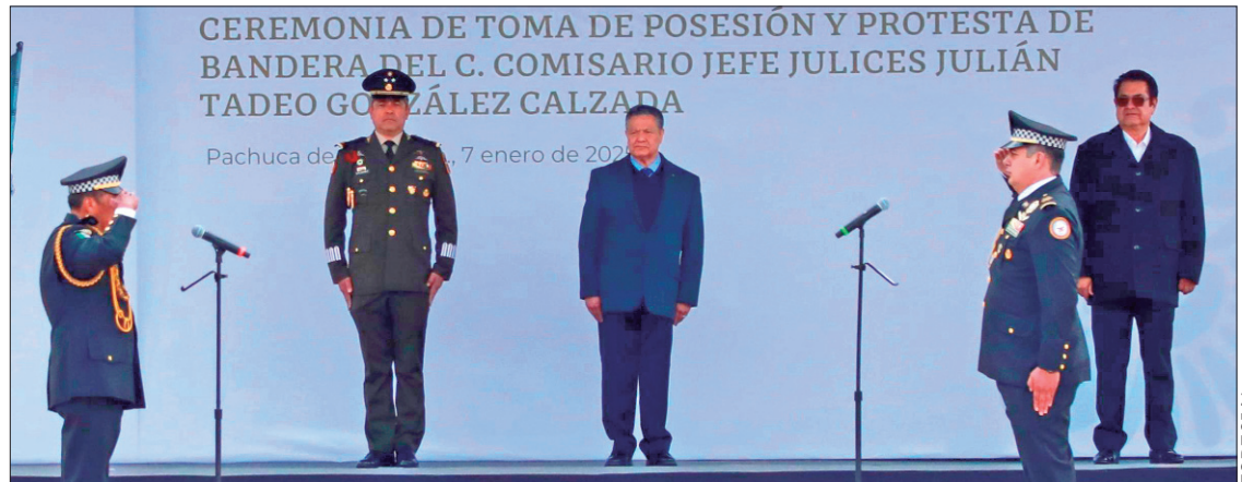
PASOS. Titular del Poder Ejecutivo en Hidalgo ratificó su reconocimiento a las y los integrantes de la Guardia Nacional y reiteró el compromiso del gobierno estatal para seguir trabajando de manera conjunta.