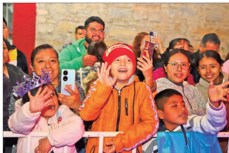
Cerca de 40 mil personas convergieron en el corazón de la Huasteca.