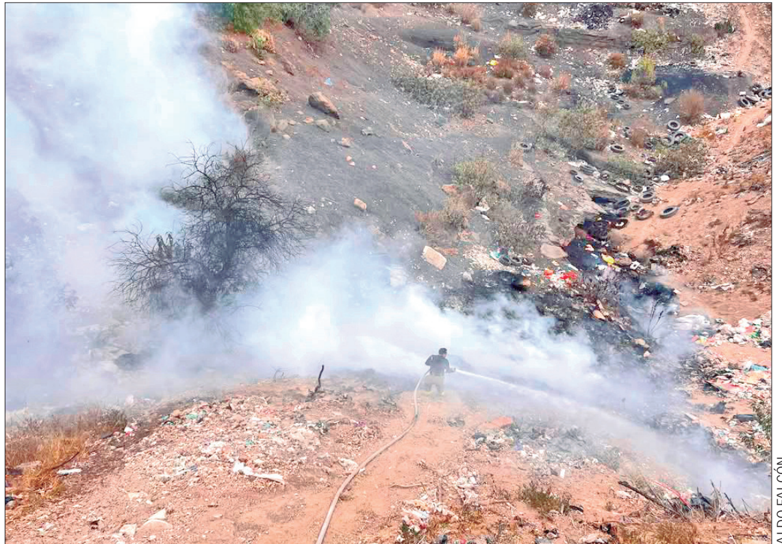
IMPACTO. Estos eventos también han dejado afectaciones en municipios del Altiplano, zona en la que tampoco se han atendido a las advertencias de no realizar la práctica para la preparación de la tierra para la siembra.

Recordaron que en Pachuca han sido por lo menos 14 los incendios que se han presentado en tierras de cultivo y terrenos baldíos, los cuales no se descartan que pudieran ser provocados por la preparación de las tierras o por la quema de basura.