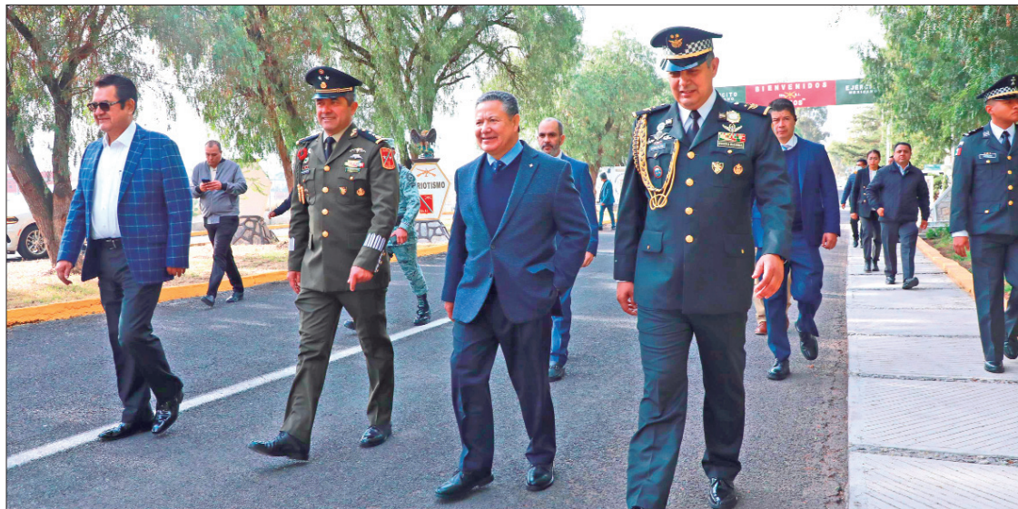
Titular del Poder Ejecutivo en Hidalgo ratificó su reconocimiento a las y los integrantes de la Guardia Nacional y reiteró el compromiso del gobierno estatal para seguir trabajando de manera conjunta.