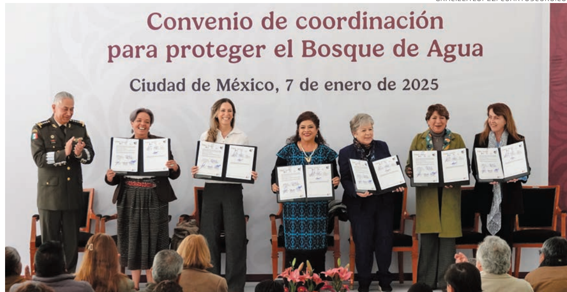
La jefa de Gobierno Clara Brugada y las gobernadoras Delfina Gómez (Edomex) y Margarita González Saravia (Morelos) firmaron el acuerdo, acompañadas de Mariana Boy (Profepa) y Alicia Bárcena (Semarnat).

La primera ocasión ocurrió en medio del propio bosque, en un encuentro convocado por la Secretaría de la Defensa Nacional para coordinar compromisos orientados a detener la tala ilegal. En este segundo encuentro, Brugada subrayó la importancia