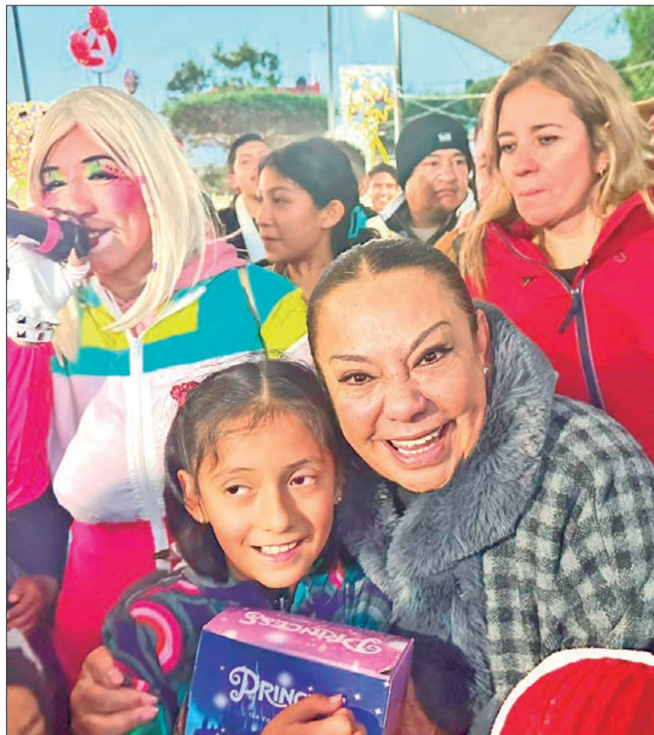
CIERRES. Finalizan celebraciones de diciembre y de reyes, incidiendo positivamente en otros aspectos como arribo de visitantes y derrama económica.

Anticipó que a más de 100 días de gobierno se tiene definida la ruta de trabajo para el 2025 y se atenderán temas sensibles como bacheo, servicios públicos y