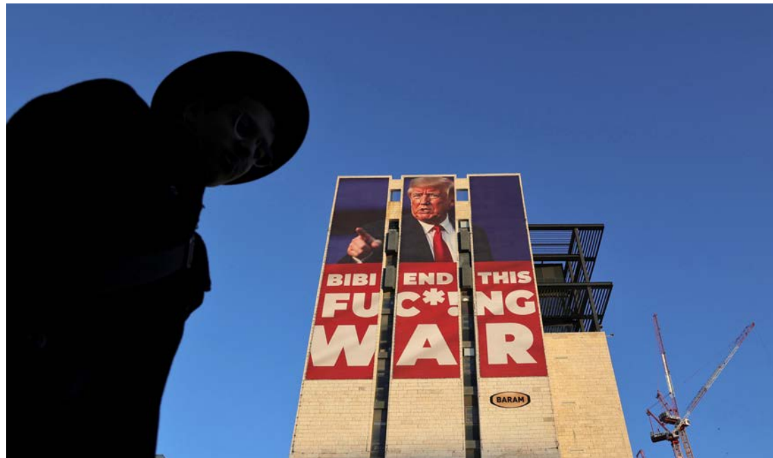
Un gran cartel colocado a la entrada de Jerusalén muestra al presidente electo de EU, Donald Trump, llamando a poner fin a la guerra.

En la primera etapa del acuerdo, Hamás liberaría a 34 rehenes israelíes a cambio de un alto el fuego de un mes