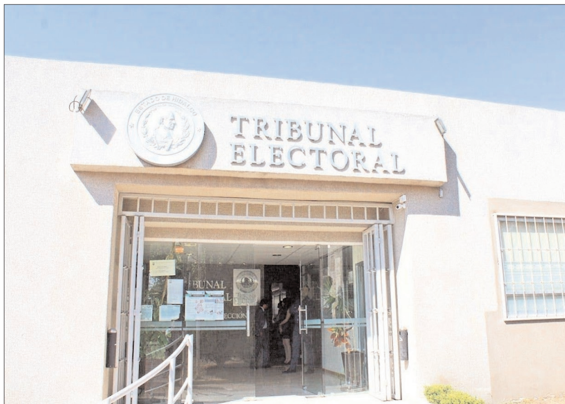
DATOS. Otro aspecto relevante es que ya formalizaron los primeros cuatro juicios de protección de derechos políticoelectorales del ciudadano del año 2025.

Los magistrados electorales determinaron como días inhábiles para el año 2025 los siguientes: lunes 3 de febrero, lunes 17 de marzo, jueves 1 de mayo, martes 16 de septiembre, lunes 17 de noviembre y jueves 25 de diciembre.