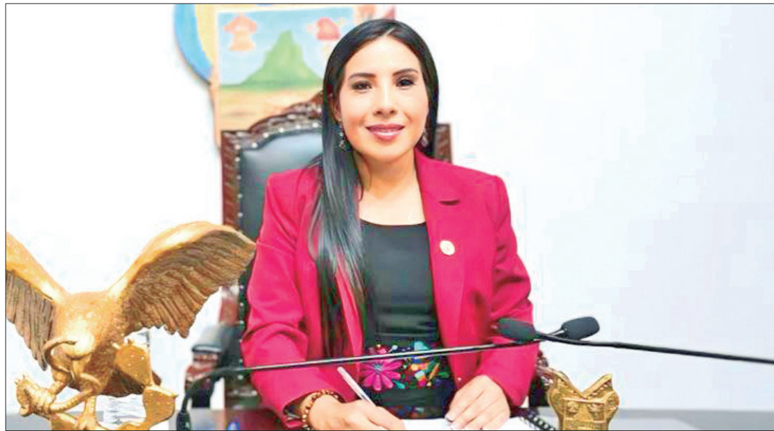
PASOS. La diputada por el Distrito 17 adelanta que en próximos días presentará una agenda de trabajo para dar atención al Distrito de Mineral de la Reforma.

Si bien, los ayuntamientos están considerados como autónomos, desde el Congreso hidalguense se habrá de realizar un exhorto para hacer modificaciones a sus reglamentos internos y con ello armonizar las leyes vigentes.