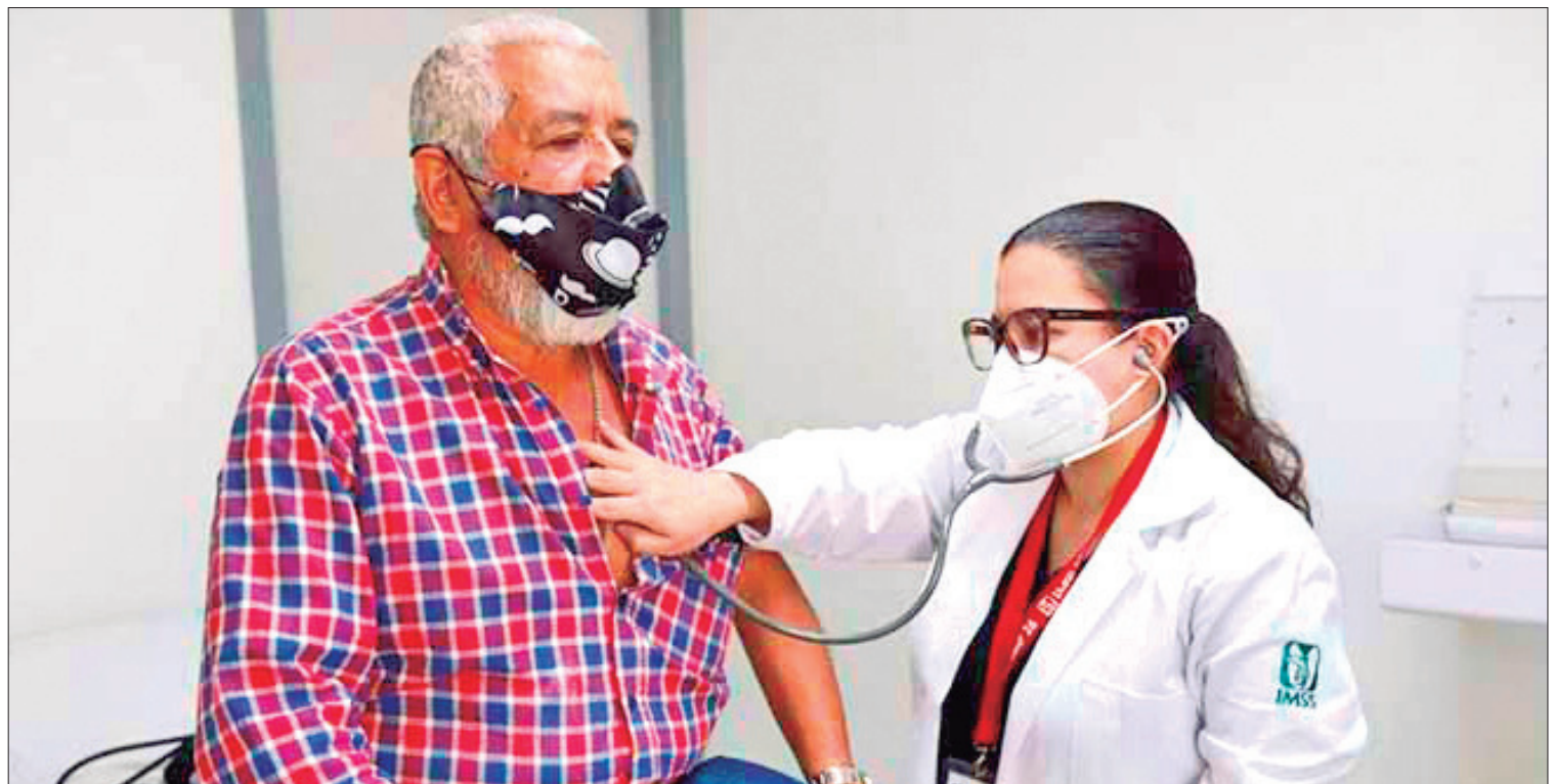
PREVENCIÓN. Dentro de los servicios que ofrece el IMSS, se incluyen consultas médicas periódicas, estudios de diagnóstico.

El IMSS en la entidad invita a la población derechohabiente a realizarse chequeos médicos periódicos, especialmente si tienen antecedentes familiares de enfermedades del corazón o presentan factores de riesgo. La atención temprana y la adopción de hábitos saludables son fundamentales para prevenir enfermedades cardiovasculares y disfrutar de una vida sana.