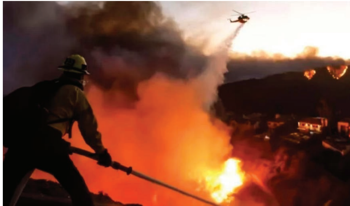
La labor titánica de los bomberos mexicanos para ayudar a contener el avance del fuego en el sur de Los Ángeles, California.

Antes de entrar de lleno a campo para enfrentar esta gigantesca hoguera que arrasa todo a su paso, los apaga fuego aztecas recibieron instrucciones por parte de elementos del