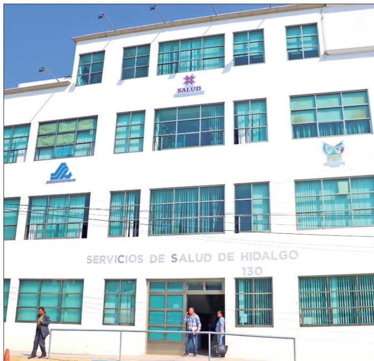
ABUSOS. Los intereses de las casas de ahorro o préstamo a empleados de la dependencia estatal rebasan hasta el 300 por ciento.