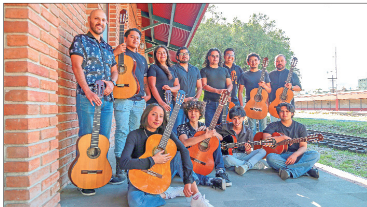
ENERO 16. Fortalecer la identidad histórica y cultural de la entidad a través de dos actividades que conectan pasado y presente.

Posteriormente, el concierto "Guitarra Hidalguense", interpretado por la Orquesta de Guitarras Pedro Barrera, ofrecerá una experiencia sonora que combi-