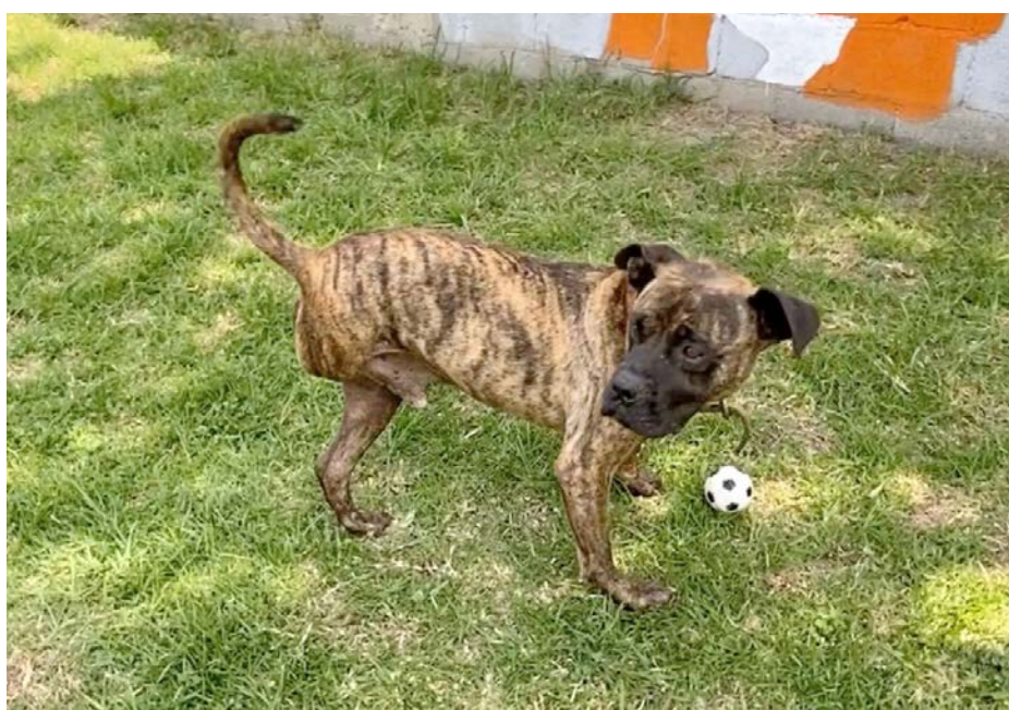
Cuco tiene seis años y una particularidad que lo distingue: solo cuenta con tres patitas debido a un accidente en las instalaciones del sistema de transporte.

Para adoptar a Cuco o a cualquiera de los canes que esperan una segunda oportunidad, los interesados pueden consultar los requisitos en el sitio web del Metro: https://www.metro.cdmx.gob.mx/adoptame .