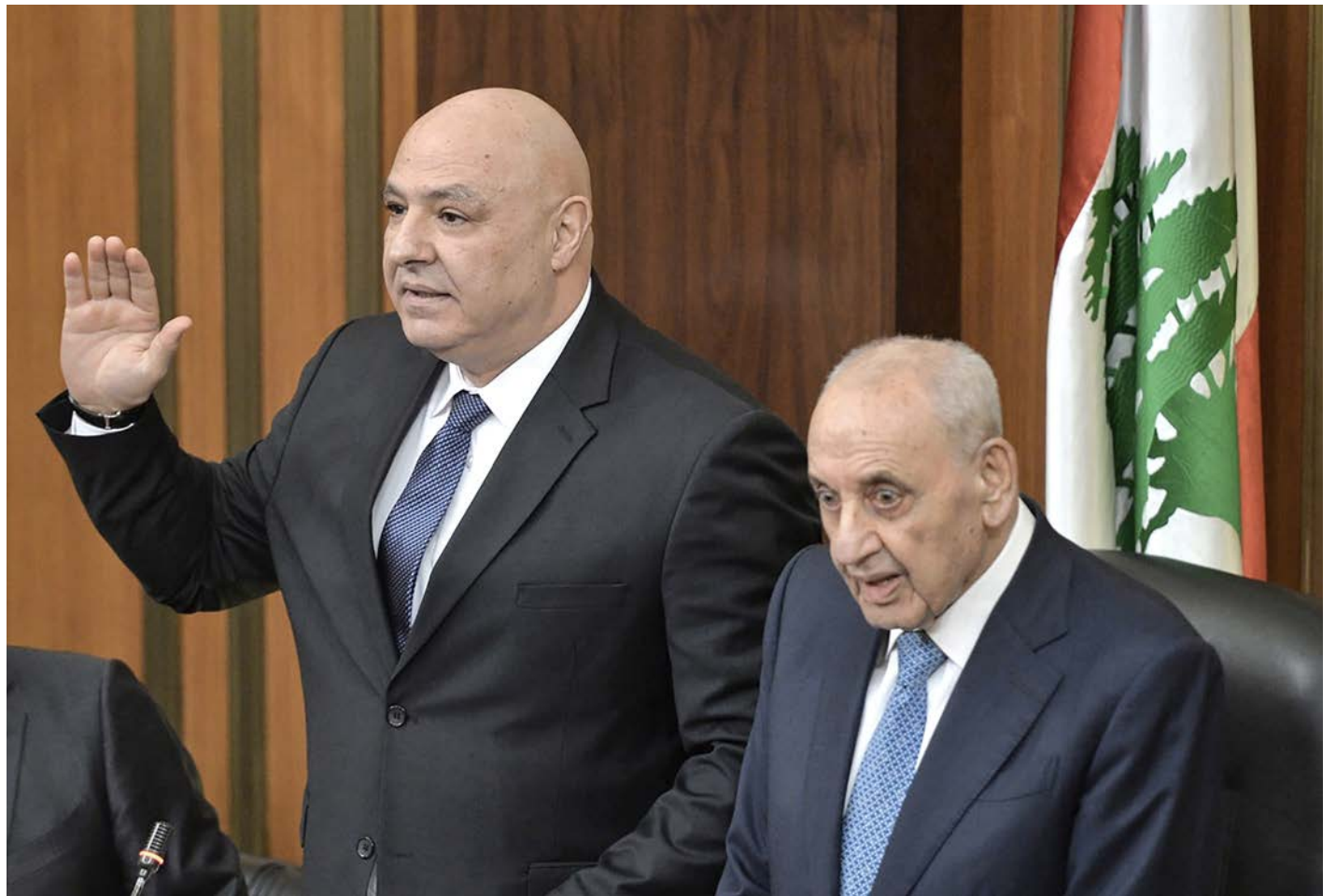
A la izquierda, el nuevo presidente de la República de Líbano, Joseph Aoun.

El gobierno de Michel Aoun debió enfrentar los graves problemas que causó la explosión en el Puerto de Beirut del 4 de agosto de 2020, que causó más de