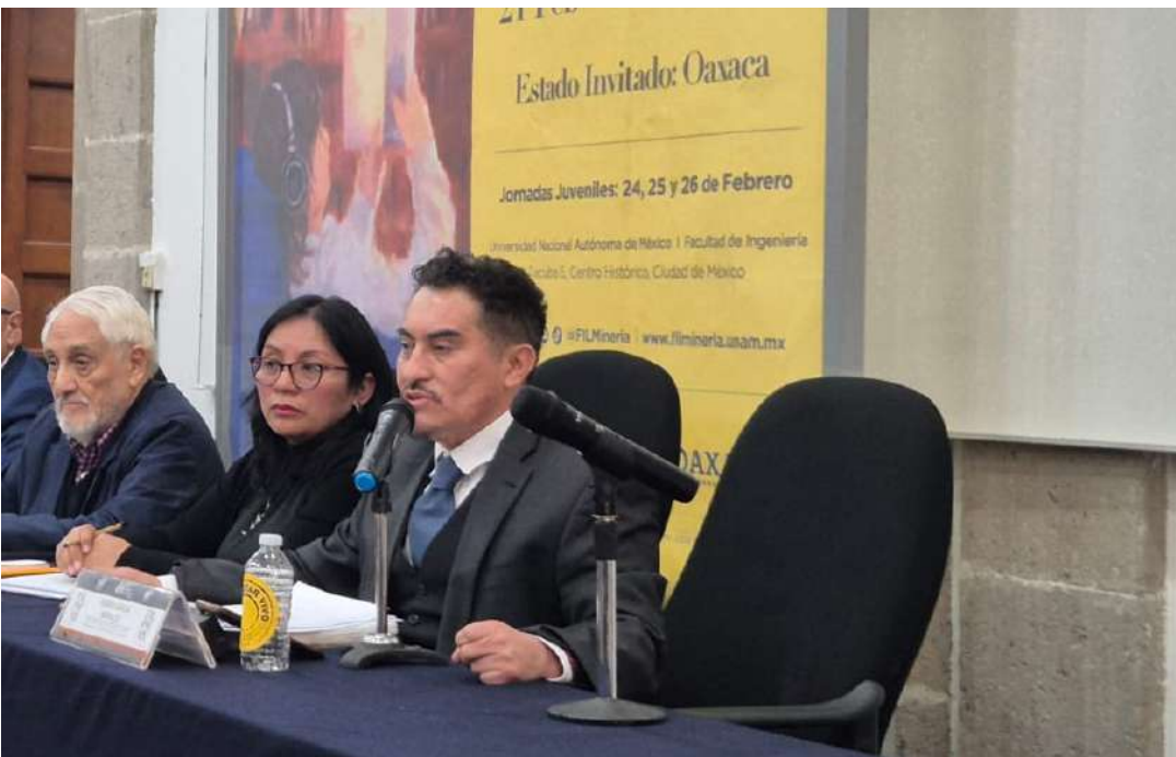
Ariiba; la presentación de la FIL de Minería. Abajo: una vista de una edición anterior.