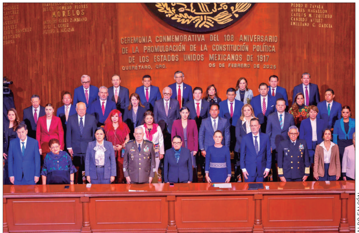
PILARES. La Carta Magna es el escudo que protege a la nación, reafirmando que México no permitirá que se viole su soberanía ni se pisotee la dignidad de su pueblo.

Una vez concluido el acto protocolario, Menchaca Salazar reiteró el apoyo del pueblo de Hidalgo hacia las recientes decisiones que tomó la presidenta de México, en cuanto a la colaboración con Estados Unidos, destacando que la unidad es esencial para alcanzar un mejor estado