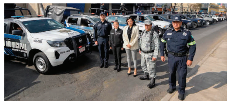
Atizapán de Zaragoza refuerza la seguridad.

fuerzas de la Guardia Nacional, Policía Estatal y Policía Municipal en un denominado Sector Fusión, establecido según el Plan de Vigilancia Comunitaria por Cuadrantes. Este sector estratégico abarca el 13.57% del territorio municipal y concentra más de una cuarta parte de la incidencia delictiva total del municipio, específicamente el 27.66% • (Cristina Huerta)