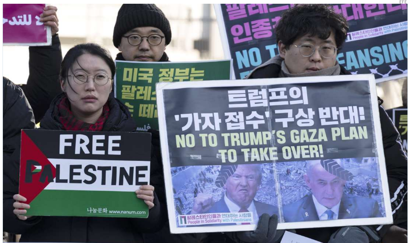
Surcoreanos protestan este miércoles en Seúl contra los planes de Trump de tomar la Franja de Gaza.

Rubio indicó durante una rueda de prensa en Guatemala que “lo que anunció