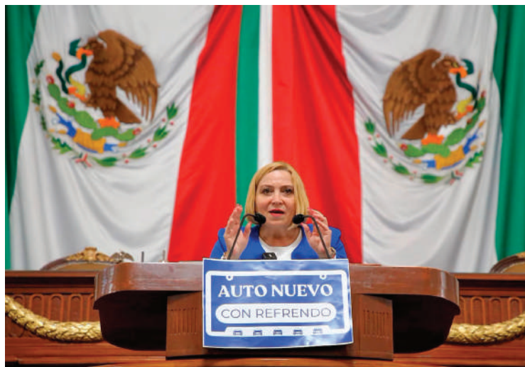
Olivia Garza, diputada del PAN.

Actualmente vehículos de hasta 250 mil están exentos de pagar la tenencia, pero deben pagar el refrendo