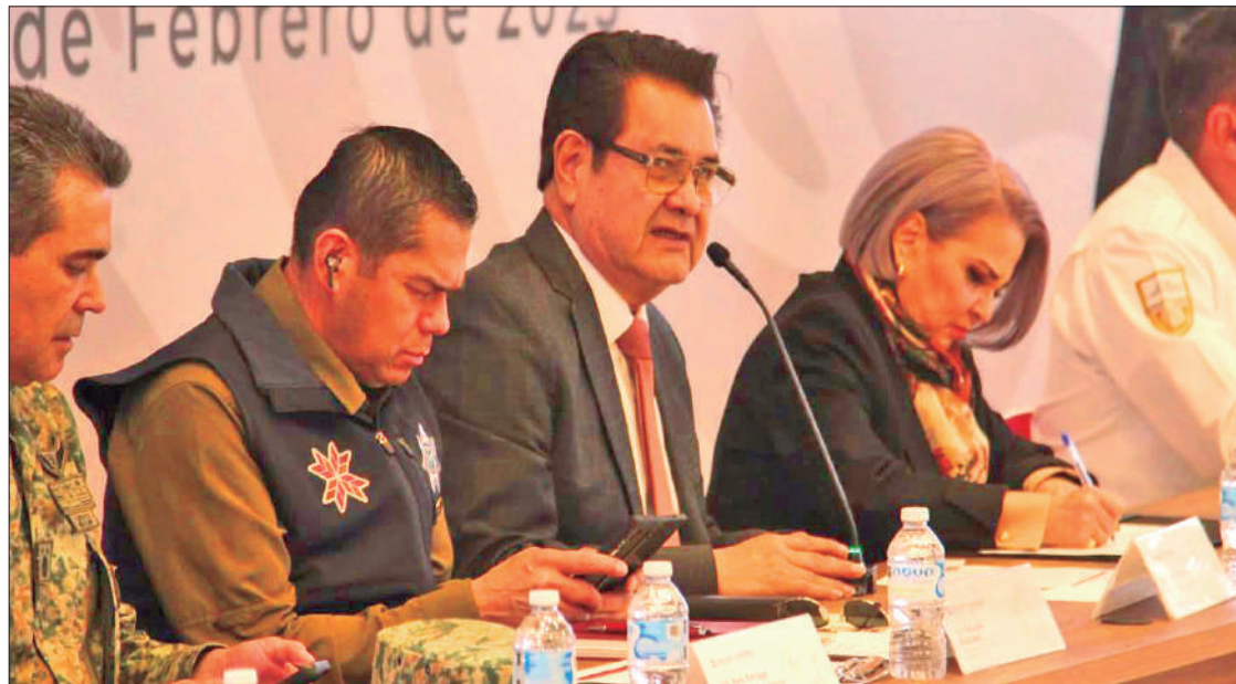
GUILLERMO OLIVARES. Hay y seguirá habiendo respeto hacia todos los servidores públicos del estado de Hidalgo y del país.

"No sé porque la califican como mala relación, reitero, de nuestra parte nunca hubo confrontación, no sé si me hayan