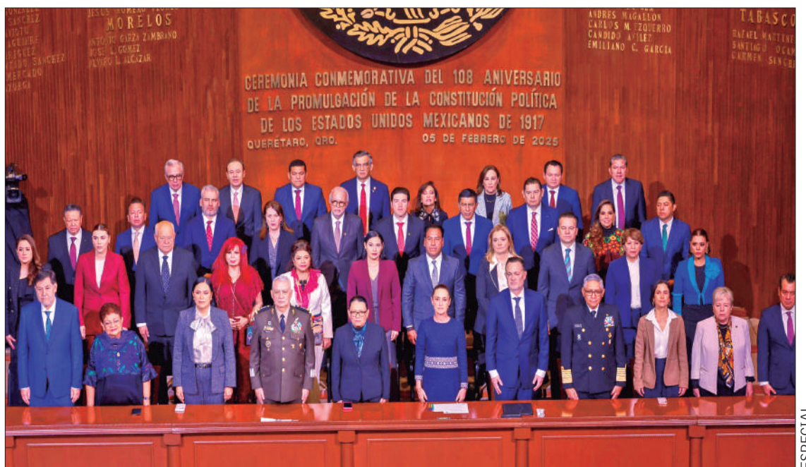
EN QUERÉTARO. Julio Menchaca Salazar respaldó a la presidenta de México, esto en la ceremonia conmemorativa del 108° Aniversario de la Promulgación de la Constitución Política de los Estados Unidos Mexicanos.

También enfatizó que la Carta Magna es el escudo que protege a la nación... 3