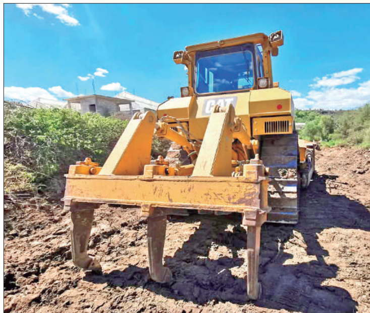
TRABAJO. La última etapa de la carretera ya está por llegar a la comunidad El Palmar.

Comentó que esta última etapa de la carretera ya está por llegar a la comunidad de El Palmar, la intención es ampliar las vías de comunicación y que éstas también lleguen a otros desarrollos tu-