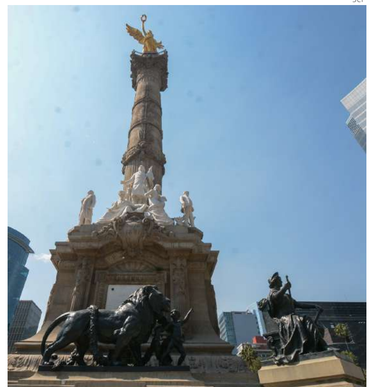
El Ángel de la Independencia tras su restauración.

Fue un proyecto de restauración, explica la dependencia federal, que fue coordinado por la Dirección General de Sitios y Monumentos del Patrimonio Cultural, inició el 14 de noviembre de 2024 y concluyó el 5 de febrero de 2025, con la participación de personal especializado del taller de escultura del CENCROPAM del INBAL. ●