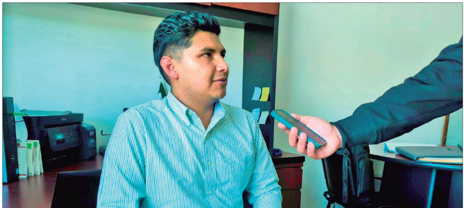
VALOR. Tulancingo forma parte de los municipios hidalguenses que cuenta con una oficina de enlace con el Centro de Conciliación Laboral del Estado de Hidalgo.

En lo que va de esta administración, la oficina municipal estima que el beneficio para la clase trabajadora es por un monto económico superior a 258 mil pesos con el pago de prestaciones.