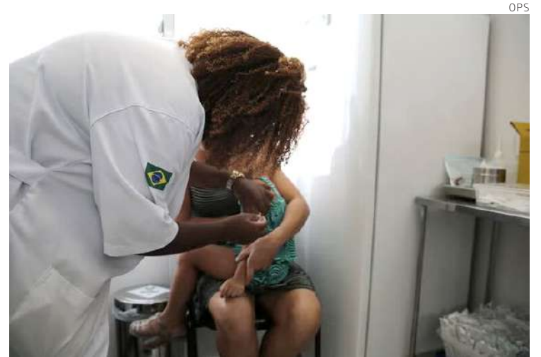
La fiebre amarilla puede provocar insuficiencia hepática e ictericia.

En respuesta, las autoridades sanitarias mexicanas han reforzado las estrategias preventivas, centrándose en el control del vector y la vigilancia epidemiológica en zonas de alto riesgo, especialmente en el