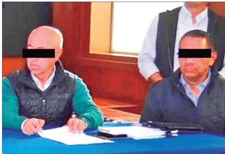
INVESTIGACIÓN. Fueron denunciados por participar en la creación de un esquema fraudulento para desviar recursos de la empresa, vender cemento robado y despojar a los cooperativistas de la fábrica.

responder a los señalamientos ante la autoridad competente, por lo que un juez habrá de determinar las causas de su detención y proceso jurídico.