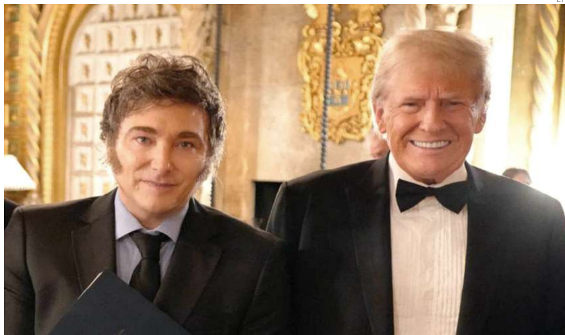
El presidente de Argentina, Javier Milei, y su admirado presidente de EU, Donald Trump.

Dijo que el confinamiento argentino, entre marzo y noviembre de 2020 y lentamente flexibilizado, “dejó a los niños fuera de la escuela, a cientos de miles de trabajadores sin ingresos, llevó a comercios y pymes