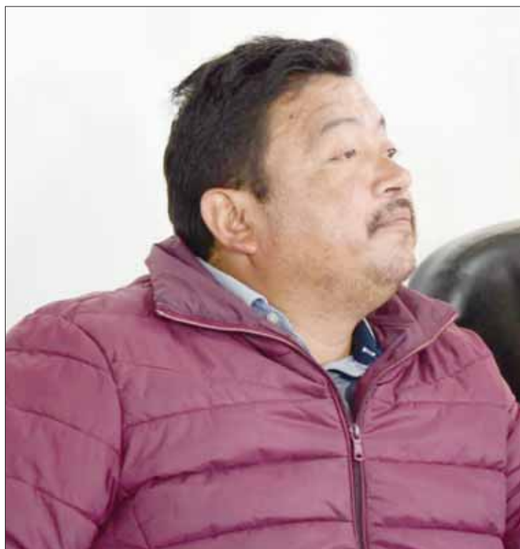
RAPIDEZ. Confirmó el munícipe que ya fue adquirido un predio para iniciar estas labores de inmediato.

Hasta este sábado en Tlahuelilpan se habían producido más de 25 entierros de personas que perecieron en la explosión del pasado 18 de enero en la comunidad de San Primitivo, se prevé que las inhumaciones continúen en próximos días, ya que siguen presentándose decesos día tras día.