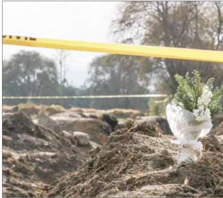
CONTEO. Hasta el momento el accidente dejó ya a más de 110 personas fallecidas, según las cifras oficiales.

Informó que Petróleos Mexicanos (Pemex) ya realiza una limpieza y remediación de la zona y también colaborarán con ellos para los trabajos. Comentó que expertos en la materia determinarán el daño ecológico en la zona a través de mediciones del área afectada.