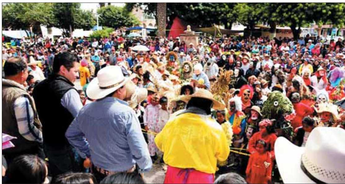
TURISMO. Ahora varias comunidades participarán en preparativos, con el fin de atraer también ganancias económicas.

lebración de purificación e inicio del ciclo agrícola, de ahí que también se realiza un desfile por las principales calles de la cabecera municipal, donde los participantes suelen ir disfrazados de personajes característicos del acervo popular de esta región.