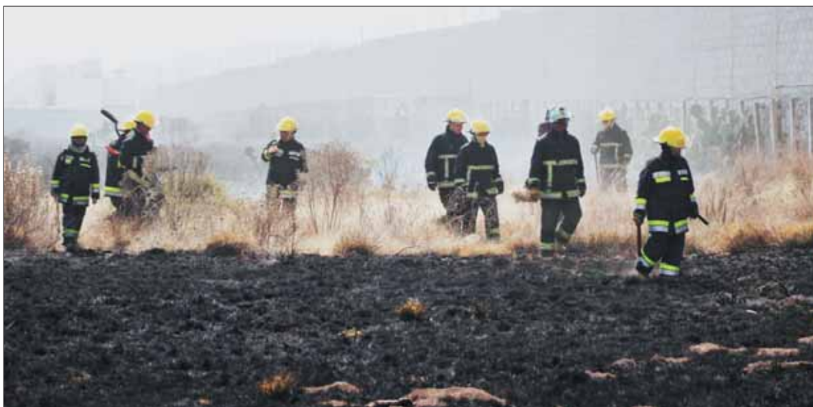
Movilizó incendio en predio a cuerpos de emergencia de Pachuca. Bomberos sofocaron el fuego, que consumió varias hectáreas.

■ Estudian daños Semarnat y Profepa con el objetivo de determinar acciones a seguir ■ Suman ya más de 110 fallecidos por este accidente registrado en Tlahuelilpan; cifra