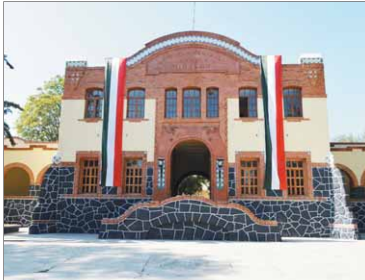
DOCENCIA. Contará, según los planes, con diversas alternativas para estudiar.

En México se abrirán 100 nuevas universidades, entre ellas la "Luis Villarreal" de Hidalgo, que contará con bibliotecas, salas de cómputo, aulas, comedor, laboratorios, cam-