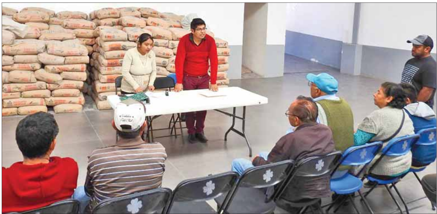
SUMATORIA. Con ello más habitantes lograron incorporarse al programa que maneja el área de Desarrollo Social en este municipio hidalguense.

Referente a este último, Pontigo Loyola puntualizó que es un evento único en México dedicado a las artes visuales, con 85 actividades planteadas, entre conferencias, talleres, mesas redondas, exposiciones, entre otros. (Adalid Vera)