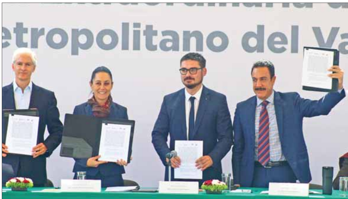
Signaron mandatarios documento a favor de la zona metropolitana, para mejorar condiciones a ciudadanía.