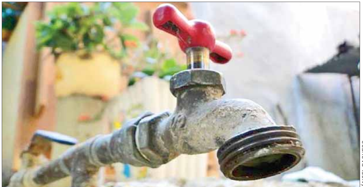
LABORES. Reacción de la Comisión de Agua Potable, Alcantarillado y Saneamiento para resolver este problema.

Por último, cabe mencionar que personal del área operativa de la Comisión de Agua Potable, Alcantarillado y Saneamiento de Santiago Tulantepec (CAASST) trabajó con el fin de realizar la reparación y restablecer el servicio lo antes posible, y señalaron a la temperatura, así como la antigüedad del material como las causas de la fuga que produjo el desabasto de agua potable en la cabecera municipal.