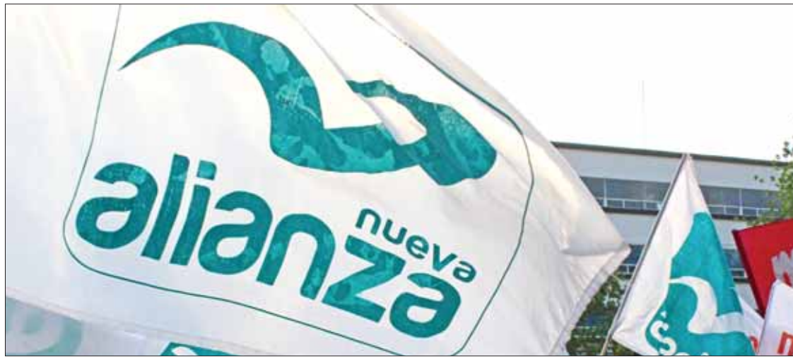
CONFIANZA. Indicó dirigente que Finanzas debe tomarlos en cuenta y corregir durante este año.

► No fue considerado en Presupuesto de Egresos 2019, porque en ese momento carecía de registro