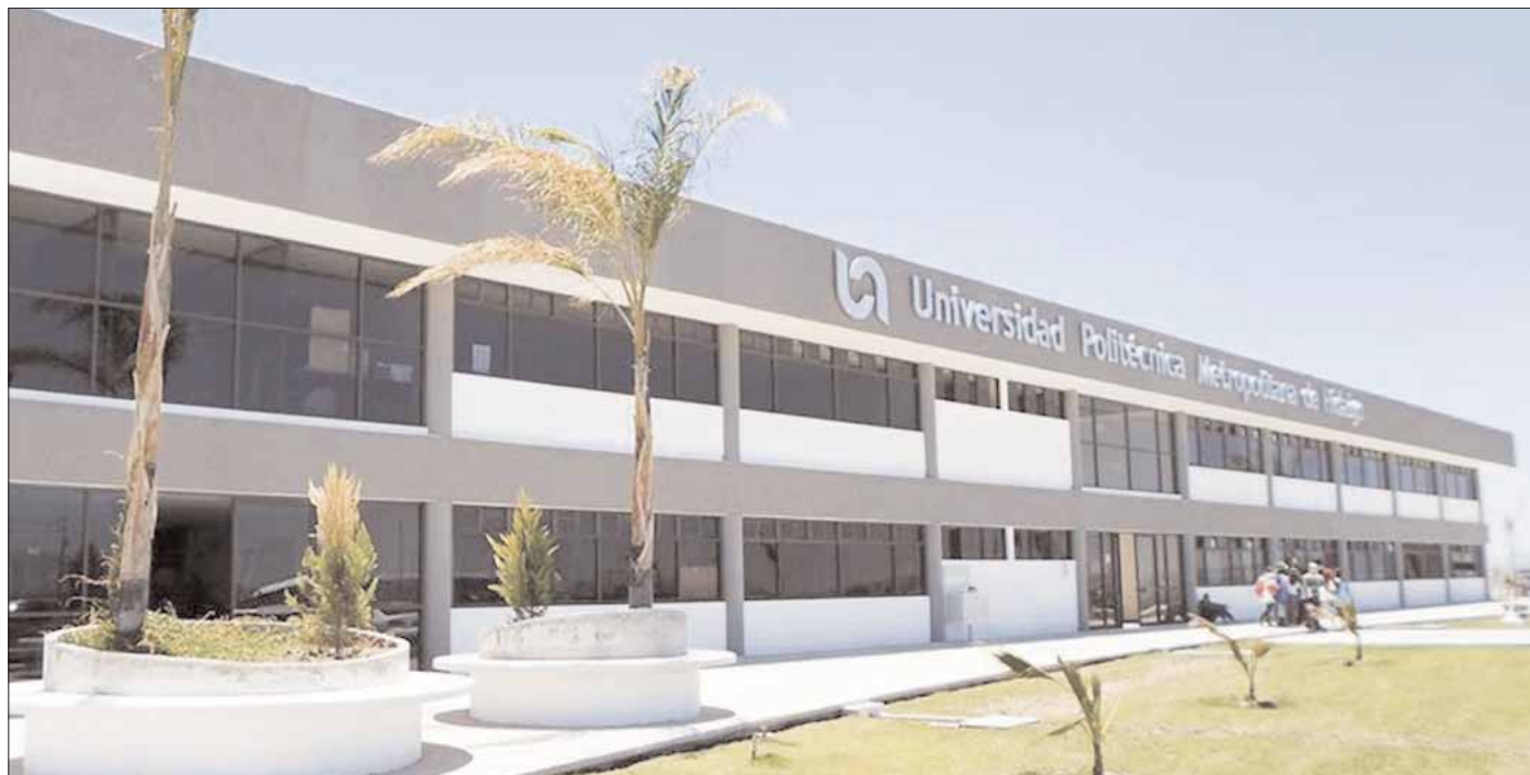
CONVOCATORIA. Meta es prevenir entre la comunidad universitaria la aparición de enfermedades como hipertensión arterial y diabetes mellitus.

Se realizará la suma de los kilogramos de todo el equipo y durante seis meses consecutivos se medirá el peso por equipo. El