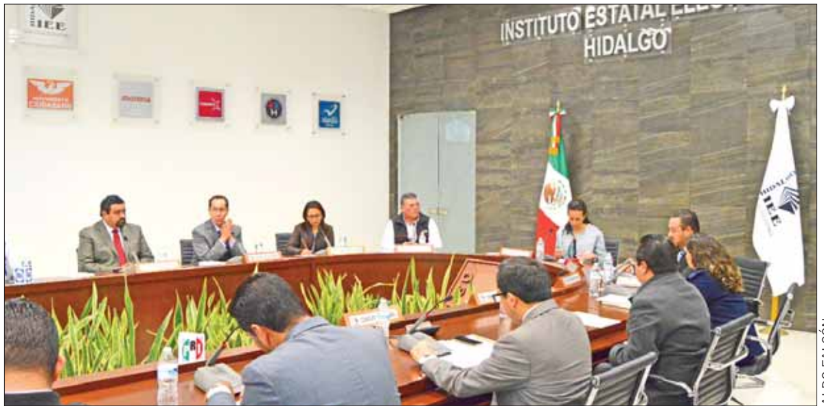
BASES. Una de las premisas es comunicar los espacios por un acceso al área existente, además incluye sanitarios, sitios administrativos, cubículos, así como muebles de oficina, equipos de cómputo, etcétera.

En sesión del pleno, la Secretaría Ejecutiva informó sobre la sentencia del TEEH-JDC-056/2018 respecto al ordenamiento del Tribunal Electoral del Estado (TEEH) para que el Poder Legislativo modifique las normativas correspondientes, a fin de incluir lineamientos que garanticen la participación de representantes de pueblos y comunidades indígenas en procesos comiciales.