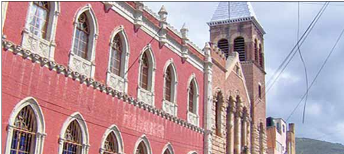
INCOMPATIBLES. Pormenorizaron afectados situación al interior de plantel donde practican Cristianismo Metodista.

► Presentaron docentes queja ante la CDHEH al presuntamente ser despedidos de escuela