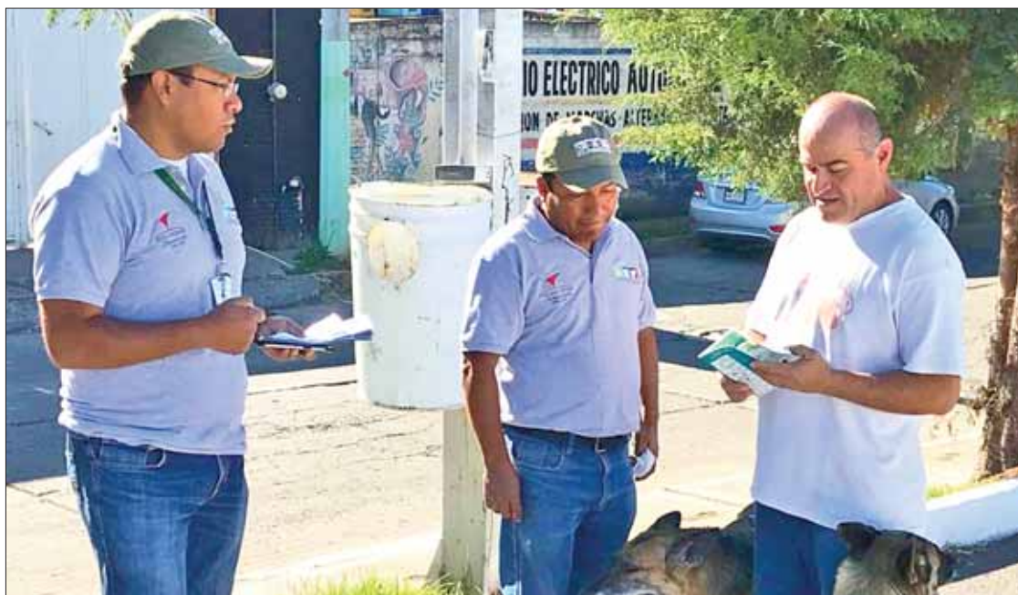
PLUS. Municipio se posiciona entre los primeros que cuenta con una reglamentación aplicable en torno a la protección de mascotas y también como una demarcación en la que se abona al control canino.

Enfatizó que es trascendental escuchar de viva voz a ciudadanos interesados y en especial a las Asociaciones Civiles legalmente constituidas para nutrir las bases de este proyecto. (Redacción)