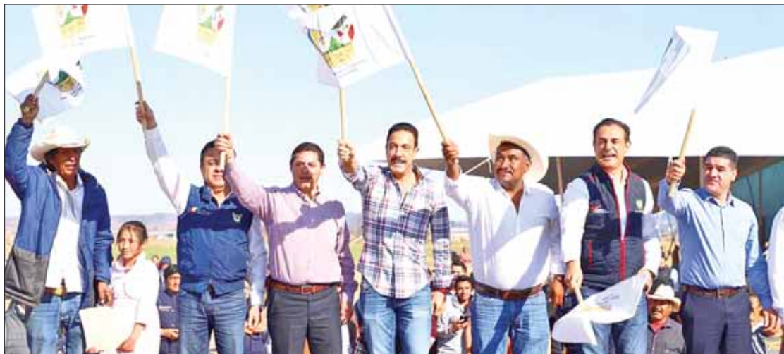
TAREAS. Solicitó tanto a población como a alcaldes de la región cuidar que trabajos tengan calidad.

cretas se trabaja en el mantenimiento de carreteras y caminos, el objetivo es beneficiar a usuarios del transporte público, a quienes tienen vehículos propios y a los visitantes.