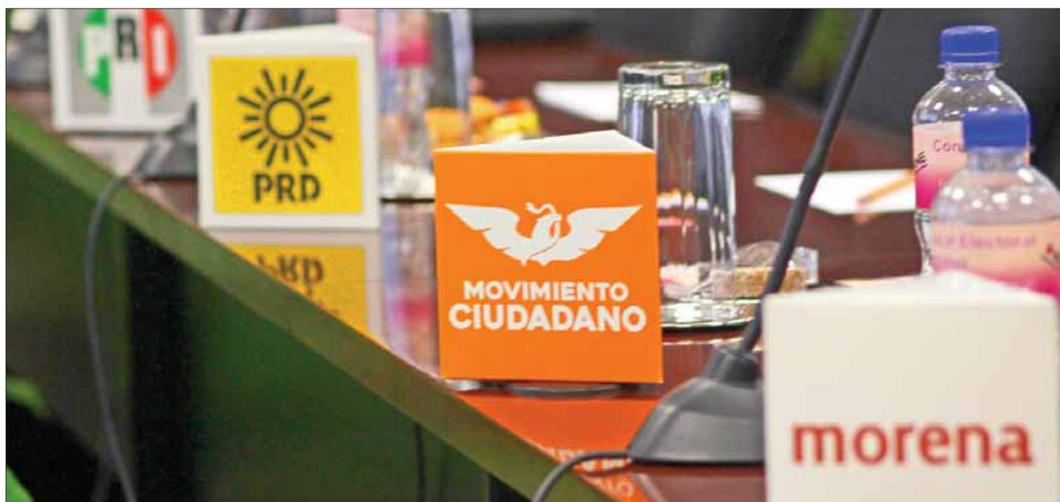
NUMERALIA. El tricolor es seguido por PRD, el cual superó las 5 mil inconformidades y después el Panal, de acuerdo con los resultados.

Asimismo facultaría al Congreso de la Unión a que expida una legislación única de carácter nacional sobre extinción de dominio, que supla a la actual Ley Federal de Extinción de Dominio. (Jocelyn Andrade)