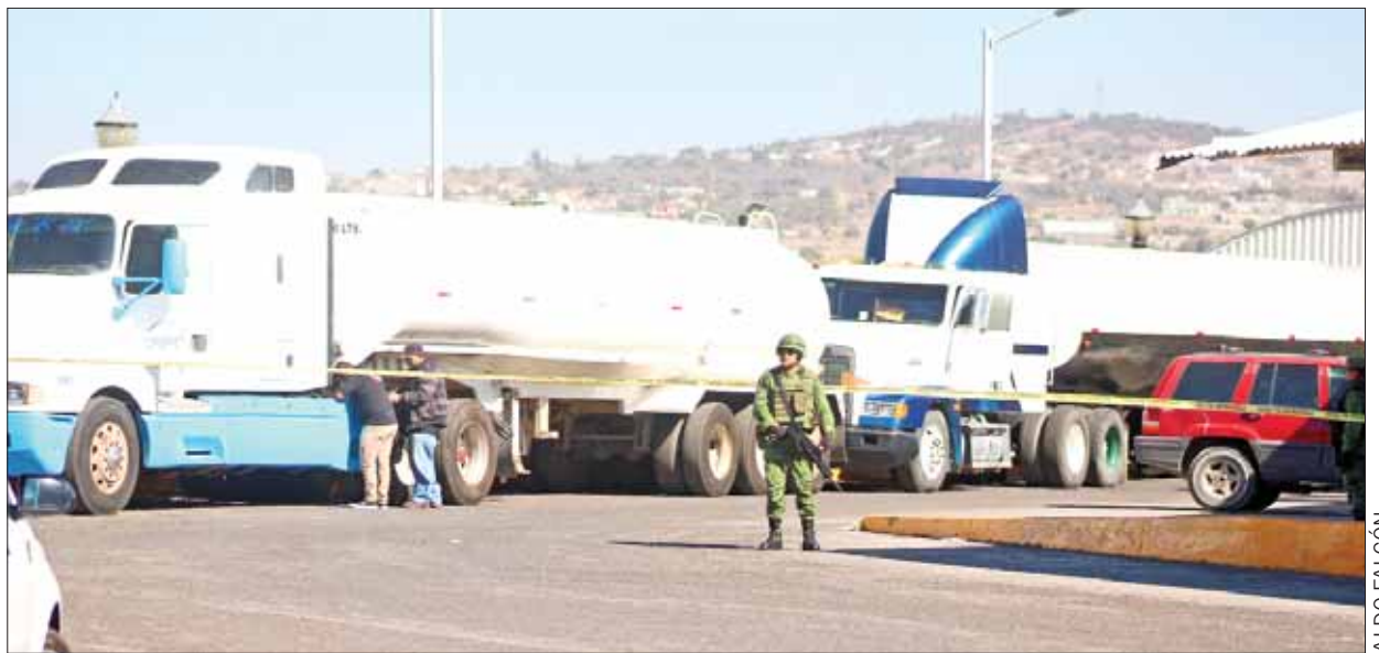
Banda de presuntos huachicoleros fue detenida en Hidalgo, mientras intentaban vender gasolina robada.

"Hoy debemos estar más unidos y coordinados en el combate a la corrupción". .3