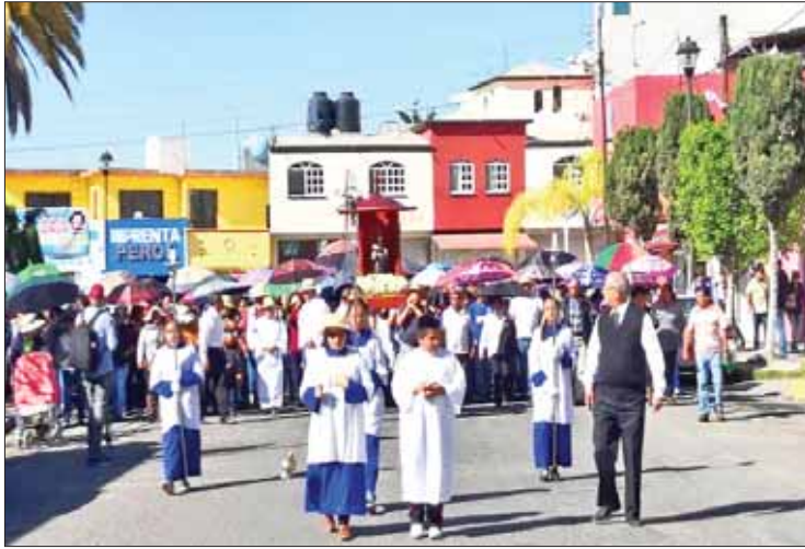
POBREZA. Expusieron clérigos que en Hidalgo existe mucho talento para salir adelante.

Al oficiar misa en la denominada zona cero (donde explotó el ducto de Pemex el pasado 18 de enero y que a la fecha cobró la vida de 117 personas) autoridades eclesiásticas encabezadas por el arzobispo de Tullancingo, Domingo Díaz Martínez, pidieron por el descanso eterno de las víctimas de Tlahuelilpan, así como la pronta