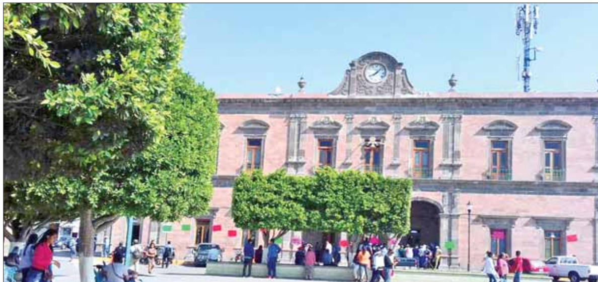
SITUACIÓN. Expusieron familias urgencia de contar con el líquido vital, pues llevan meses sin ser atendidas.

Por lo anterior, los pobladores de Usdeje exigieron a los regidores de Ixmiquilpan intervenir directamente para aclarar este tema, sobre todo porque el ayuntamiento reporta gastos para el abastecimiento de agua potable a través de pipas; sin embargo, varios poblados de la zona norte no gozan de este servicio.