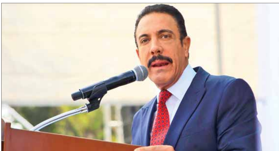
Gracias a las instrucciones del gobernador Omar Fayad, Hidalgo ocupa el segundo lugar a escala nacional con el mejor Sistema Estatal Anticorrupción. .2