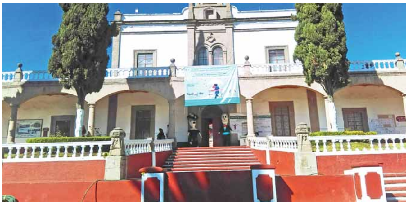
CASO. El edil fue evidenciado por una regidora, quien argumentó que pasaría de 63 a 90 mil pesos mensuales.

Por último manifestó que no se puede hablar de aumentos salariales cuando algunos fondos y programas federales que recibía el ayuntamiento fueron recortados.