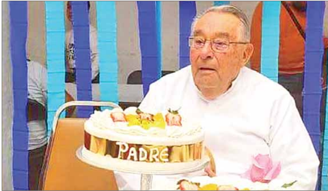
FORTALEZA. Indicó que su propósito vital fue mantener siempre a la feligresía católica unida ante los cambios sociales.

Explicó que, de acuerdo con la Ley Canónica, los sacerdotes a los 70 años presentan su retiro, pero anticipó que en su caso se tuvo la paciencia de mantenerlo al servicio de la Iglesia