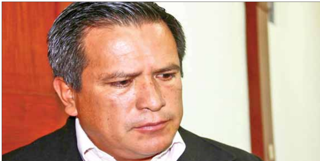
ENOJO. Indicó Caballero que CEN debe pensar en los cuadros formados que trabajaron para construir al organismo.

"Estamos en espera de la decisión del CEN; sin embargo, la militancia y estructuras de Morena en Hidalgo, el hecho de que se discipline a que haya designación de la dirigencia nacional no implica que no emitan un juicio crítico,