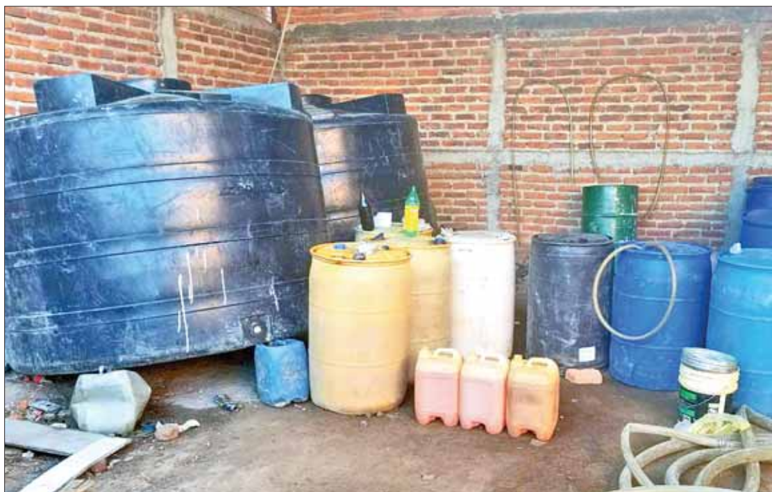
PRECISIÓN. Sostuvo edil que son constantes las detenciones de vehículos y aseguramiento de combustible.

Destacó un par de aseguramientos realizados durante el pasado fin de semana, uno por la