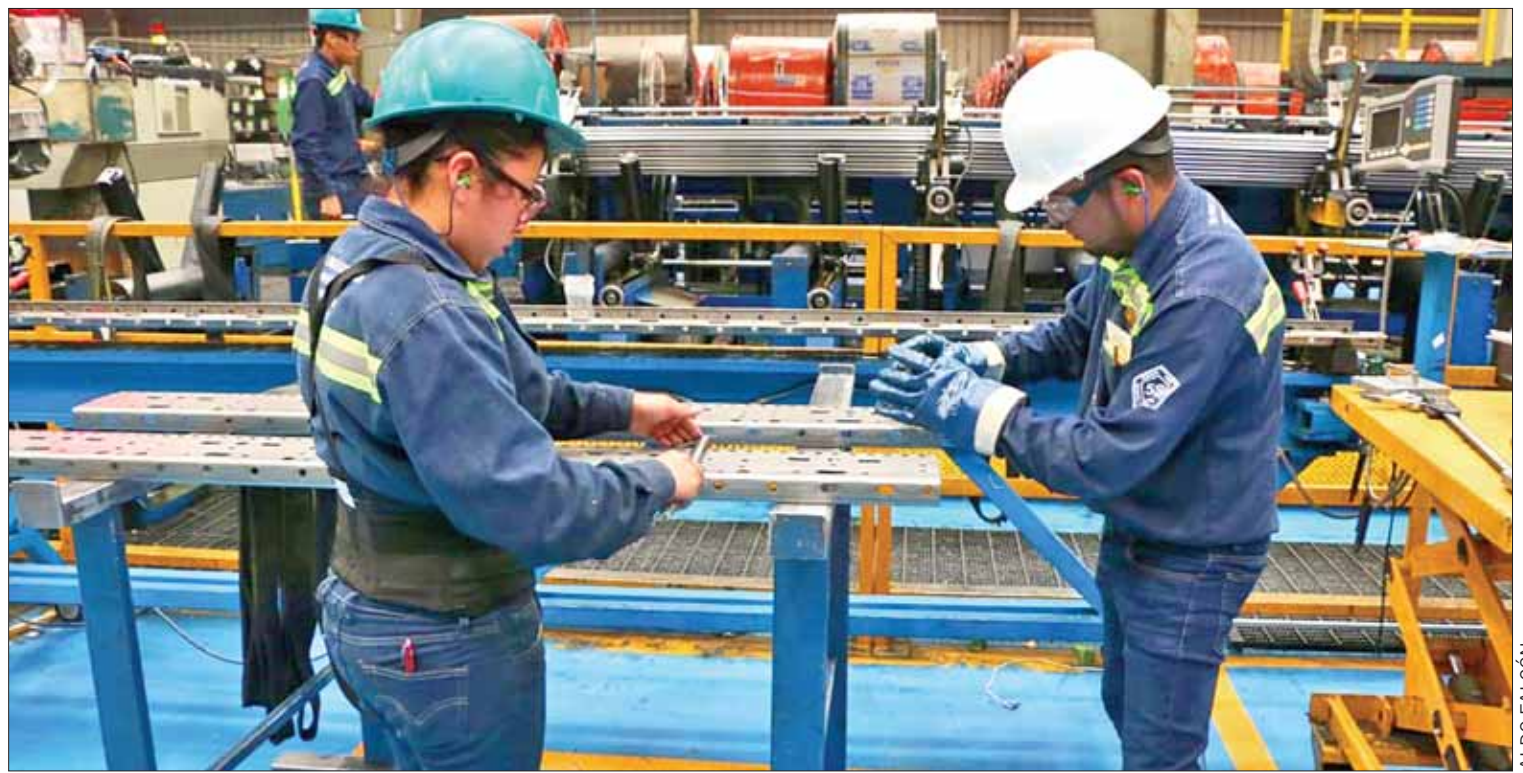
SUSTENTO. Apuntó el titular de la Sedeco que hoy la entidad posee un rostro distinto, el cual tiene que ver con un crecimiento sólido.

De manera especial se robusteció el área de Citología y en específico al programa de detección de Cáncer Cervicouterino, al modificar el procedimiento de Citología convencional al uso de PCR y biología molecular a base líquida, método que por su eficacia se ha extendido a diversos países, y en México sólo estados como Yucatán, Baja California Sur, Guanajuato, Zacatecas, por supuesto, la entidad hidalguense poseen. (Alberto Quintana)