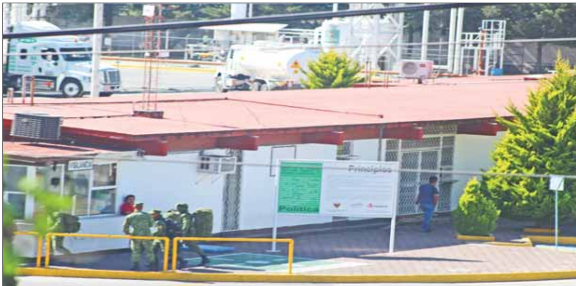
Arribó ayer más personal de la Sedena a instalaciones de Pemex en Hidalgo, para resguardar y acompañar pipas con hidrocarburos.