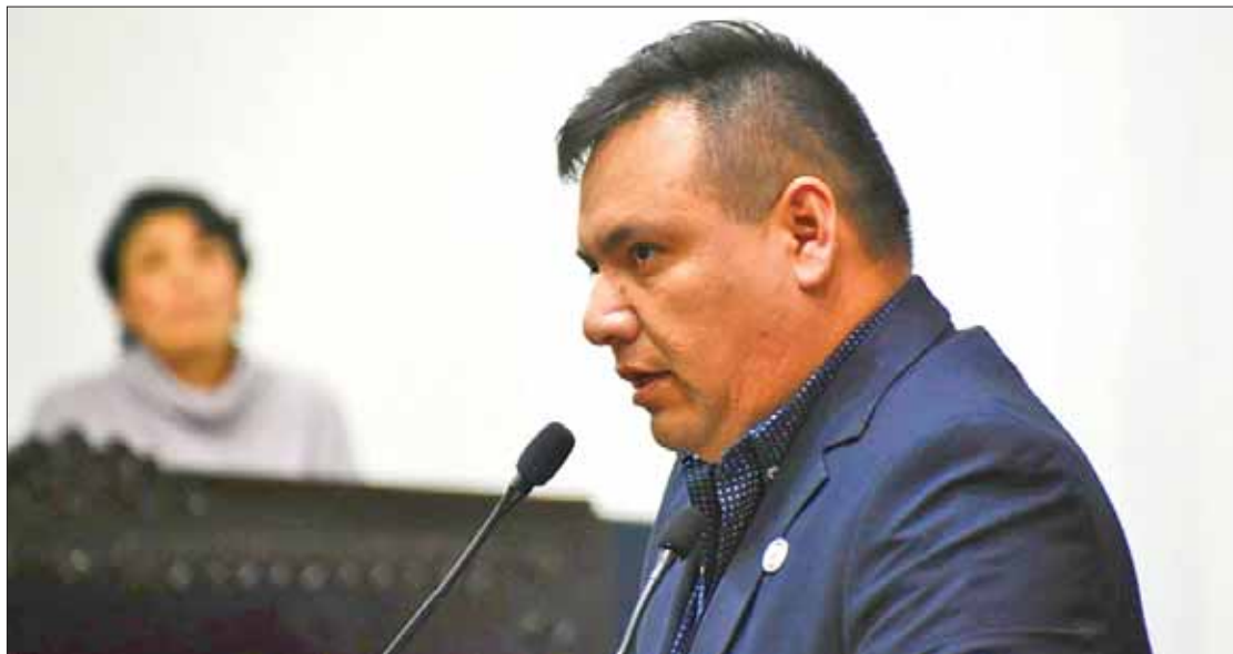
FRENTE. Sostuvo el morenista local que este logro fue gracias al diálogo con los grupos del estado.

Reveló que la propuesta inicial del Ejecutivo contemplaba poco más de 200 millones de pesos; sin embargo, en el Presupuesto de Egresos aprobaron un monto de 300 millones de pesos, equi-