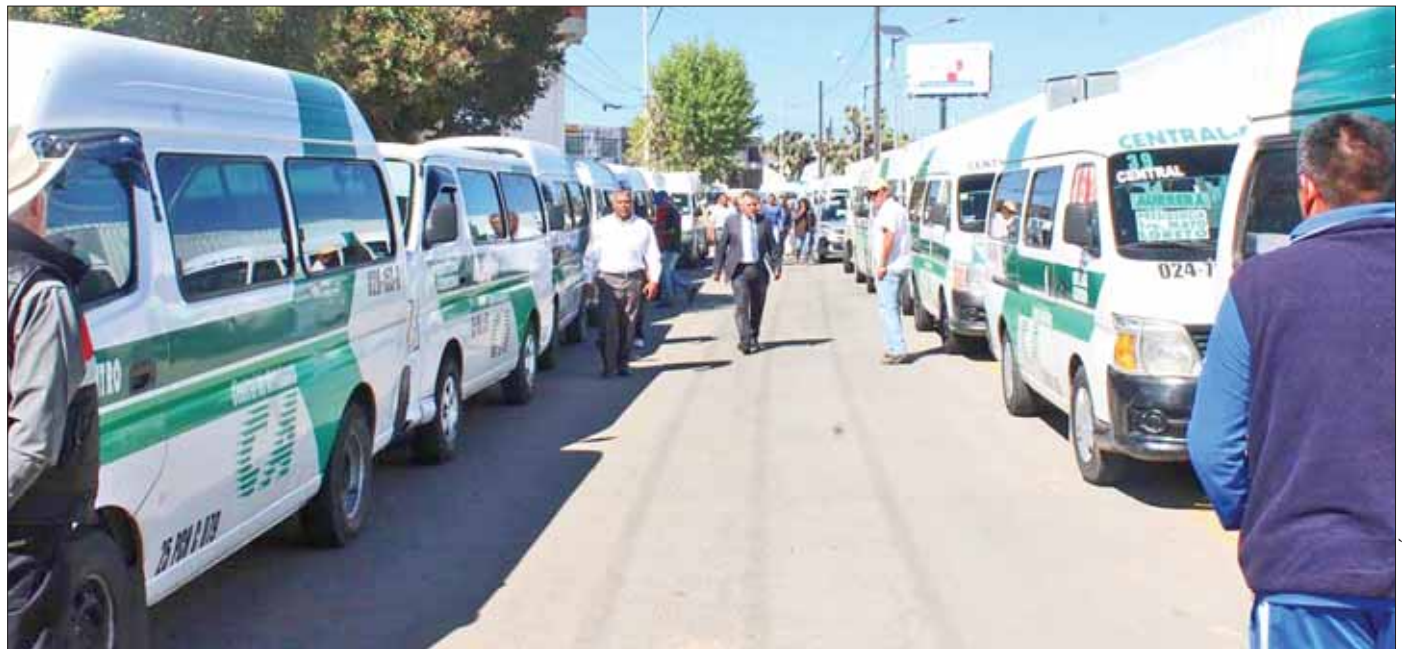
GASTO. Manifestaron que las autoridades deben ser conscientes de lo que representa el pago de pasajes.

"Aún no hay nada concreto, pero se buscará tener acercamientos de algunas personas que se han interesado en participar en el tema e impulsarlo y no se descarta que en un corto plazo se solicite entablar mesas de diálogo tanto con diputados como con los transportistas, de alguna u otra forma es posible lograr acuerdos que beneficien a unos y que no afecten a los otros".