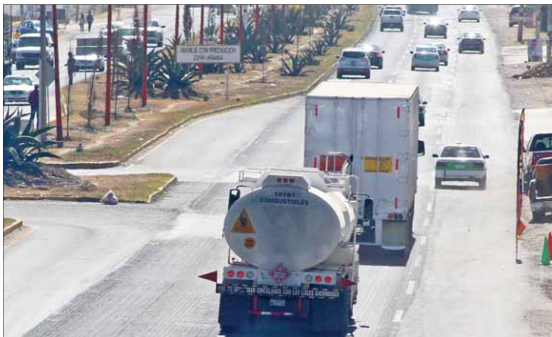
DUCTOS. Indicarón dirigencias que López Obrador debió tener un plan antes de cerrar las válvulas.