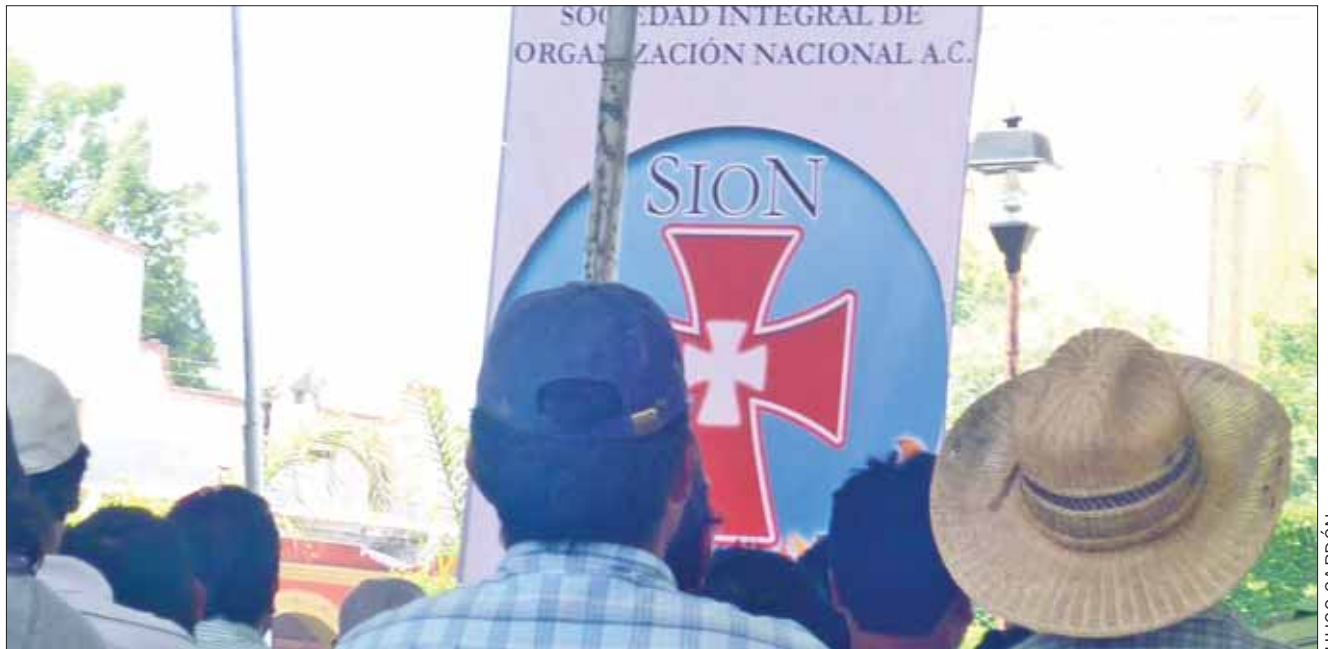
SEDES. Luego de hacer limpieza comenzaron con la colocación de banderines del organismo denominado SION.

Esta no sería la primera vez que esta organización toma las instalaciones públicas, pues hace tres años hicieron lo propio con las oficinas de Morena, las cuales son propiedad de la alcaldía.