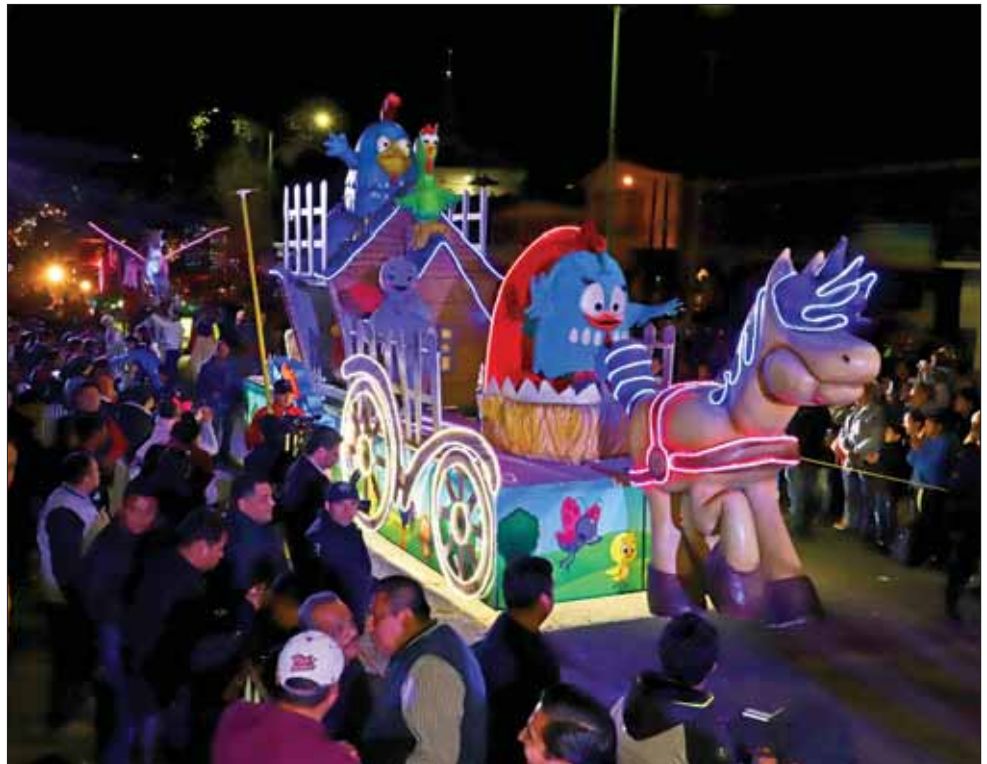
ALEGRÍA. Estuvo acompañado el mandatario estatal por comparsas y personajes de caricaturas.

Finalmente deseó a los presentes que 2019 traiga consigo cosas buenas para