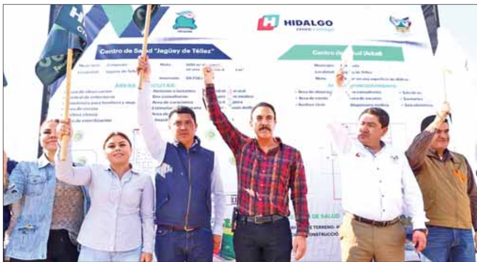
Vamos a seguir trabajando para que más familias cuenten con una mejor educación, salud de calidad y vías de comunicación eficientes. Con trabajo responsable es posible alcanzar el desarrollo de todos en Hidalgo; destacó Omar Fayad.

"Hay quienes se dedican a molestar y no trabajar, hay quienes critican y lo hacen sin sentido, pero los gobiernos federal y estatal tienen la obligación de responder a la población..."