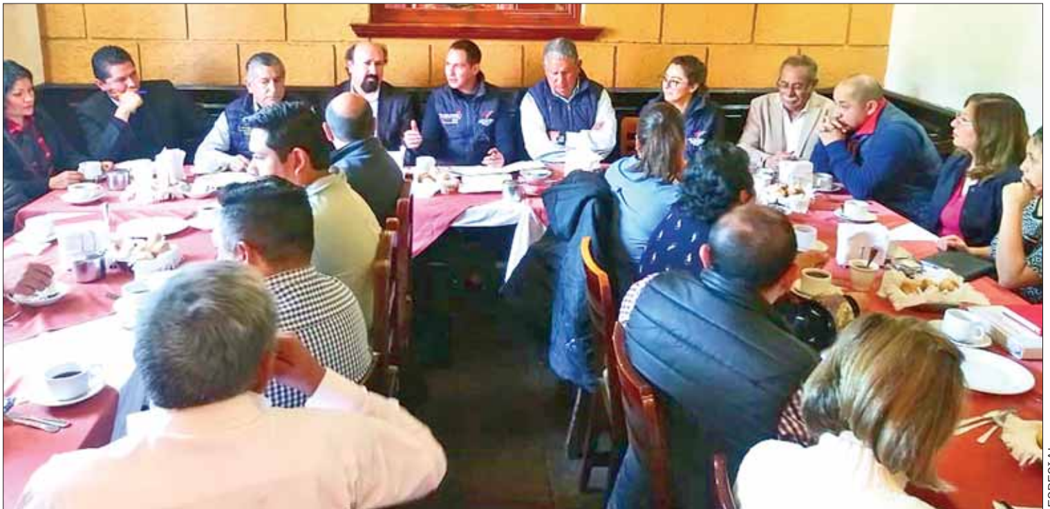
MÁS ADELANTE. Tienen programado un curso para la industria restaurantera, que tendrá como sede el Instituto Hidalguense de Competitividad Empresarial, en Pachuca.

Por otro lado, se dio a conocer los recorridos e información del Tulanbús, para que la asociación se sume al proyecto.