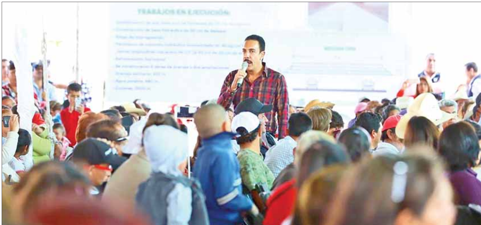
SITIOS. Desarrollaron placa para las oficinas de Atención de Servicios Municipales en esta demarcación, ayer por la tarde.