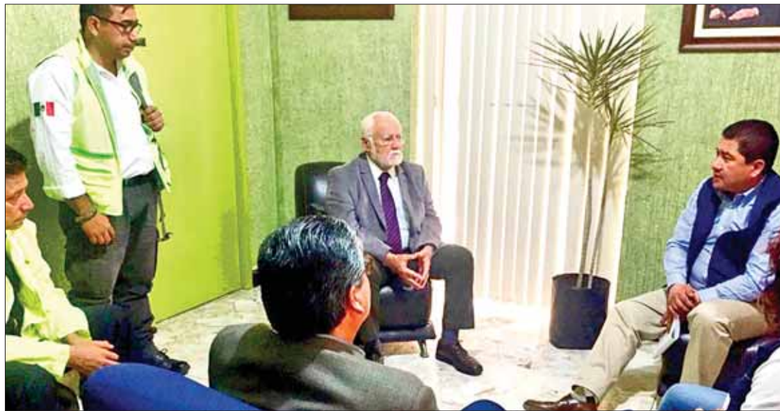
RESPONSABILIDAD. Titular de la SSH, Marco Antonio Escamilla Acosta, ha acudido de manera periódica al módulo de atención ubicado en el Centro Cultural de Tlahuelilpan, y que opera las 24 horas del día.

► Focalizados en atención médica y psicológica, prevención de riesgos sanitarios y orientación para ubicar desaparecidos