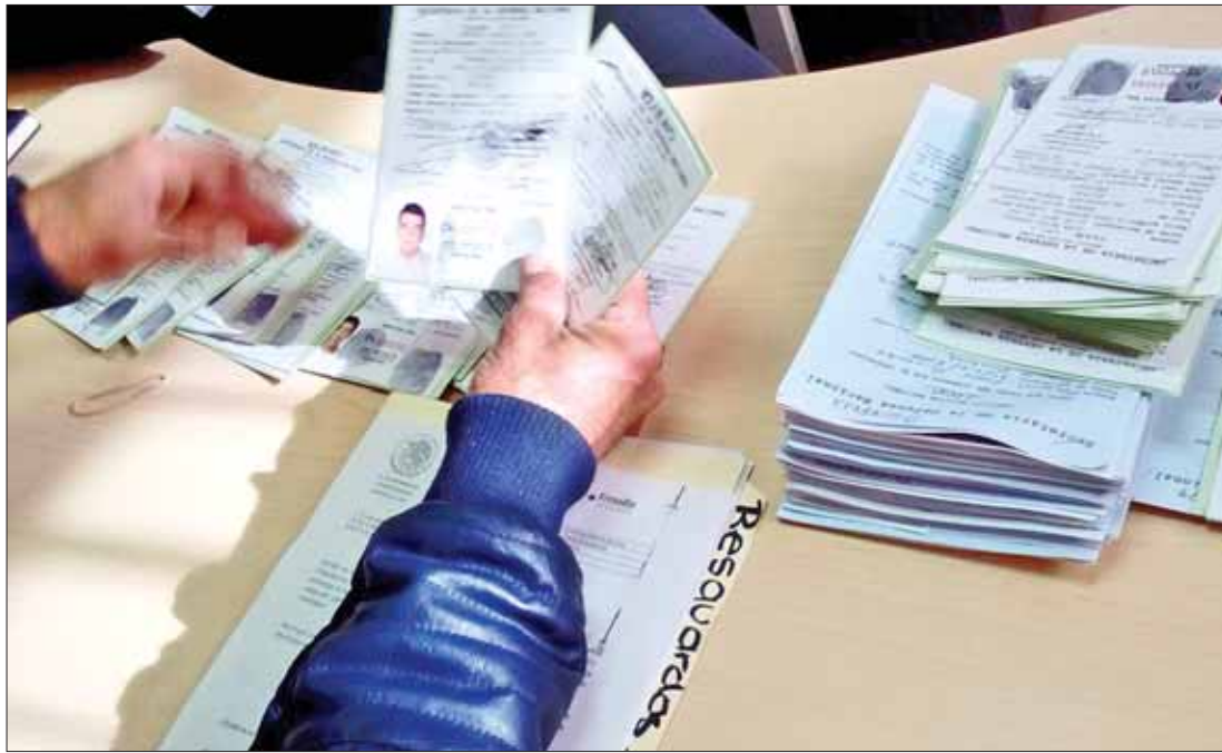
VOCACIÓN. Con este documento se fomenta el patriotismo entre jóvenes al igual que el respeto por la Nación y la comunidad.

Indicó la oficialía que los requisitos necesarios son: original y copia del acta de nacimiento, copia de CURP, original y copia del comprobante de domicilio, además de la copia de constancia del último grado de estudios, seis fotografías recientes de 35 por 45 milímetros, de frente a color blan-