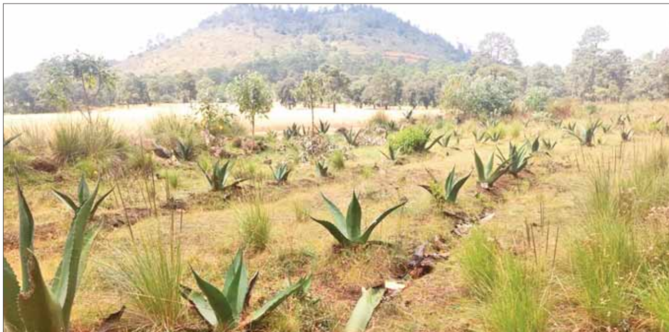
CAMINOS. Las necesidades actuales obligan a producir la planta con diversos fines y gracias a ello es posible tener un alto porcentaje de productividad.

Finalmente, dijo que se espera un 2019, muy provechoso para la región del altiplano, donde se han logrado apoyos importantes para el campo.