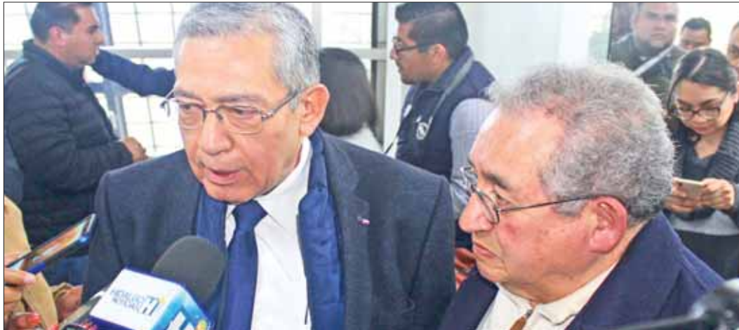
REACCIÓN. Expuso el encargado de la política interna que continuarán con los análisis, así como con estrategia de Hidalgo Seguro.

Por su parte la Unidad de Análisis Criminal del Centro de Control, Comando, Comunicaciones y Cómputo (C-4) recaba información a través del sistema de videovigilancia de la estrategia Hidalgo Seguro, para identificar a quien o quienes pudieran estar relacionados con la colocación de dichos objetos.