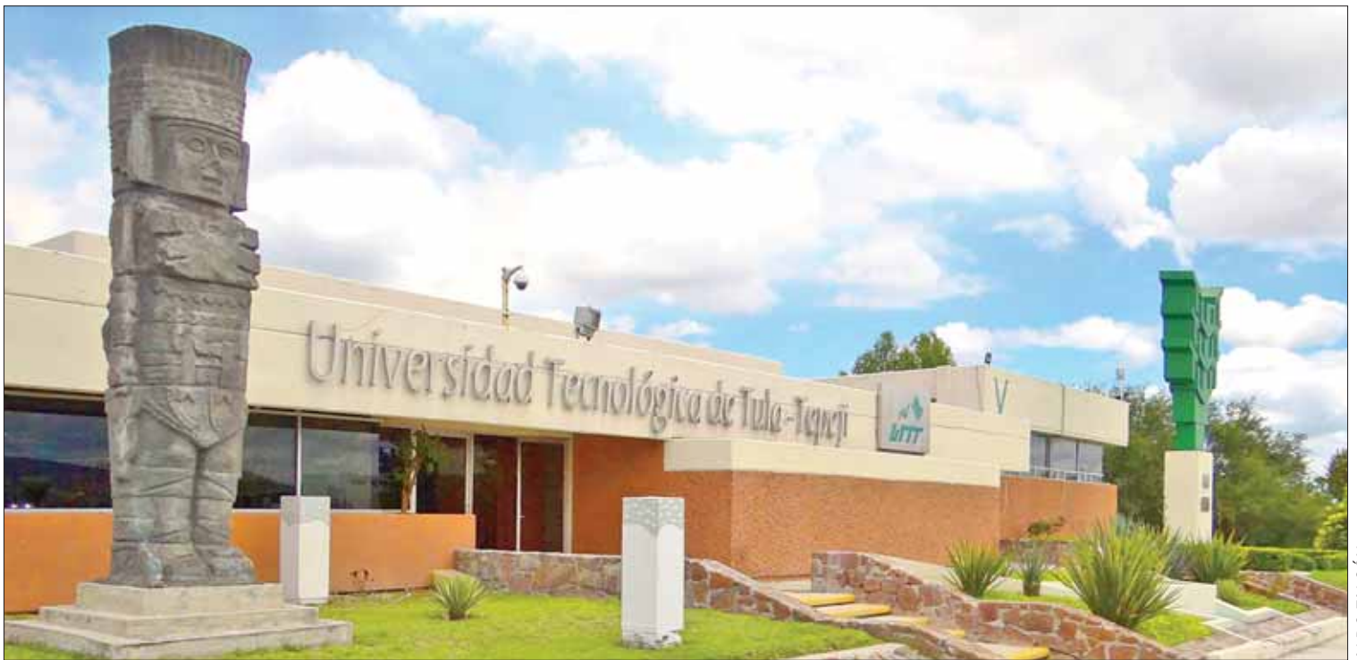
REQUISITOS. Deberán contar con certificado de bachillerato y calificación mínima de 7 para alcanzar un lugar.

El modelo educativo que ofrece la UTTT está orientado en un 70 por ciento práctica y permite a sus educando obtener experiencia laboral, por medio de estadías que efectúan en sectores empresariales.