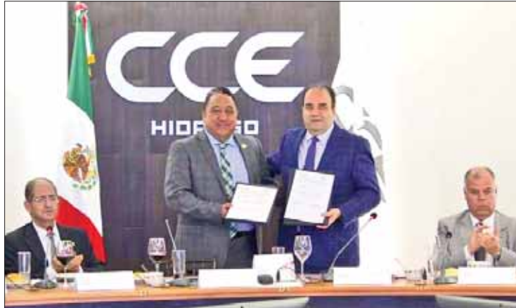
TEMA. Reforzarán organismos promoción de garantías individuales.

Explicó a socios y consejeros del organismo empresarial las funciones sustanciales de la CDHEH, ejecutadas mediante áreas orgánicas, la Visitaduría Ge-