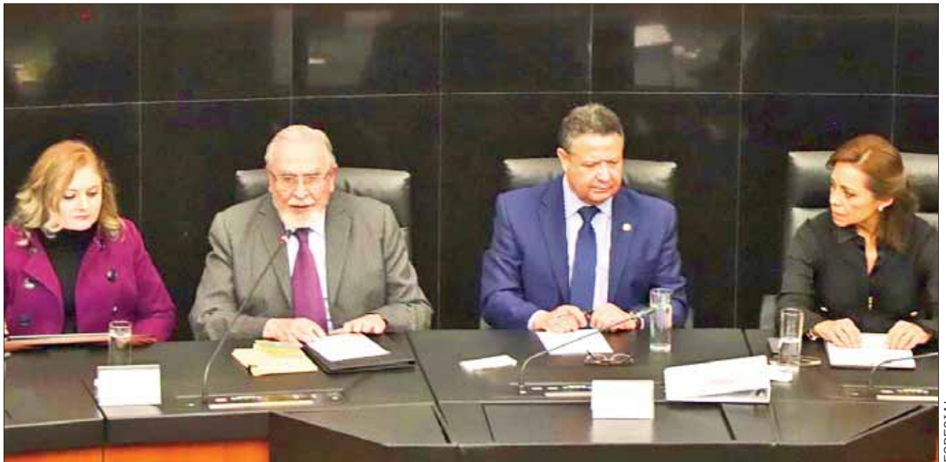
PASOS. Llegaron hasta la última fase, de entre una lista de 10 personajes que aspiraban a dicha responsabilidad.