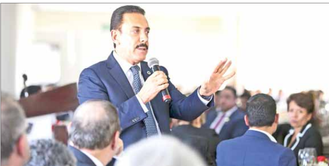
Durante encuentro con representantes de Canacintra, el gobernador Omar Fayad subrayó esfuerzos para convertir a Hidalgo en nuevo polo del desarrollo nacional. .2

Además de arcos carreteros, avión ligero con recorridos por distintos puntos de la entidad, drones utilizados para operativos y equipamiento con nuevas unidades. .3