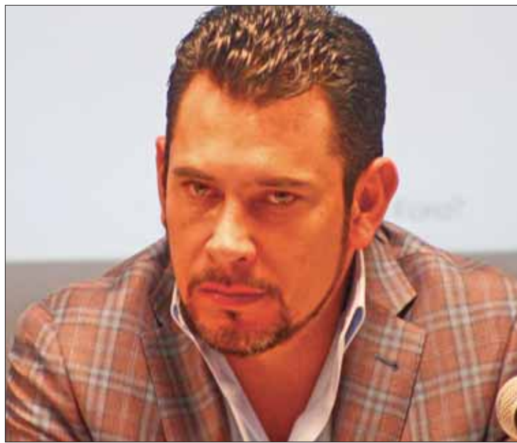
FORTALEZA. Contempla además arcos carreteros y nuevas tecnologías de punta para combatir a delincuencia.