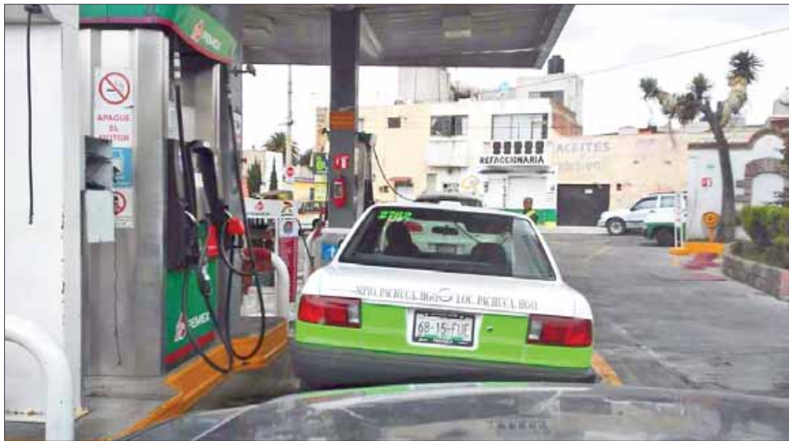
RELACIÓN. Publicó el organismo resultados de vigilancia que mantiene en entidades como Hidalgo.

La Profeco reportó que mejoró el abasto de combustibles en