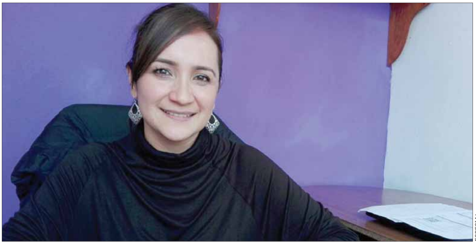
ESPECIAL ESCENARIO. Alcalde dejó abierta la posibilidad de que sean compatibles los horarios de la exdirectora; o en definitiva nombrar a su suplente.

No obstante, el Ejecutivo tepejano insistió en que no se les puede ayudar a los colonos por tratarse de particulares pues implicaría gasto de recursos públicos. (Ángel Hernández)