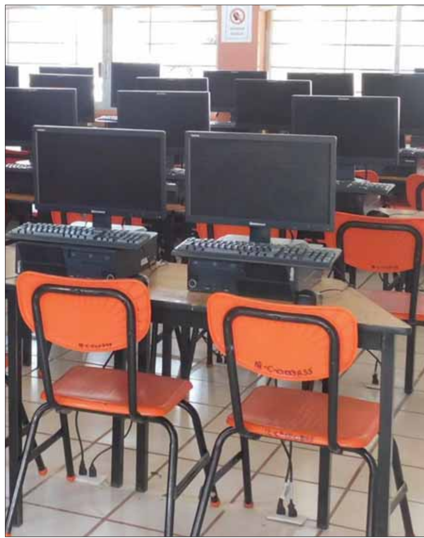
MIRAS. Actual administración estatal busca la consolidación de acuerdos que permitan emprender acciones que contribuyan al mejoramiento de diversos aspectos del entorno educativo.

Así como el mejoramiento de aspectos de movilidad internacional para estudiantes, personal académico y de apoyo a la educación; en los procesos y exámenes de ingreso a Educación Media Superior, así como la realización de actividades deportivas como la carrera Once K 2019, que organiza el Instituto Politécnico Nacional, entre otras.