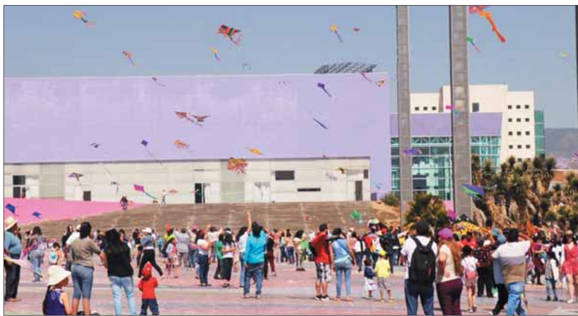
Realizaron en el Parque David Ben-Gurión, el festival "Vientos de Alegría": cientos de personas volaron sus cometas y disfrutaron diferentes espectáculos.

Indicó la dependencia que durante la segunda sesión del Comité de Planeación para el Desarrollo Regional (Coplader), este 15 de febrero, el secretario habló del trabajo realizado en la zona bajo el liderazgo del gobernador e invitó a autoridades de los tres poderes y de los tres niveles de gobierno a trabajar de la mano para encontrar soluciones y responder a las demandas de hidalguenses. 3