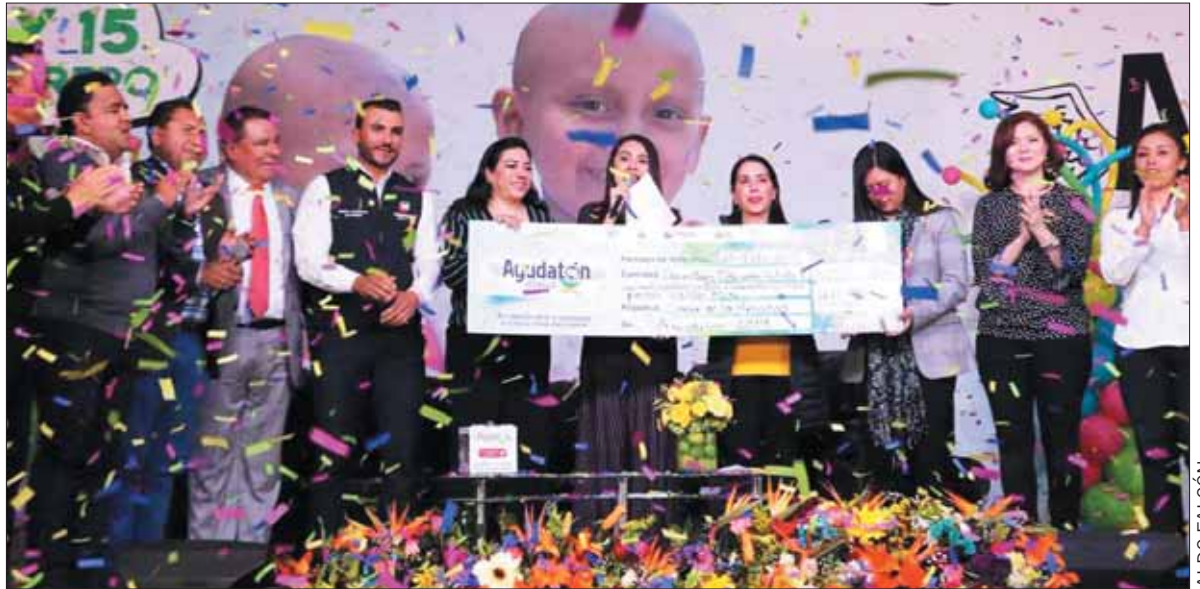
BONDADES. "Como organismos sociales felicitamos a las autoridades de Hidalgo por tener este tipo de iniciativas, sobre todo para ayudar en el tema oncológico directamente".

Argumentó que para el presente Ayudatón fueron diversos los organismos y grupos sociales que se sumaron al llamado que emprendió el gobierno de Hidalgo y que valió para que ahora los niños que se encuentran en tratamiento, dentro del Hospital del Niño DIFH, tengan la posibilidad de continuar con su asistencia.