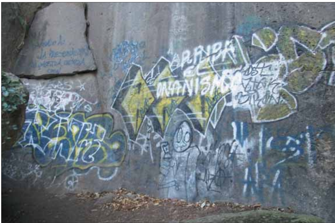
VESTIGIOS. Hablan de los primeros seres que habitaron la franja del suroccidente de la entidad, los primeros hombres que habitaron Tula.

Aún con la omisión de las autoridades competentes todavía se pueden apreciar sobre las piedras del lugar, en una superficie aproximada de diez metros varios aros con un círculo en su interior, medias lunas y animales de cuatro patas de diferentes tamaños, que