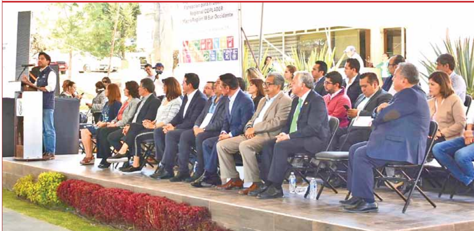
COPLADER. En segunda sesión del Comité de Planeación para el Desarrollo Regional el secretario habló del trabajo realizado en la zona bajo el liderazgo del gobernador Omar Fayad.

El gobierno de Hidalgo ha apoyado a más de 150 micro, pequeñas y medianas empresas, con una bolsa de 100 millones de pesos en financiamientos. Actualmente se cuenta con una lista de 1000 vacantes para jóvenes que buscan una oportunidad de empleo y adquirir experiencia.