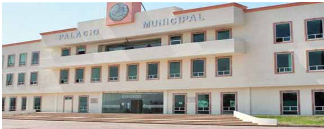
SANTILLÁN TREJO. Refiere titular de Finanzas local detalló que hasta el momento los 30 despidos han sido justificados: no esperan una demanda laboral en adelante.

siguen trabajando para ubicar a trabajadores que no deban estar en la nómina.