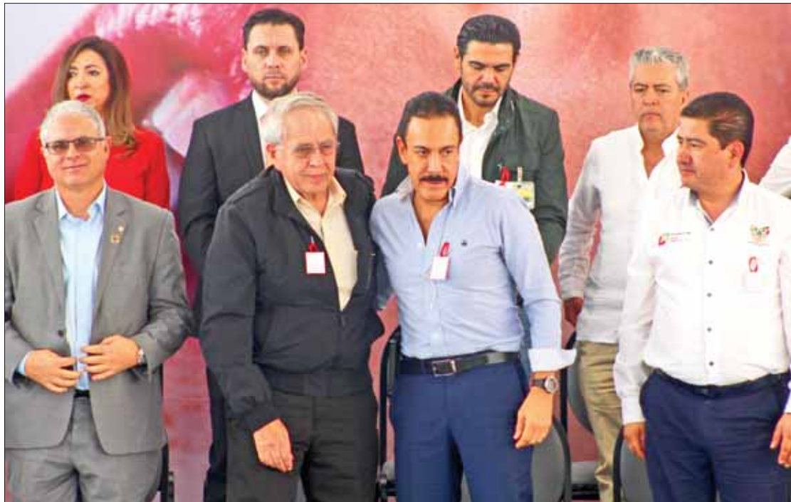
SUMATORIA. Enfatizó el mandatario estatal esfuerzos conjuntos y las dinámicas a desarrollar.

Subrayó el esfuerzo del Sector Salud por la implementación de la Cartilla Electrónica de Vacunación, pues Hidalgo sigue sien-