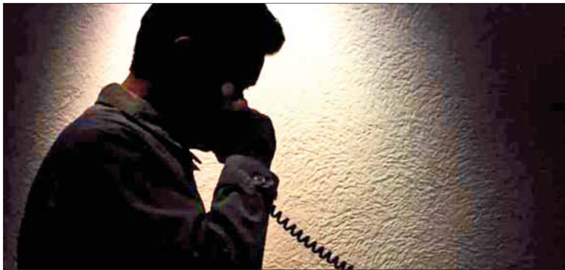
MANDO. Registró dependencia municipal varios casos durante las últimas semanas, confirmó.

Mencionó que en este 2019 se invertirá para que los agentes cuenten con más y mejor equipo táctico, además de recibir capacitación en materia de derechos humanos a raíz de la recomendación recibida después de los hechos violentos de la comunidad de Santa Ana Ahuehupan. (Ángel Hernández)