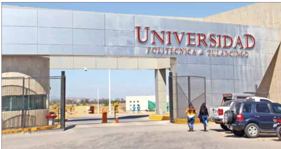
VENTAJAS. Representa una buena opción con el fin de que salgan bien preparados, indicó el rector.

La propuesta de la actual administración no reconoce la necesidad de una educación intercultural, sino promueve la educación bicultural ignorando las necesidades educativas de las 68 lenguas y culturas indígenas de México. (Adalid Vera)