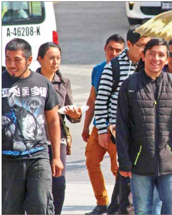
RELACIÓN. Más de 255 mil personas (20.0%) trabajan en el sector primario.

Al considerar a población ocupada con relación al sector de actividad económica en donde participa, más de 255 mil personas (20.0%) trabajan en el sector primario, alrededor de 319 mil (25.0%) en el secundario o industrial y arriba de 698 mil (54.8%) están en el terciario o de