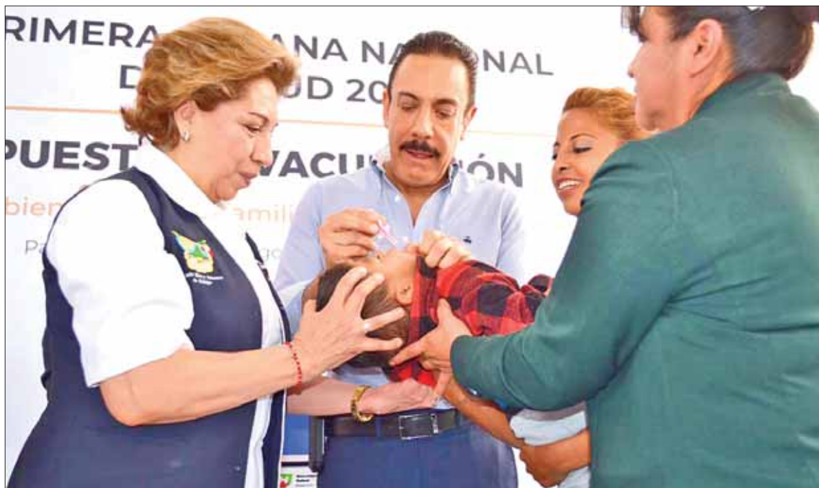
Durante la Primera Semana de la Salud 2019, el propio gobernador Omar Fayad aplicó la primera dosis de vacuna Sabin en Hidalgo.