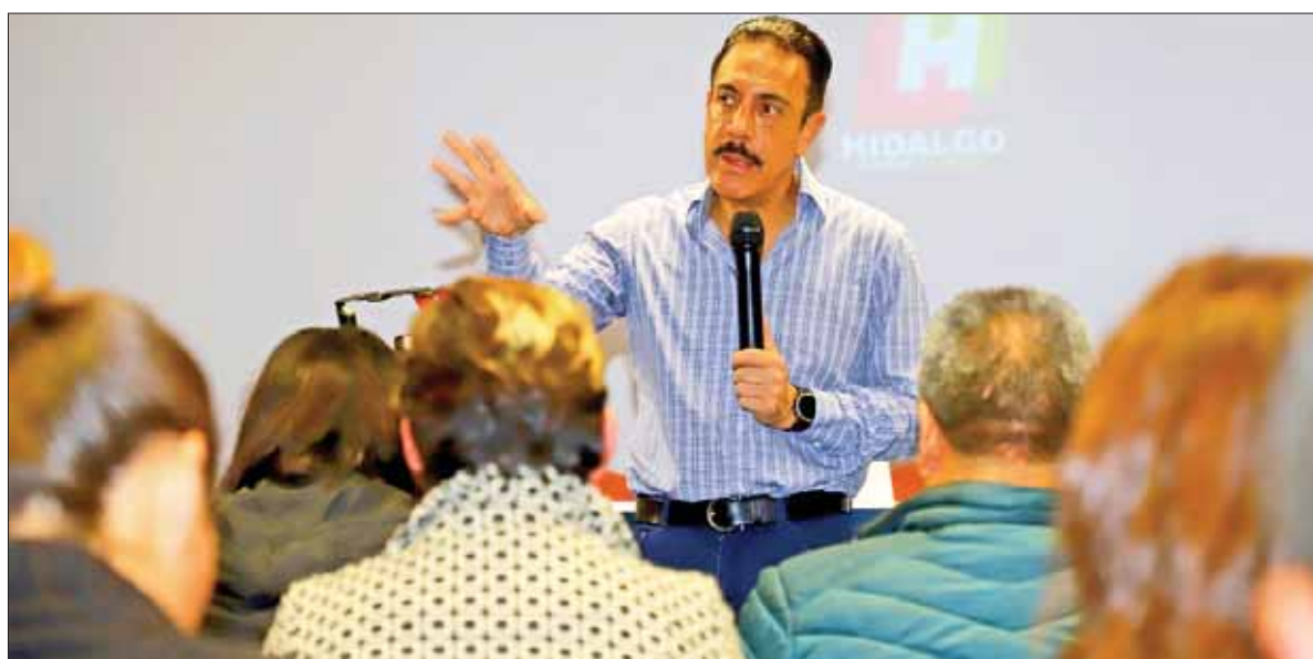
Respondió gobernador Fayad diversos cuestionamientos ante representantes de medios de comunicación, en rueda de prensa.