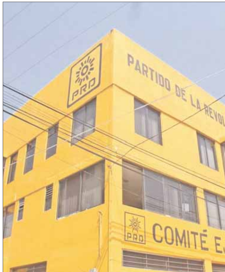
INDICIOS. Cúpula mantenía un programa de austeridad, aunque en la información otorgada por la Unidad de Transparencia muestra altos gastos en pago de servicios.

Hasta enero de 2019, el órgano electoral local reportó que