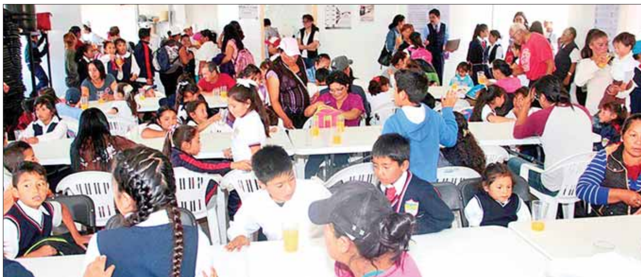
FALLAS. Tenía como grupos de apoyo a niños de 0 a 11 años, adolescentes de 12 a 19 años, mujeres embarazadas o en lactancia, adultos mayores, personas con discapacidad, migrantes y desempleados temporales.