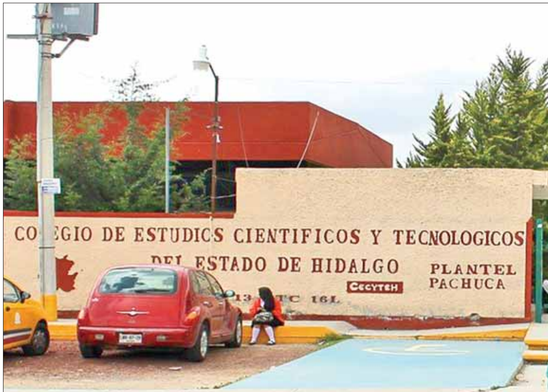
PIEZAS. Existen en Hidalgo 41 planteles de este subsistema que se podrán al servicio de los adultos para realizar el trámite.

abrirá sus aulas para así evitar a los adultos traslados lejanos hasta los colegios seleccionados o a las oficinas centrales de la SEPH.