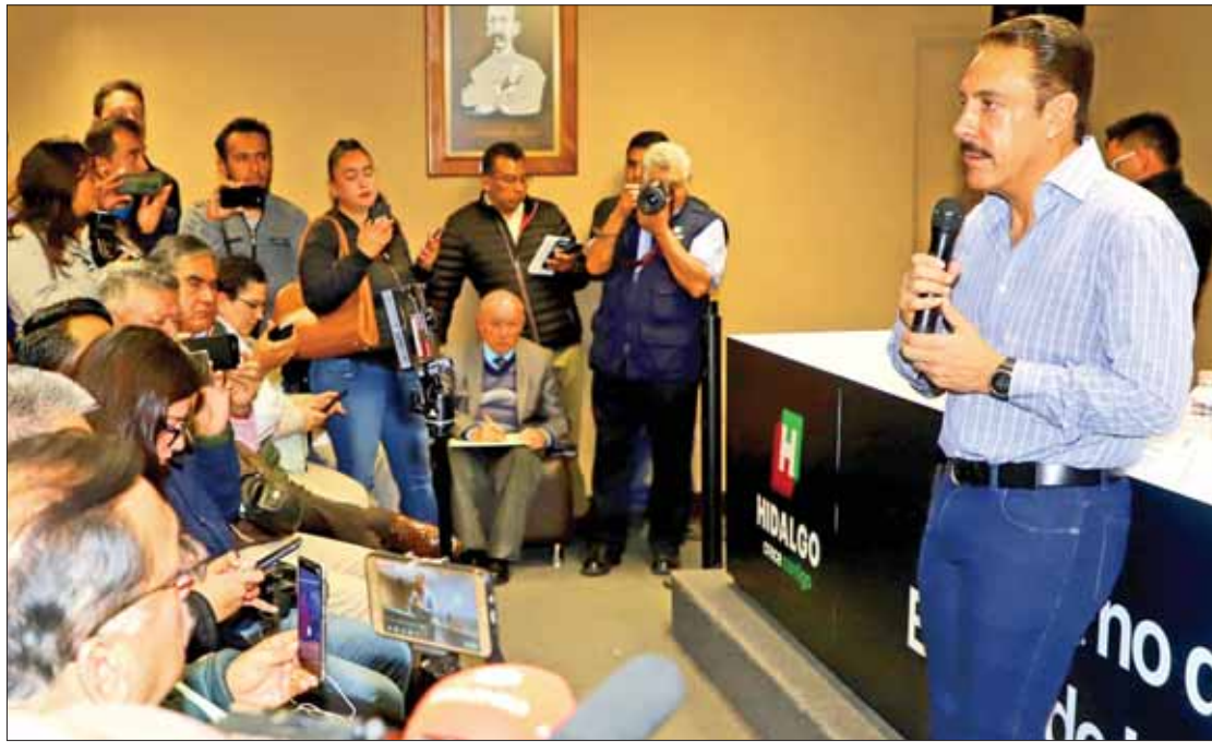
TERRENOS. Confirmó pláticas con federación para el tema de apoyo al aeropuerto, desde Tizayuca.

dalguense trabaja de manera estrecha con la federación, los procesos electorales quedaron atrás, por lo cual "queremos que le vaya bien al presidente López Obrador para que la vaya bien a México".