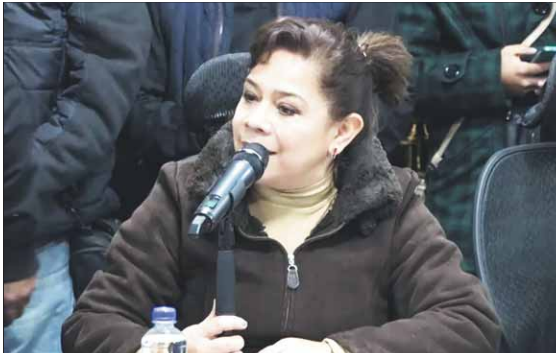
SENTIR. Lamentan que en el lema de la Cuarta Transformación sea sólo en el discurso, porque ante la necesidad de la gente se les hace fácil lanzar falsas promesas.