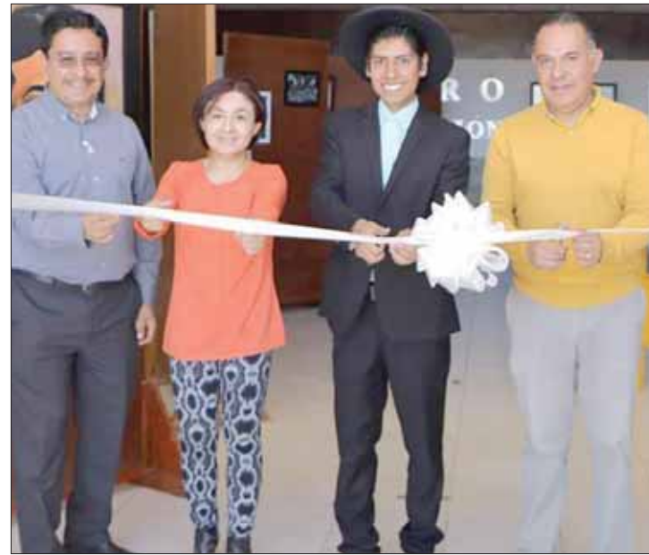
LOGRO. Al evento, asistieron estudiantes de los diversos programas educativos, quienes escucharon la explicación de cada obra.