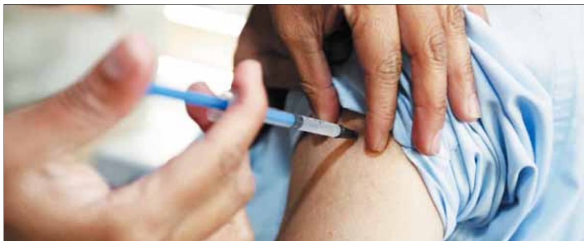
TIEMPO. Una vez que está próxima a concluir la temporada invernal, también terminará la campaña de vacunación contra influenza, la cual para la institución contó con 60 mil dosis.

"Si bien la campaña ya terminó, tenemos acciones de prevención permanente todo el año y es necesario que la población acuda a las revisiones".