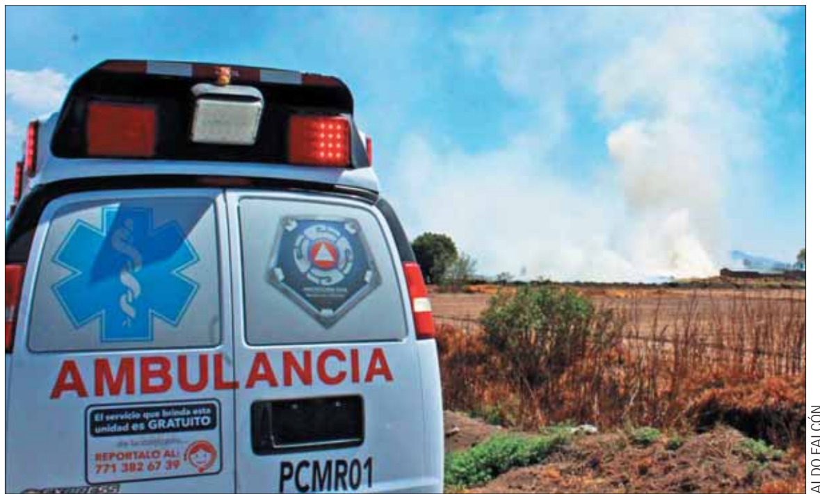
La tarde de este sábado se suscitó un incendio en el fraccionamiento Los Encinos, Mineral de la Reforma; ante la gran nube de humo, los vecinos llamaron a personal de Protección Civil para que lo sofocaran.

Estas acciones constituyen una violación a los Derechos Humanos de las mujeres y para erradicarla se cuenta con instrumentos internacionales como la Convención para la Eliminación de todas las Formas de Discriminación contra las Mujeres, y la Convención Interamericana para Prevenir, Sancionar y Erradicar la Violencia contra la Mujer, mejor conocida como Convención Belém do Pará. 3