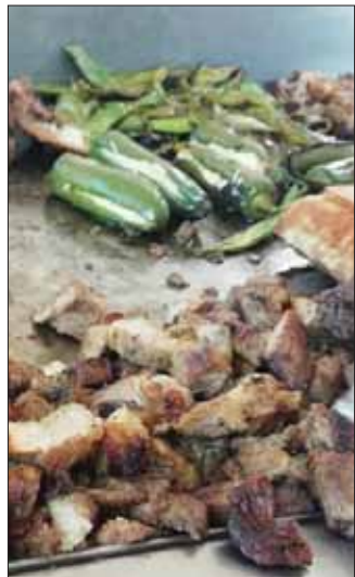
MUESTRAS. Aceptación de gastronomía hidalguense.