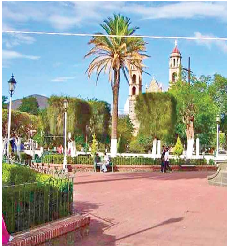
HERENCIA. Subrayó que algunos problemas vienen de pasadas administraciones, pero ya son subsanados.

En la comunidad de Almoloya se trabaja arduamente, pero se presentó un problema con la bomba, que ya está siendo atendido, destacó que están avisando