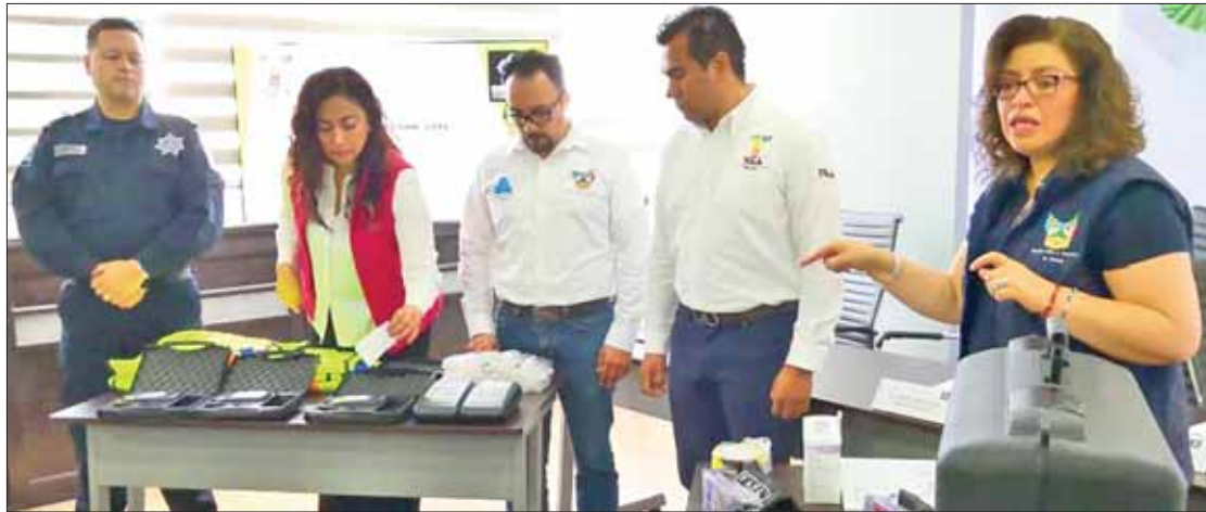
VIALIDAD. Expuso organismo estatal importancia de atender todas las recomendaciones para evitar incidentes.

El caso anterior se presentó apenas este viernes, en el que elementos de la Secretaría de Seguridad Pública municipal localizaron el cuerpo de un hombre en avanzado estado de descomposición en un paraje conocido como Las Positas, de la segunda sección de San Mateo. (Ángel Hernández)