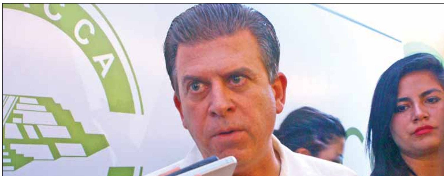
PRESENCIA. Visitó Ricardo Sheffield la entidad con motivo de la sesión de Conacca, donde ofreció su respaldo a construir nueva central de abasto.

Los propietarios de las unidades vehiculares fueron sancionados con mil 690 pesos por contaminar de manera ostensible, mientras que la multa, por este mismo motivo, impuesta a conductores del servicio público, ascendió a 2 mil 535 pesos.