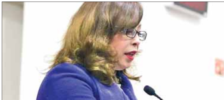
OPERACIÓN. Sin estos fondos muchas de éstas dejarán de funcionar.

Recordó que el objetivo de estos espacios es brindar una aten-