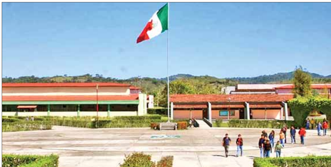
TESTIMONIOS. Detalló el secretario que ambas instituciones están bajo la lupa de autoridades de Contraloría.

guez que estas observaciones, hechas hace algunas semanas por la Auditoría Superior del Estado de Hidalgo (ASEH), tendrán que resolverse y aclararse, aunque argumentó que responden a situaciones administrativas que tienen respuesta.