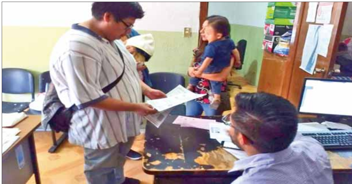
TAREAS. Reiteró la obligación de ofrecer a las familias del municipio una mayor certeza jurídica en ayuntamiento.