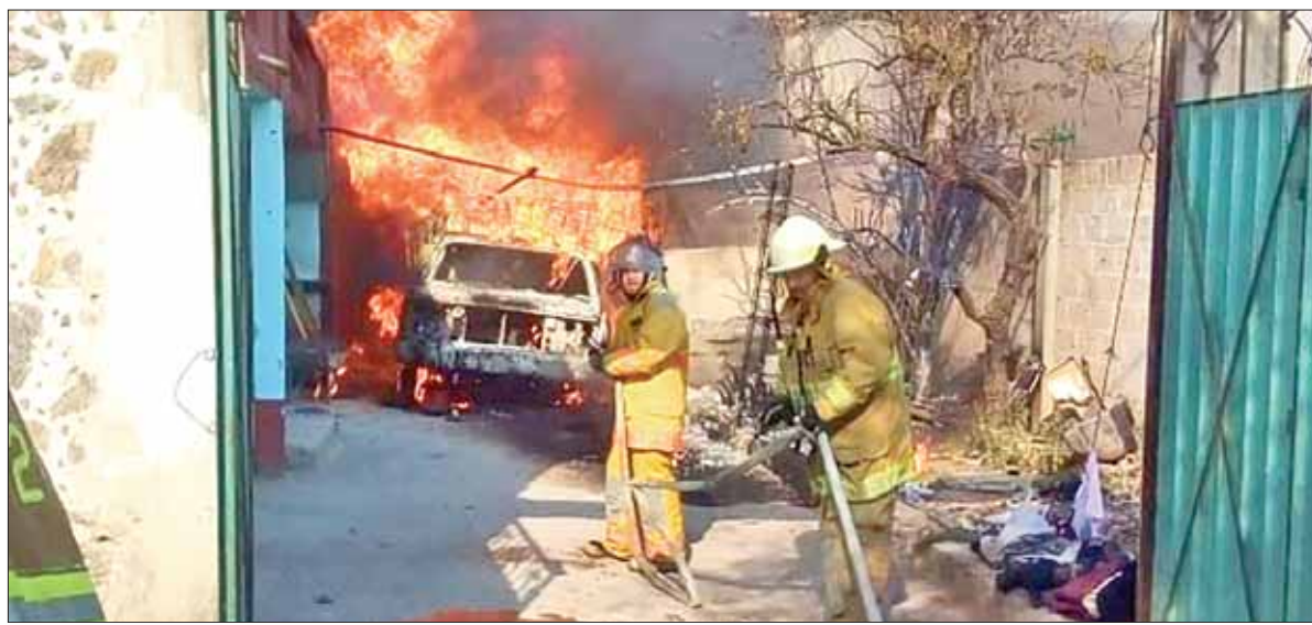
Incendio en bodega de Cuauhtepc generó movilización de bomberos de otros dos municipios, la causa fue una camioneta con bidones cargados de hidrocarburo robado.

■ Confirma titular de la SEPH que las investigaciones siguen curso de ley ■ Para descartar y aclarar a sociedad presuntos desvíos y malos manejos