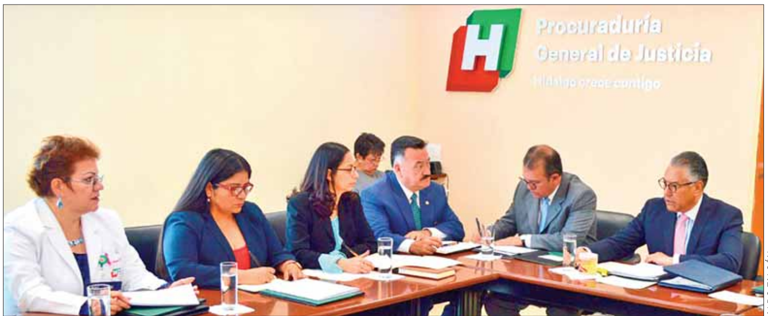
CERTEZAS. Para alcanzar este objetivo, trazado como parte de la nueva etapa de la procuraduría, consideraron diseñar, formalizar y estandarizar las actividades en los procesos básicos y de soporte de la institución.

Los comerciantes, de igual forma, hicieron un llamado al líder sindical, Percy Espinosa Bustamante, para que reconsidere sus pretensiones.