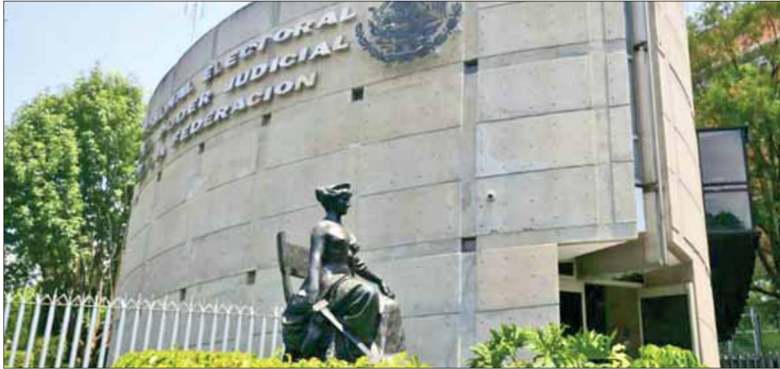
FUNDAMENTOS. Superaron en total más de 10 millones de pesos a cubrir por omisiones durante proceso electoral.

► Rechazo de cúpulas en Hidalgo ante multas y sanciones impuestas por resolución del INE