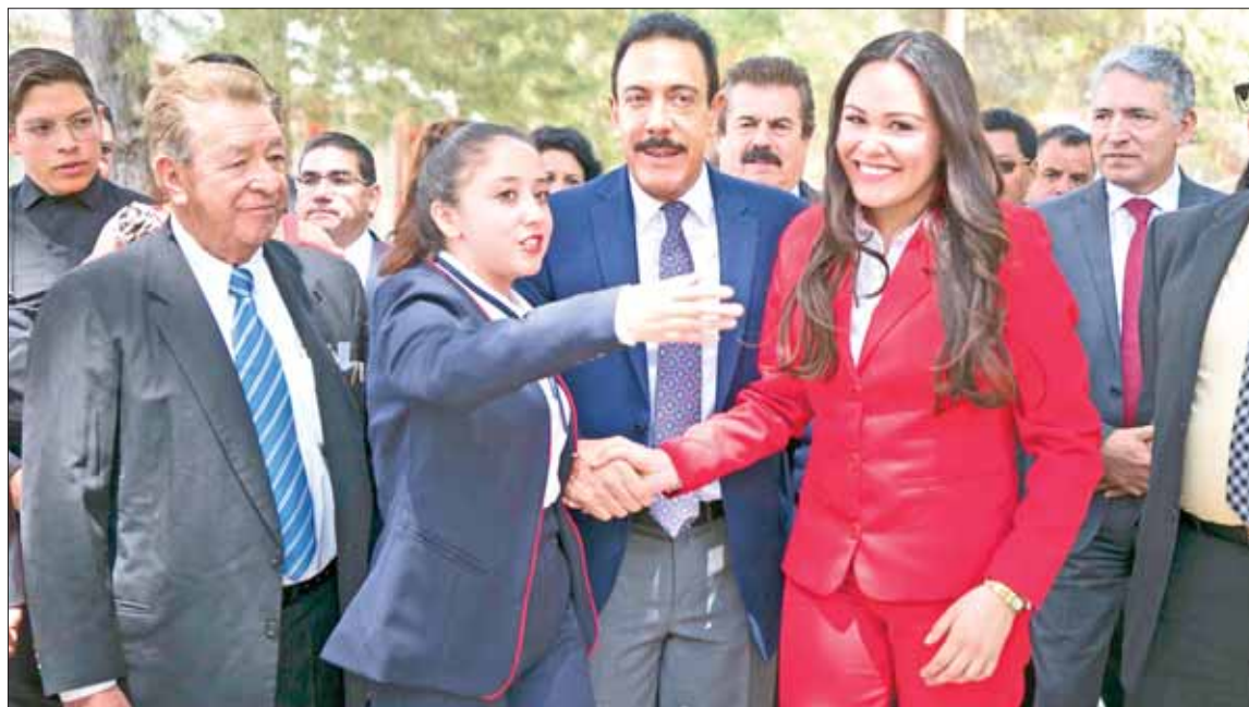
Transformación en Hidalgo debe sustentarse en la educación, expuso el gobernador Fayad, al visitar un centro de estudios.