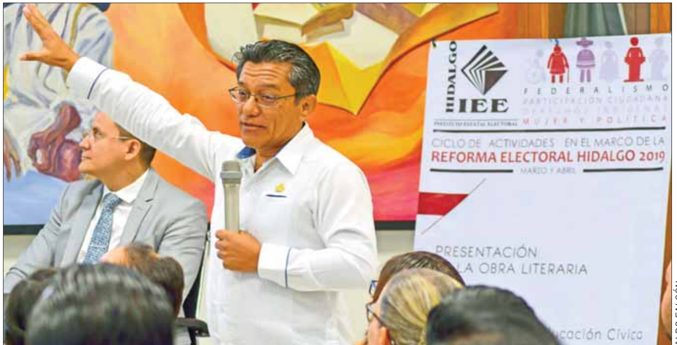
CONDICIONES. Parte del ciclo de actividades que el Instituto Estatal Electoral realiza de cara a una posible reforma política.

"La educación cívica es clave para el empoderamiento de la ciudadanía y así llevar a sus practicantes a una recuperación del espacio público y el empoderamiento de la ciudadanía en la construcción de la democracia".