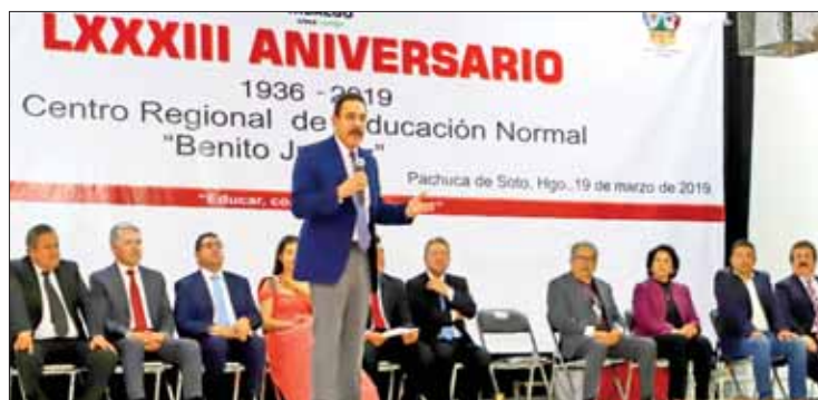
EQUIVOCACIÓN. Reapertura de El Mexe no es volver al pasado, aseveró.

Al presidir el LXXXIII aniversario del CREN, Omar Fayad puntualizó que debe trabajarse duro para realizar los cambios y transformaciones que Hidalgo necesita.