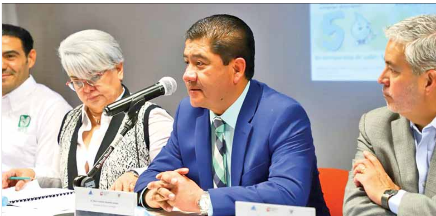
PRECISIONES. Dará la dependencia estatal especial atención a temas como consumo de agua y alimentos en todo el territorio hidalguense.

No descartó que en próximos días se estén realizando algunas campañas en instituciones públicas para que los habitantes tomen algunas medidas y eviten situaciones que pudieran afectar su salud como ya ha ocurrido en otros años.