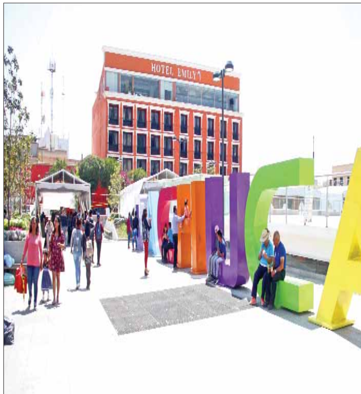
PERCEPCIÓN. Urge reactivar aspectos turísticos en el centro de Bella Airosa.

"Pachuca requiere atractivos para el turismo local y de otros puntos del país, porque se había logrado superar la barrera de ser sólo un punto de paso, sino que la gente se quedara a pernoctar y ese efecto contribuyera a la derrama económica,