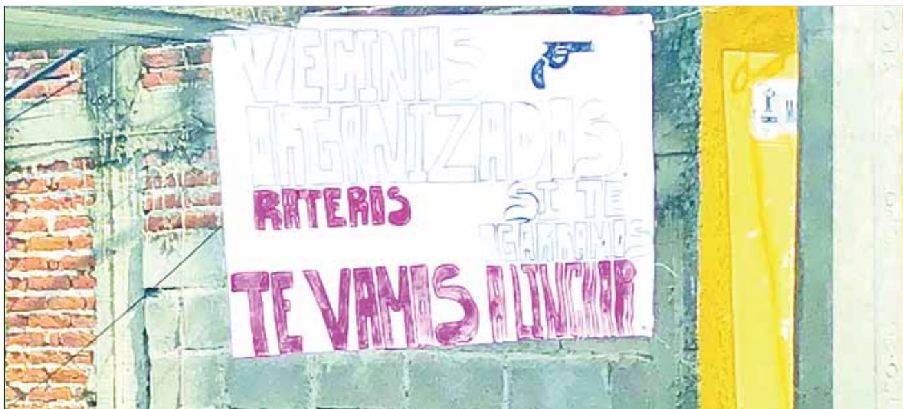
REFERENCIA. Hace un par de meses detectaron a personas y vehículos sospechosos en las inmediaciones de su conjunto habitacional, los cuales no han sido identificados.

Los quejosos lamentaron que el alcalde Jovani Miguel León Cruz no haga nada por frenar la ola de inseguridad que se padece y que siempre trate de minimizar las problemáticas, "todo lo toma a juego, no obstante, la inseguridad crece día con día... además que la descomposición social también avanza".