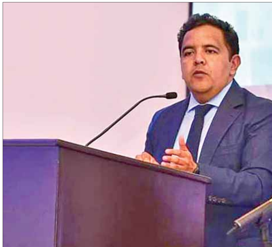
MÉTODO. En marcha el foro estatal Humanidades, Ciencia, Tecnología en México Presente y Futuro.

Las principales conclusiones fueron que la ley estatal y nacional de ciencia y tecnología deben actualizarse y ser garante de los derechos del sector.