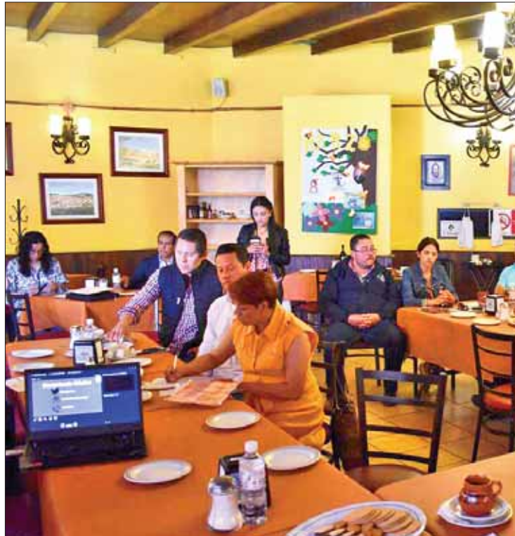
HERRAMIENTAS. Por medio de la Corporación Internacional Hidalgo la secretaría realizó una capacitación a empresarios de la Canirac sobre los beneficios del programa Senior Experten Service.

Según información oficial, este ejercicio se llevó a cabo en la sede del Consejo Coordinador Empresarial de Hidalgo (CCEH) y reunió a empresarios de sectores como el agroindustrial, metalmecánico, materiales para la construcción, de servicios y textiles de municipios de Mineral de la Reforma, Pachuca, Tecozautla, Tepeapulco,