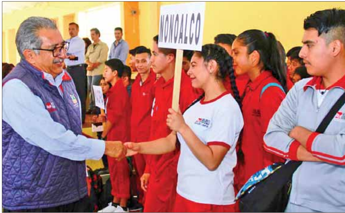
FORMACIÓN. Subrayó el titular, Atilano Rodríguez, programas implementados a favor de la juventud del estado.

Acompañado por el alcalde de dicha demarcación, Raúl Lozano Cano, así como de los municipios que integran dichas regiones y el legislador local José Luis Espinosa, el funcionario estatal indicó que el deporte y las actividades culturales son imprescindibles para lograr una educación integral y de calidad, por lo que la administración que encabeza el gobernador Omar Fayad Meneses ha implementado acciones que fortalecen al rubro de diversas maneras.