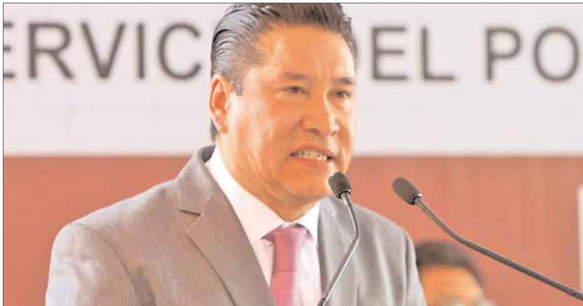
FEDERACIÓN. Una de las metas es que este sindicato sea de los primeros en cumplir todas las disposiciones.

El funcionario estatal agregó que la información que se proporciona a los funcionarios y trabajadores de las distintas dependencias gubernamentales es utilizar las tecnologías de la informática, en la cual se localiza el programa de Declaranet, en el que deben ingresar sus datos e informaciones que se solicitan.