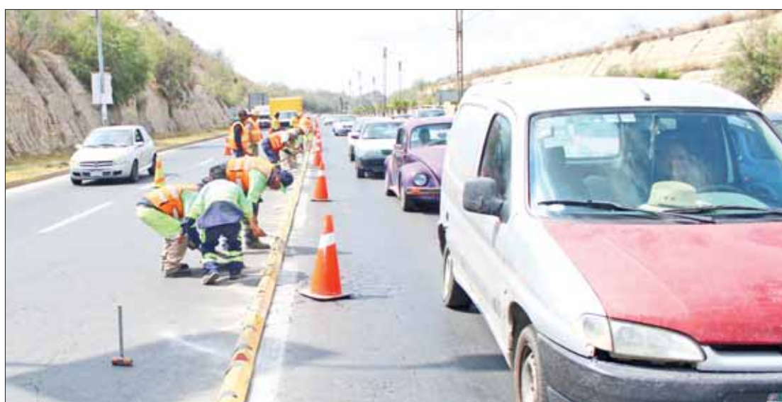
Colocó personal de SOPOT bolardos sobre el bulevar Nuevo Hidalgo para evitar accidentes viales.