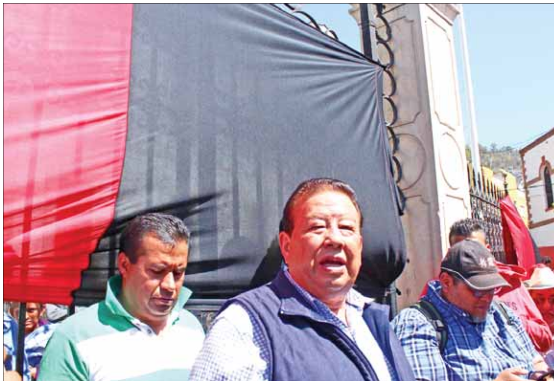
GARANTÍAS. Indicó que los trabajadores si buscan una mesa de negociaciones para finalizar este problema.

Refirió que sólo hay calumnias en contra del movimiento sindical, por los diferentes señalamientos que hacen las autoridades de