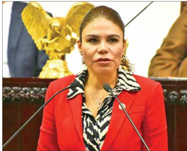
REFORMAS. Afirmó la legisladora que existe ambigüedad en términos.

Señaló que si bien existen normas que protegen el patrimonio cultural, el objeto de protección