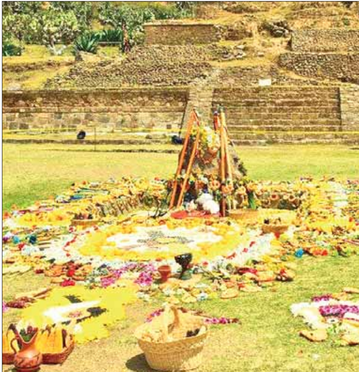
LIMITADO. Aún son más las personas que pudieran visitar estos puntos durante el fin de semana.