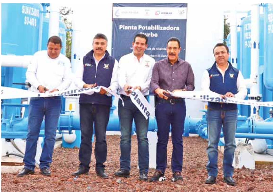
Inauguramos la Planta Potabilizadora Iturbe en beneficio de las localidades de Iturbe y El Llano, de Tula, destacó Omar Fayad en evento por Día Mundial del Agua.

En tal contexto dijo que una cifra que nos debe tener intranquilas a la sociedad civil y a las autoridades es que, anualmente en el mundo fallecen más personas por enfermedades relacionadas con agua contaminada que por las guerras, de ahí que celebró que se ponga en marcha una nueva planta potabilizadora. 3