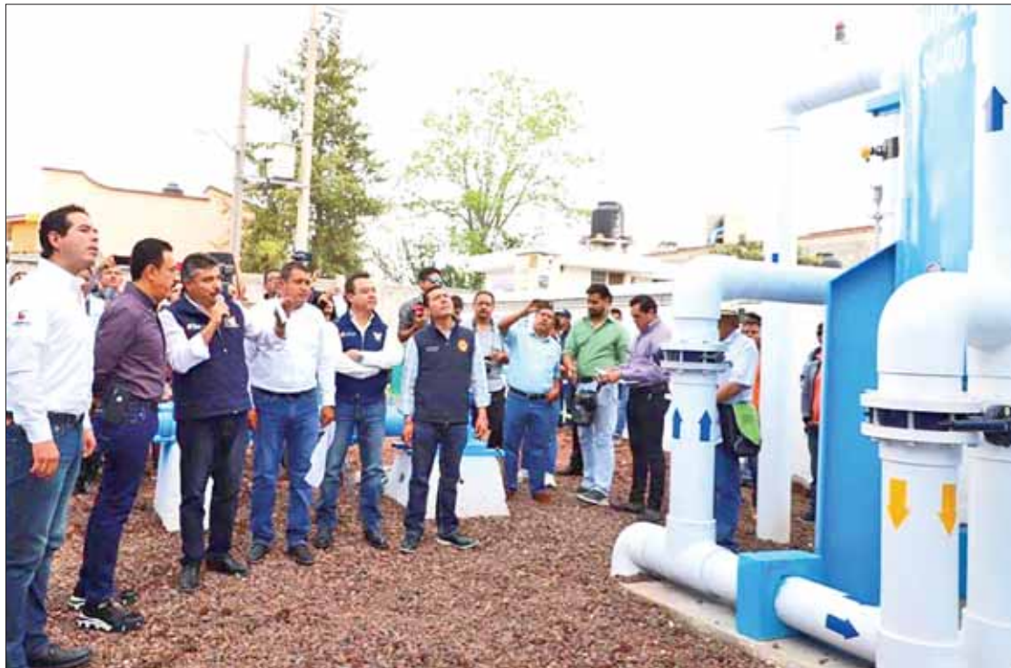
EN DÍA MUNDIAL. Inauguración de una planta potabilizadora en Iturbe, comunidad en Tula.

Sostuvo que no es circunstancial que la inauguración de la planta potabilizadora se haya hecho en Tula en el marco del Día Mundial del Agua, 22 de marzo, sino que el evento se trajo aquí para