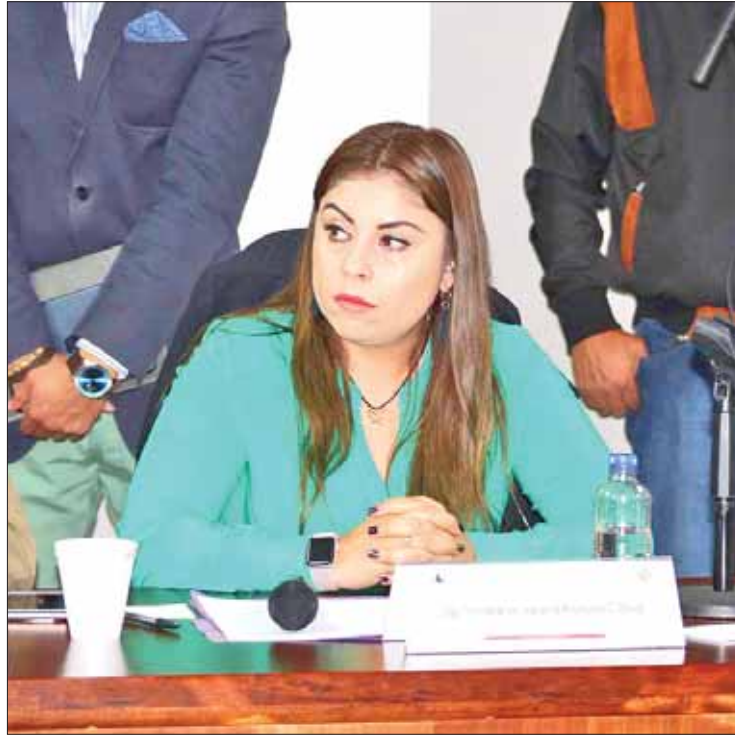
PANORAMAS. Enfatiza diputada que el Congreso jamás realizó acusación o señalamiento en contra del presidente del patronato de la universidad y mucho menos se le pidió a alguna autoridad local o federal encargada de la impartición de justicia, que sea a través de la Legislatura donde se desahoguen los hechos.

Agregó que el Congreso no es un órgano que litigue asuntos de este tema, sino legisladores, por ende la reunión más allá de abonar al tema, entorpece el debido proceso entre la guerra de declaraciones.