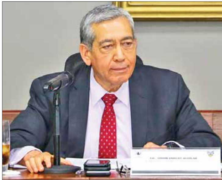
TRAZO. Las acciones que hemos emprendido para tener un Hidalgo seguro se enfocan principalmente en prevenir y combatir el delito, así como fortalecer la procuración de justicia, y abonar a la seguridad pública a nivel nacional.

Este 21 de marzo, el secretario de Gobierno retomó las palabras del Presidente de México, Andrés Manuel López Obrador: que se debe "atender el mal, haciendo el bien"; "somos conscientes de que una sociedad en paz y con gobernabilidad genera certidumbre para el desarrollo y el crecimiento del estado", enfatizó.