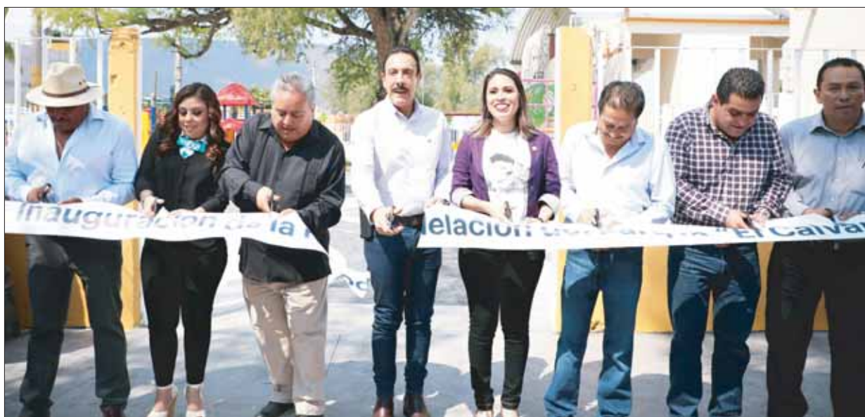
En el municipio de Mixquiahuala el mandatario estatal entregó la rehabilitación de un parque, a favor de las familias.

También en el marco de la conmemoración del Día de la Mujer, aseveró que su administración trabaja para entregar cada vez más apoyos a este sector de la sociedad y con ello brindar mayor seguridad, por eso insistió en que este día debe ser motivo de reflexión. .3