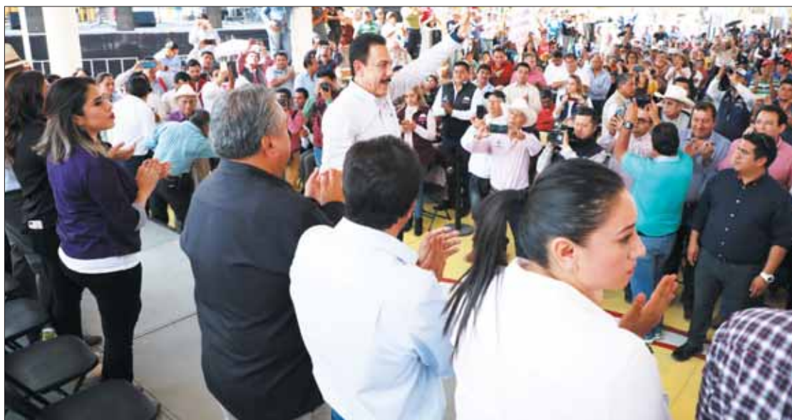
VIGILANCIA. Recordó el mandatario que esta zona ya también cuenta con videocámaras que abonan a la seguridad.

Añadió que en Mixquiahuala se comenzó ya con una semilla; "venimos haciendo un gran esfuerzo para que aquí haya un sis-