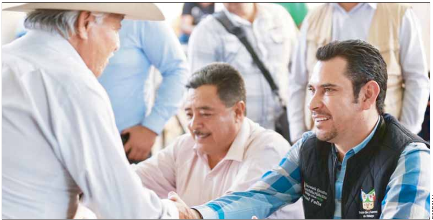
CERCANÍA. Expuso que continuará con las mesas de trabajo en cada una de las regiones del estado para responder a las peticiones de la gente.

Meneses Arrieta realizó también un recorrido por la obra de pavimentación del Camino Rural Huejutla-Romanita límites Hidalgo-Veracruz, con una inversión superior a los 17 millones de pesos en una meta de 1.5 kilómetros, con estas acciones se beneficiarán directamente a más de 40 mil habitantes. (Alberto Quintana)