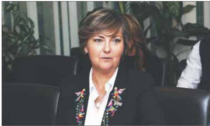
DEFINITIVO. Apuntó que en este marco debe prevalecer la concordia a favor de la población.

Además la Coparmex rechazó que otros grupos de interés y partidos políticos intervengan en el conflicto, politizando y polarizando a la sociedad con informa-