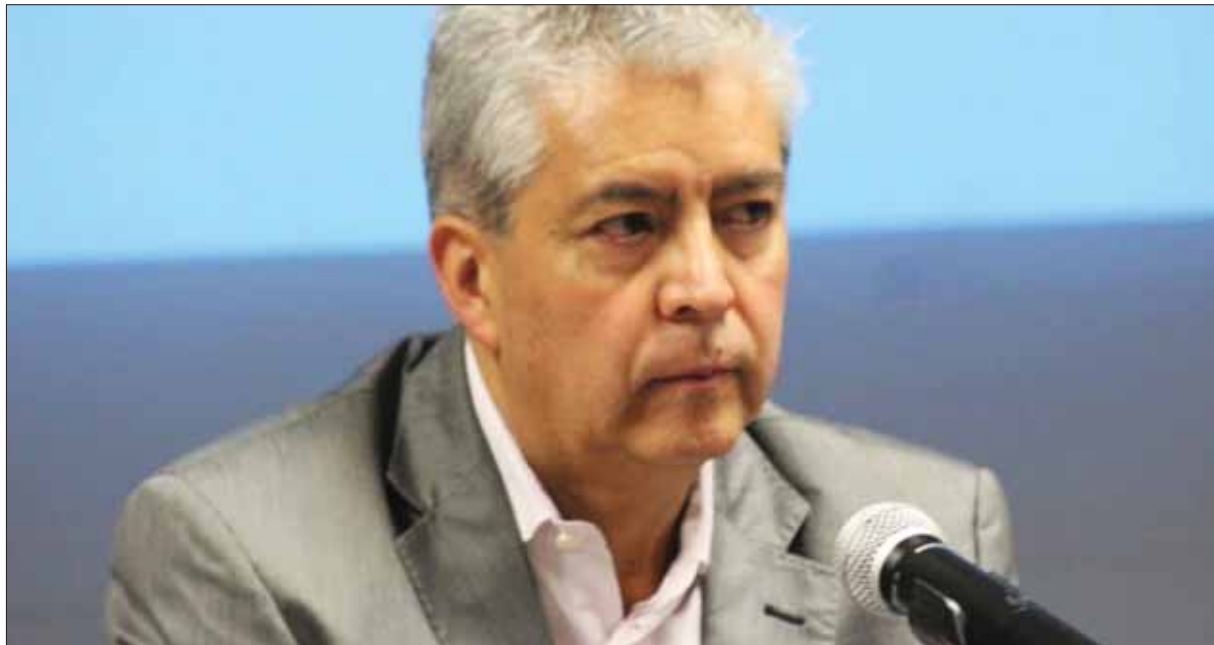
PERTINENCIA. Subraya delegado la importancia de sensibilizar a las familias en general, y a los jóvenes en particular, sobre respetar y no distraer al responsable de conducir el vehículo.

Precisó que el uso de dispositivos móviles al manejar causa distracciones auditivas y visuales, al quitar la mirada de la