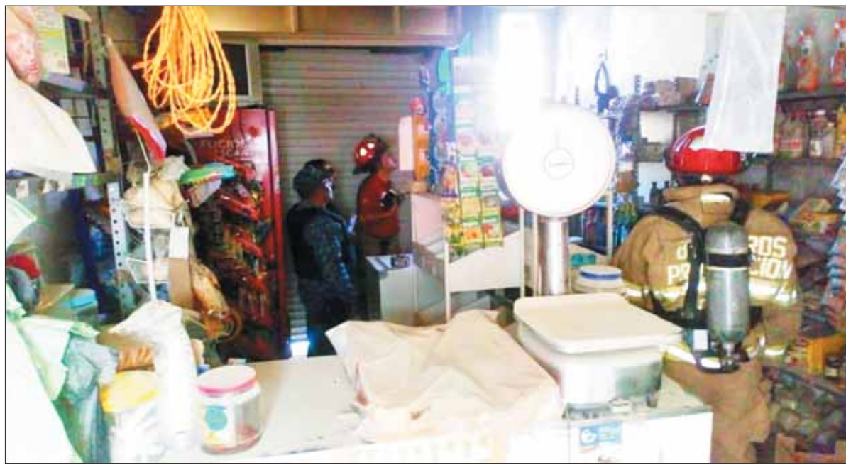
Elementos de Protección Civil de Pachuca apagaron un incendio al interior de un negocio de abarrotes; el siniestro, en el barrio La Palma, surgió por un aparente cortocircuito el cual dejó pérdidas por más de 5 mil pesos a sus dueños.

■ Emiten organismos de Salud varias recomendaciones para así evitar las complicaciones innecesarias derivadas de accidente carretero; de igual forma aconsejan sobre cuidados pertinentes para no tener problemas con la piel