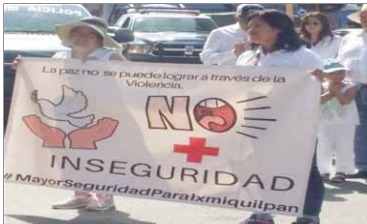
SEÑALES. Iniciaron recorrido ayer a las 9 horas, para posteriormente concentrarse frente a la presidencia municipal.