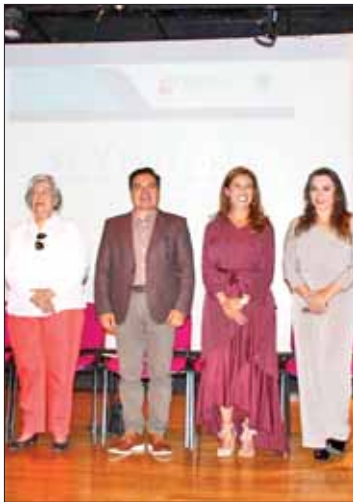
ESFERAS. Coordinación de diversas áreas para garantizar seguridad y comodidad.

Indicó el ayuntamiento que para el desarrollo de las celebraciones litúrgicas esperan una afluencia de más de 2 mil 500 personas entre locales y visitantes, por lo que las dependencias municipales instalarán un módulo de primeros auxilios y esta-