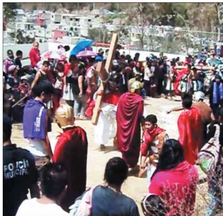
MUESTRAS. El año anterior registraron más de 10 mil personas como espectadores en las representaciones más antiguas de la capital hidalguense, que tienen lugar en El Arbolito, Cubitos, La Raza y Las Lajas.

Señaló que con el objetivo de preservar las tradiciones y convocar los visitantes, la población debe retirar el estigma que se mantiene sobre algunos de los