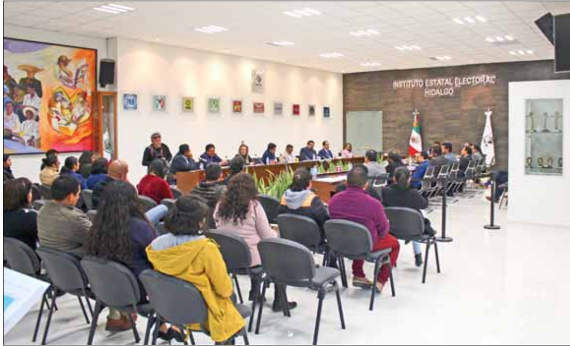
SENDAS. Retomarán mesas técnicas y políticas entre presidentes de partidos políticos con integrantes del Congreso local, en donde continuarán con el diseño de una agenda común para reformar el Código Electoral hidalguense o en su caso la Constitución Política del Estado.

los diputados de Movimiento Regeneración Nacional (Morena) formalizaron una iniciativa de reforma al artículo 41 de la Constitución Política para reducir al 50% el presupuesto anual para los partidos políticos, la propuesta reduce el valor de la UMA del 65 al 32.5%.