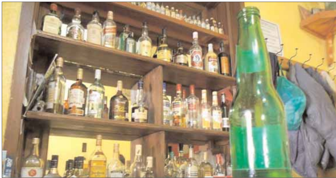
SEMANA SANTA. Uno de los periodos en los que desafortunadamente hay una cantidad muy significativa de accidentes automovilísticos ocasionados por el abuso en el consumo del alcohol.

Así como la Secretaría Ejecutiva de la Política Pública del estado de Hidalgo (SEPPEH) mediante el Consejo de Ciencia, Tecnología e Innovación de Hidalgo (Citnova), el Centro de Investigación y Docencia Económicas (CIDE) y el Instituto Politécnico Nacional (IPN).