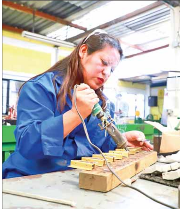
RECORDATORIOS. Los patrones están obligados a registrar ante el IMSS a sus trabajadores desde el primer día de labores.

El patrón también está obligado a presentar las modificaciones al salario, llevar registros como nóminas y listas de raya, donde se tenga constancia del número de días que trabajan; datos que deberá conservar durante cinco años.