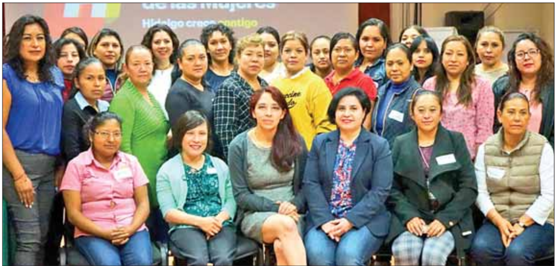
IHM. Fortalece trabajo de instancias municipales que atienden a mujeres.

Finalmente se externó la importancia de crear el Grupo Municipal para la Prevención del Embarazo en Adolescentes, alineado al trabajo que hace el grupo estatal para dar seguimiento a la Estrategia Nacional para la Prevención del Embarazo en Adolescentes (ENAPEA).