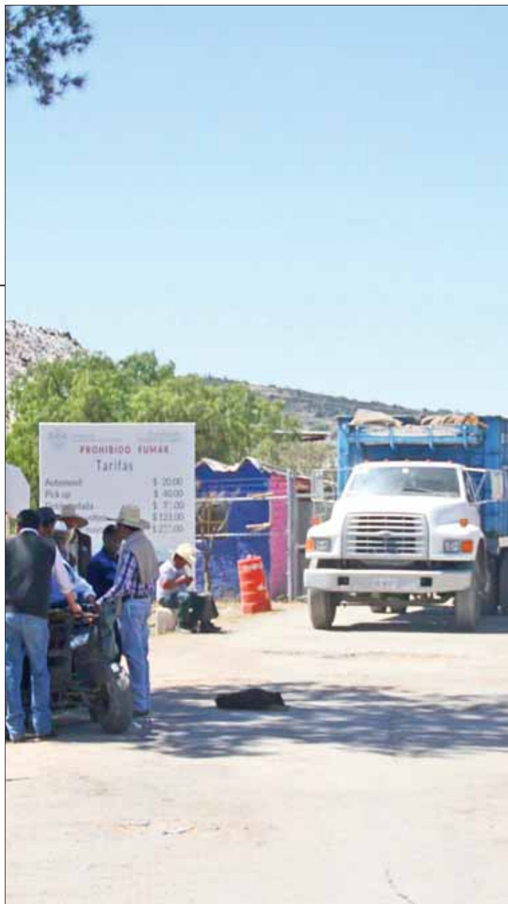
ASPECTOS. No es un asunto fácil, se debe determinar qué se hará con la gente que labora en el lugar.

DATO. El sábado se registró un incendio en el relleno sanitario de Tula, para atender la contingencia acudieron elementos de Bomberos y de Protección civil para sofocar las llamas, del cual se desconocen las causas del siniestro.