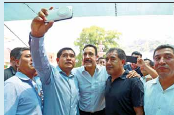
EN XOCHICOATLÁN. Destacó el gobernador que la indicación es que la gente no se vaya sin una respuesta, "que aquí mismo se le pueda resolver el problema que nos viene a plantear".

Acompañado por la exdiputada federal Carolina Viggiano Austria, Fayad entregó sillas de ruedas, bastones, muletas y ayudas