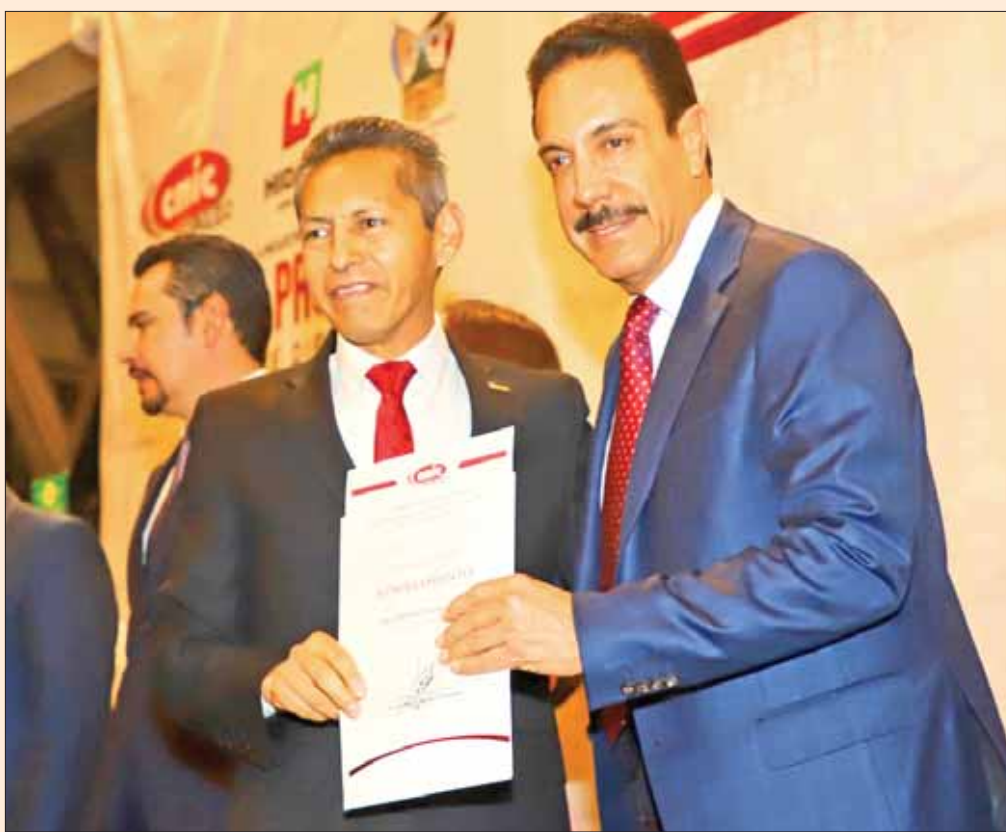
Acude gobernador a toma de protesta del XVII comité directivo de la CMIC, delegación Hidalgo.

Con la primera la proyección es reformar los Artículos 154, 155, 156, 157 y 158 del Código Penal, para establecer que no podrá sancionarse a las mujeres que interrumpen su embarazo antes de las 12 semanas de gestación. .4-5