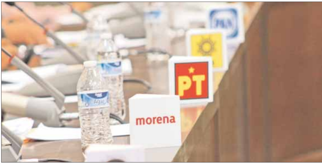
MORENA. Plantea una elección de gobernador con duración de dos años, del 2022 al 2024; continúan los trabajos con partidos.

Además de que el gobernador electo el primer domingo de junio del 2022, terminaría el 4 de septiembre del 2027 y hasta ese año emparejar procesos.