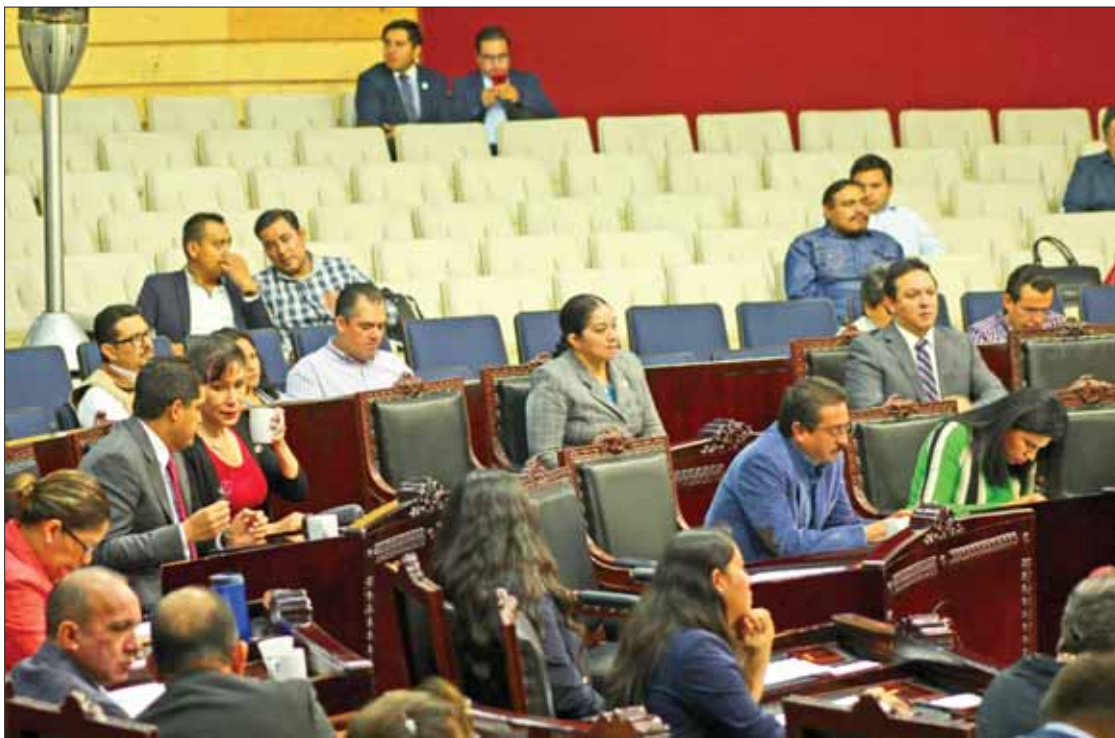
PARAMETROS. En los últimos cuatro años, al menos 57 mujeres fueron criminalizadas en Hidalgo por interrumpir su embarazo, esto según cifras del Secretariado Ejecutivo del Sistema Nacional de Seguridad.

Con cierto recelo compartió su historia, la cual dijo, es la de cientos de mujeres que al igual que ella, optaron por interrumpir su embarazo, en la