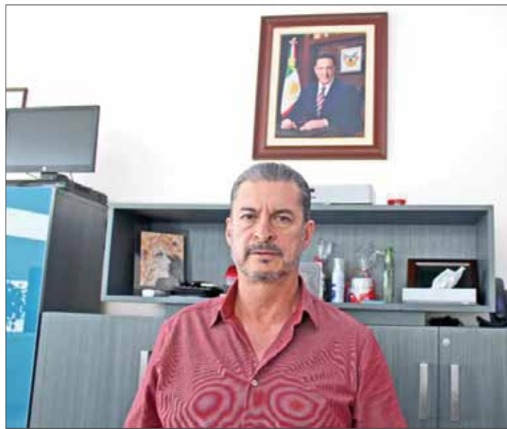
ESLABONES. El subdirector de Administración y Finanzas, de la SSH, en sus inicios fue regidor, consejero municipal y conformó la organización Dinamismo Progresense.

► En 1993 trabajó con Omar Fayad, cuando era secretario de Educación