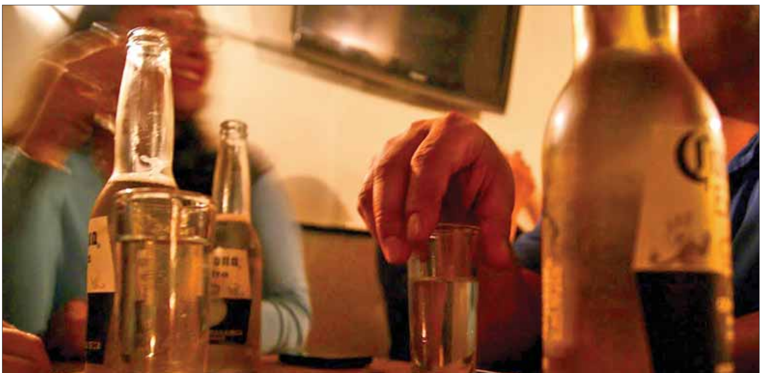
CÍRCULOS VICIOSOS. Son moteles y parcelas los sitios elegidos por menores para embriagarse.

Agregó que en estas últimas tres semanas han detectado cuatro eventos donde los adolescentes ocupan parcelas aledañas a la Preparatoria 2 y uno en un motel, también en la zona de la colonia Plan de Ayala, y en esos eventos, la edad de los adolescentes de 15 a 17 años edad.