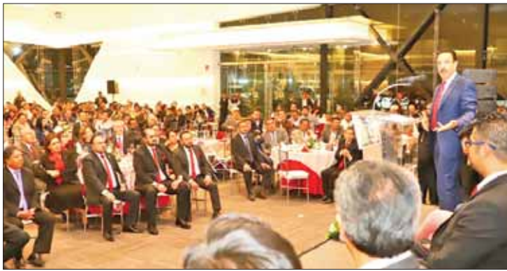
PRESENCIA. Acude gobernador a toma de protesta del XVII comité directivo de la CMIC, delegación Hidalgo.

Según la información proporcionada, este 28 de abril, acordó con el Consejo Coordinador Empresarial de Hidalgo y la CMIC que el sector de la construcción presente la solicitud de impacto ambiental a través de internet, el gobierno estatal se compromete a emitir el documento de inicio del trámite referido, en un plazo no mayor a tres días, "con la característica de que vamos a confiar en la palabra de la gente, vamos a confiar en