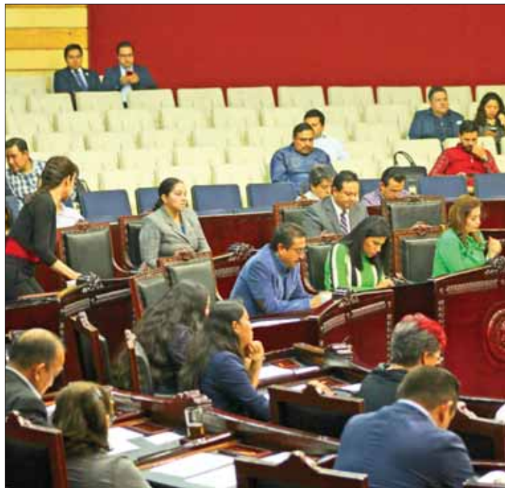
LÍNEAS. Subrayó presidente relación entre el Legislativo y consejeros del estado para avanzar.