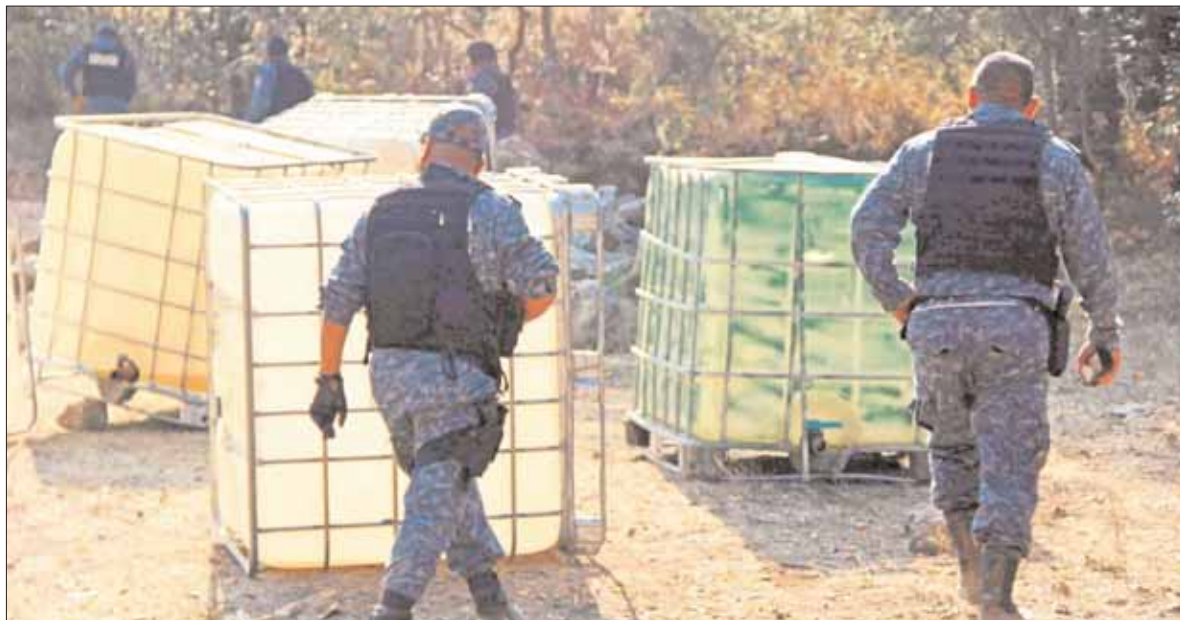
TABLAS. Cuauhtepic se encontraba en el segundo sitio entre municipios con mayores robos de hidrocarburos.

Sin embargo, en días recientes las gasolineras que habían cerrado se vieron nuevamente abiertas al público, en Tulancingo una de ellas ubicada en la colonia El Paraíso y la otra en la colonia Medias Tierras.