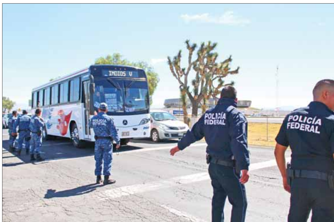
Mantiene Policía Federal y Estatal retenes para revisar vehículos que ingresan y salen de Hidalgo, como parte del operativo de Semana Santa.