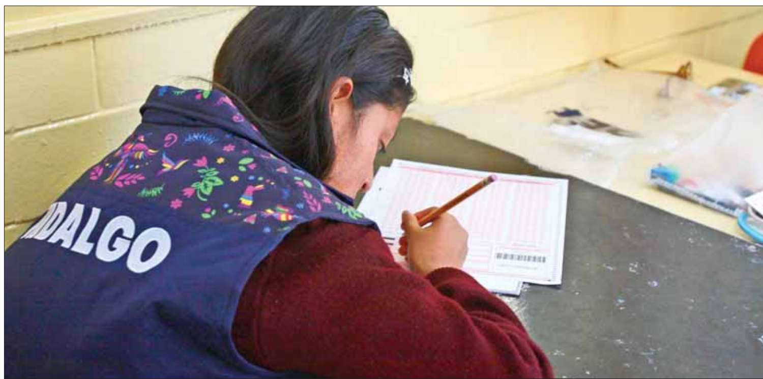
FÓRMULAS. Habrá dos etapas para conformar la representación hidalguense que acudirá a dicho encuentro, precisó la SEPH.

Ante cualquier situación que se presente en salud debe acudir de forma inmediata a las clínicas y hospitales de la Secretaría de Salud para ser atendidos de manera oportuna.