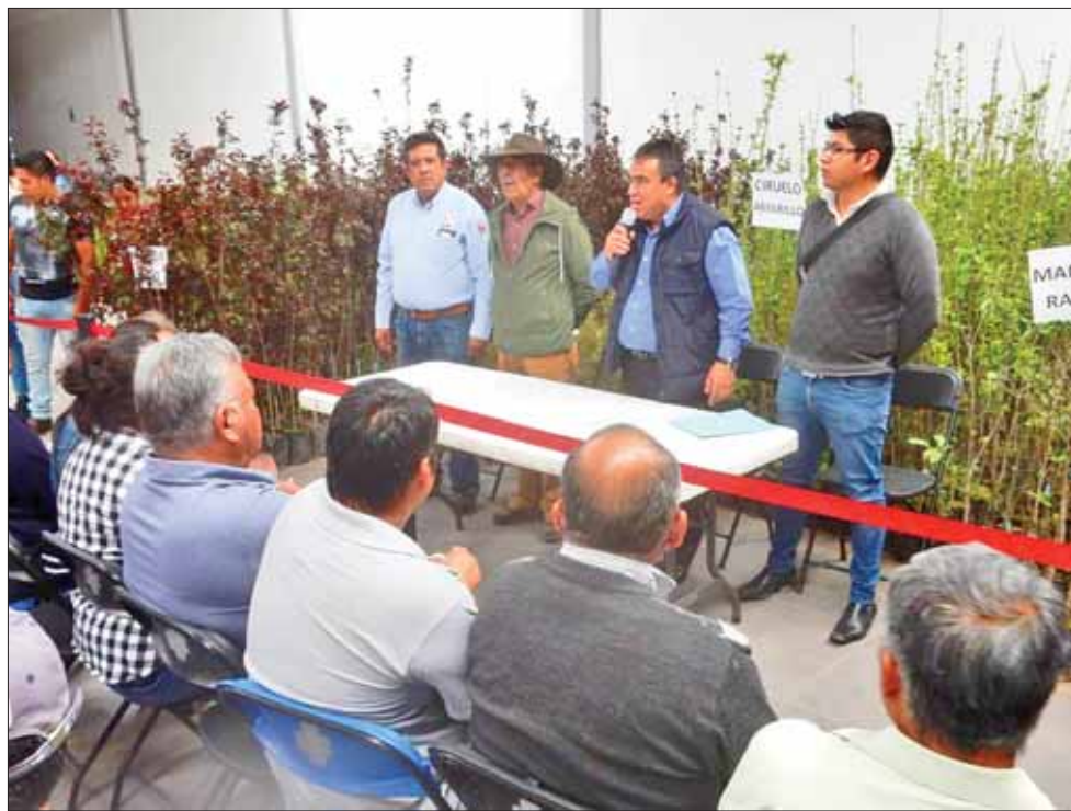
BENEFICIO. En esta edición se ofreció la opción de que interesados eligieran de manera libre sus ejemplares.

Además de Zapotlán, Tepeapulco, El Arenal, Huasca, Zempoala, Villa de Tezontepec, San Agustín Tlaxiaca, Epazoyucan y Tolcayuca, cabe mencionar que también