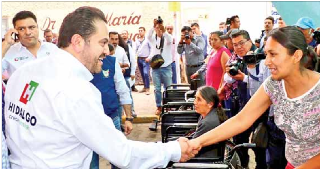
TESITURA. Mantener cercanía para solución de los problemas y solicitudes es elemental para el actual gobierno.

institucionales de Salud, Seguridad Pública, Sedagroh, Sedeco, Coordinación Jurídica, PGJEH, Inhife, STPSH, SEPH, DIFH, CRIH, Inhide, Cultura y Turismo.