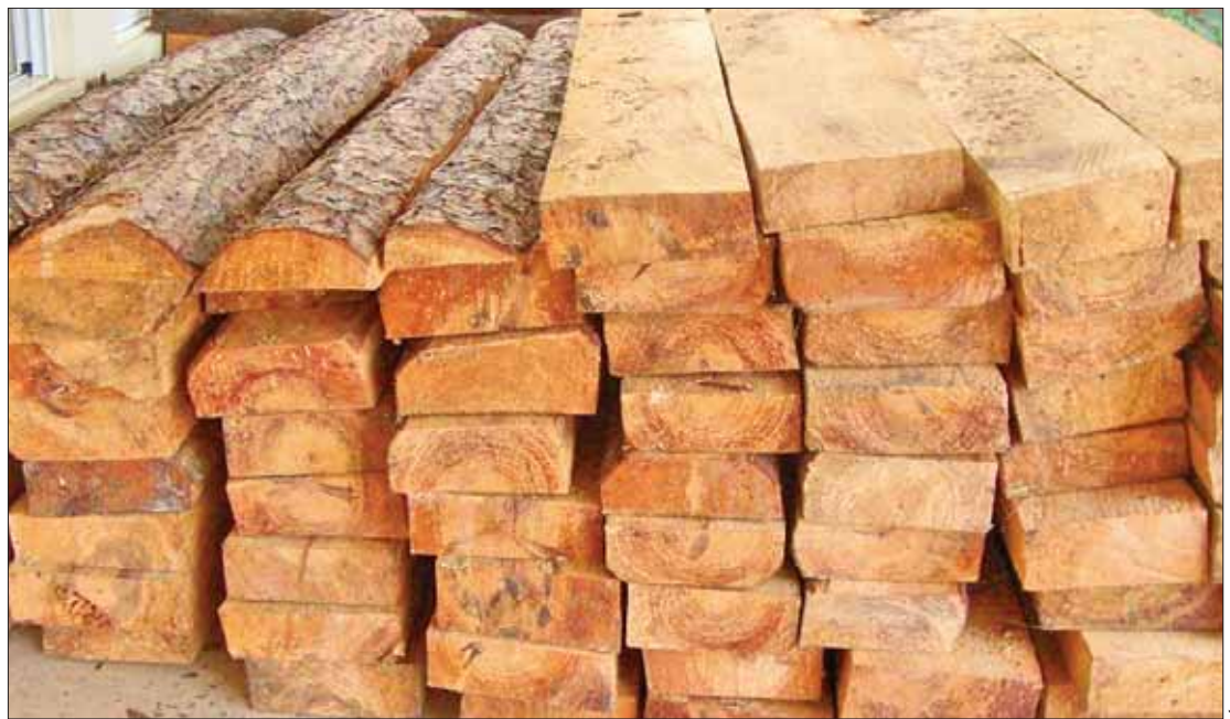
BASES. Labores con fundamento en el Artículo 170, fracción II de la Ley General del Equilibrio Ecológico y la Protección al Ambiente.

Las acciones consistieron en la inspección a dos centros de almacenamiento y transformación de materias primas forestales (CATS), la realización de reco-