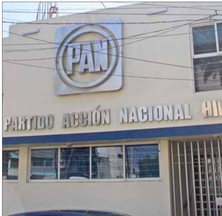
ALEGATOS. Justificó comisión la presunción de inocencia, tras escándalos que tocan al exmunicipio.

"En consecuencia, en el entendido que la solicitud versa sobre procesos concluidos con imposición de una sanción al militante citado, se informa que esta comisión se encuentra imposibilitada para realizar una manifestación respecto a la existencia o inexistencia de algún procedimiento de sanción en contra de la persona de quien requiere información, al considerar que el pronuncia-