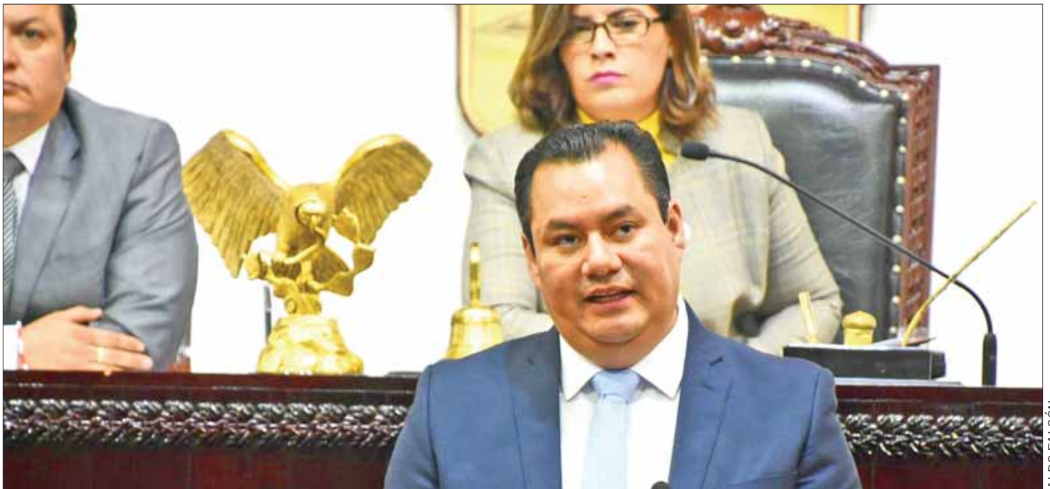
PORMENORES. Expuso Luna las bases sobre las que el partido blanquiazul sustentó la propuesta presentada ayer ante el Congreso.

"La responsabilidad de tratar este asunto es de todos, no se debe coartar la opinión de ningún sector".