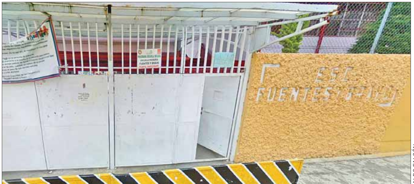
PESARES. Sus hijos no han adquirido los conocimientos propios de sus programas educativos, y se han retrasado.

En esa aula hay 19 pequeños y la maestra que los atendió durante los últimos tres meses, lo hizo sin goce de sueldo, a pesar de que se le había prometido una remuneración. Ella cuenta con plaza docente y atiende al segundo año del turno matutino, pero se ofreció a redoblar turno en la tarde siempre y cuando se le pagaran las horas extras, cosa que no ha sucedido.