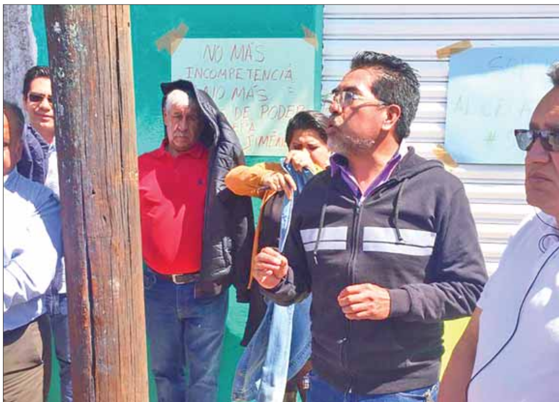
COMPañEROS. Señalaron a directivos de aplicar favoritismos, pese al tiempo de espera para recibir beneficios.

Estas anomalías se han presentado sobre todo en el plantel de Tepeji del Río, donde ella es la directora desde hace dos años.