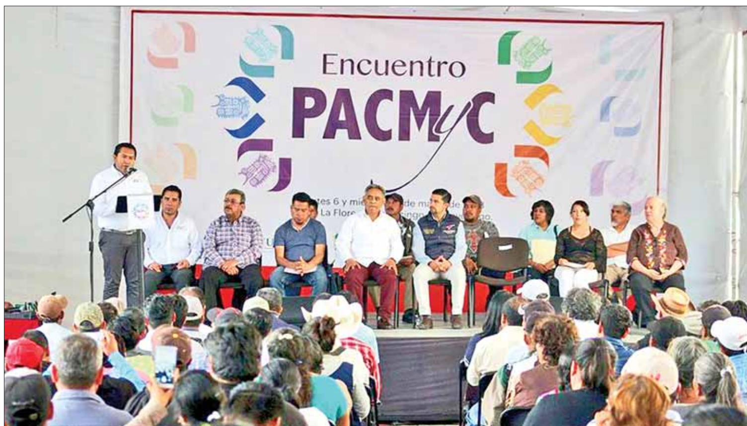
MUESTRAS. El secretario de Cultura dio a conocer que este encuentro iniciará el 12 de abril con la participación del Quinteto Musical Bilingüe, de El Cardonal.