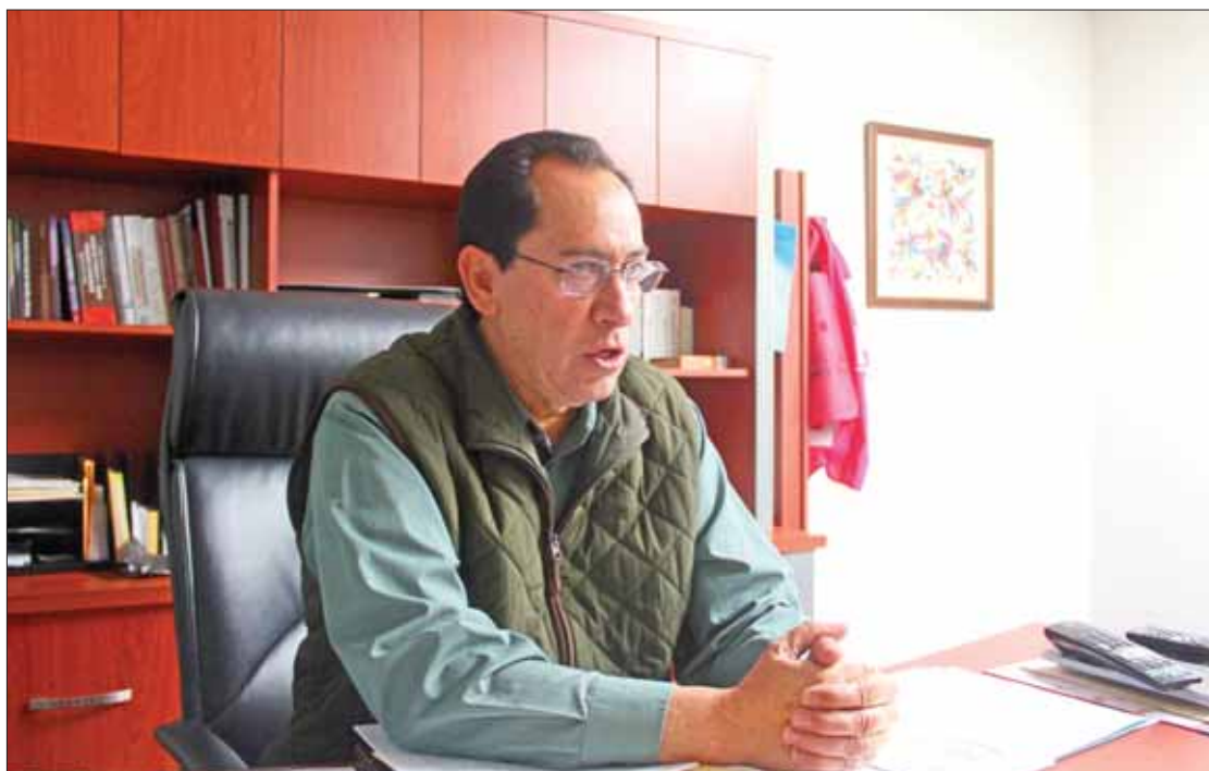
FÓRMULAS. Para el cobro de estas sanciones el instituto descontará el 50 por ciento de las prerrogativas mensuales.

nero que no utilizaron los partidos durante las campañas de 2018, solamente tres cúpulas devolverán recursos: el "tricolor" con 15 mil 78.48 pesos, el "sol azteca", 11 mil 809.34 pe-