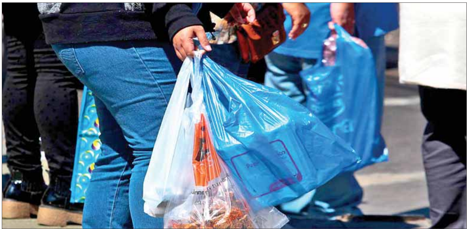
REALIDAD. Necesario que dueños cobren conciencia sobre la importancia de dejar atrás productos que sólo dañan al entorno y a las personas.

Los jurados dictaminarán sobre los expedientes de candidaturas y a más tardar el 7 de octubre deberán tener una lista de aspirantes. (Adalid Vera)