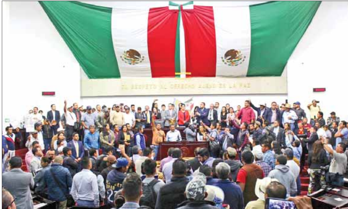
VOCES. Inconformes tomaron la máxima tribuna para protestar contra el presidente de la Junta de Gobierno.

Agregó que quienes se presentaron este martes en el Congre-