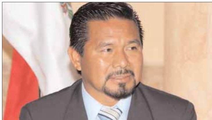
EVASIVAS. Presentó solicitud, avalada por la respectiva comisión morenista.

El exalcalde de Ixmiquilpan recurrió a la Sala Superior para interponer el juicio de protección de derechos políticoelectorales del ciudadano, bajo el expediente SUP-JDC-72/2019, contra la resolución CNHJ-HGO-749/18 emitida por la comisión partidista, interpuesto el pasado 7 de noviembre por su relación en un percance vial ocurrido el año pasado, así como las indagatorias