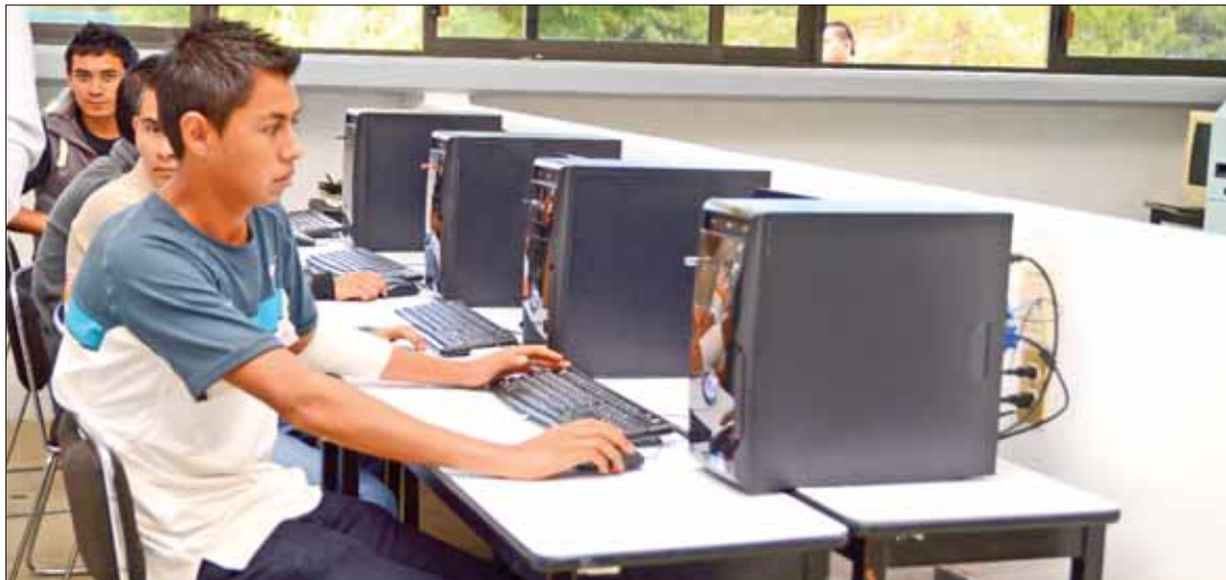
APOYOS. Aún no se sabe a partir de cuándo recibirán también la beca comprometida por López Obrador.

► Tendrá juventud oportunidad de continuar estudios universitarios mediante proyectos de Benito Juárez