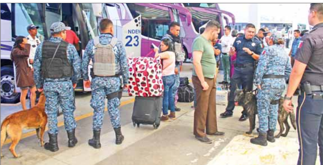
Ejecutan elementos de Policía Federal, SSPH y del Instituto Nacional de Migración, operativo Semana Santa 2019 , en la Central de Autobuses de Pachuca, para garantizar la seguridad de todos los usuarios.

Según la legislación, los partidos políticos nacionales tienen posibilidad de recibir dinero de la federación, además en entidades con registro acceden a prerrogativas locales. .3