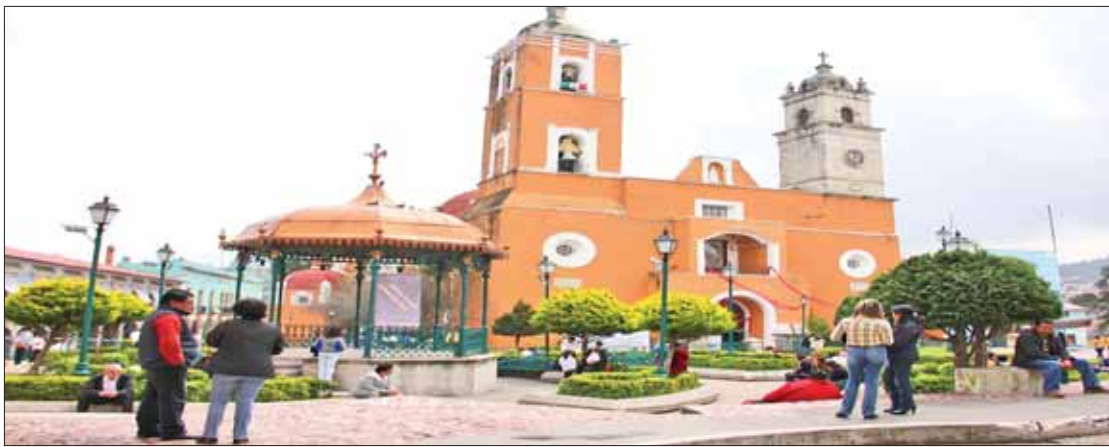
VISITAS. Algunos puntos como el Valle del Mezquital lucen hasta el tope de personas provenientes de otras latitudes.

La falta de elementos de Seguridad Pública Municipal en los alrededores de la feria genera que se tenga un alto número de cristalazos en las unidades que se estacionan en la vía pública.