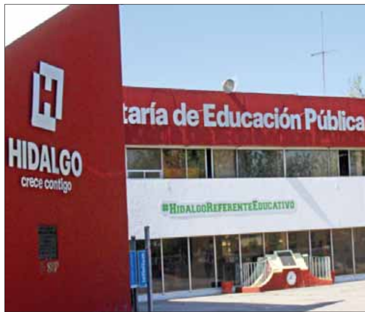
RESPUESTA. Deberán ingresar sus datos a página de la Contraloría.

A más tardar el 30 de abril todo el personal del Sector Educativo de Hidalgo deberá haber realizado su correspondiente procedimiento a fin de evitar sanciones previstas por el artículo 108 de la Constitución Política de los Estados Unidos Mexi-