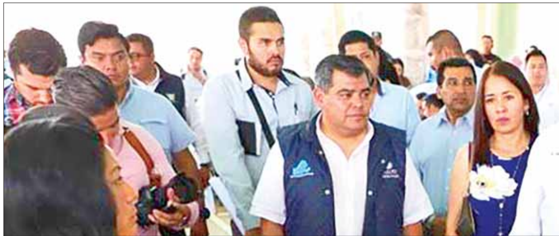
COBERTURA DE INSUMOS. En la lista de claves obligadas, aunque sólo contempla 600 claves, Hidalgo es el único estado que amplió esta lista a 700.