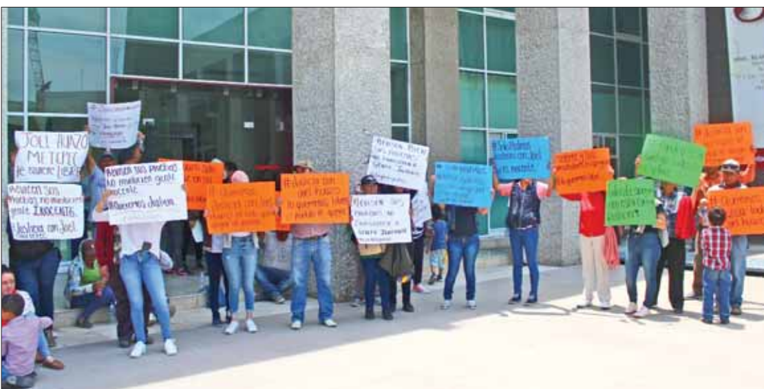
Protestaron habitantes de Metepec ante el TSJEH para exigir la liberación de una persona, acusada de homicidio calificado por linchamiento, donde perdió la vida un agente de la PGJEH.

El nuevo texto quedó: "Tratándose del nombre de la niña o del niño que se registra, este se formará con el o los nombres propios, cualquier apellido de la madre y cualquier apellido del padre. 3