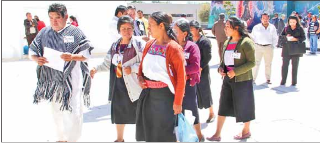
RESOLUCIÓN. Declaró el organismo local infundados señalamientos contra el IEEH y el Poder Legislativo.

► Acudió a la Sala Regional Toluca, luego de fallos del TEEH relativos a pueblos indígenas