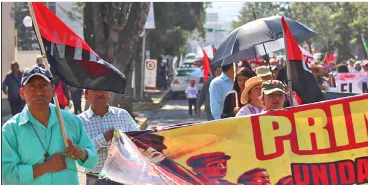
SÍNTESIS. Los diputados federales aprobaron, este miércoles, una iniciativa que modificará la Reforma Educativa, de Peña Nieto, es decir que no la eliminará al 100 por ciento, situación que generó la molestia de la CNTE a nivel estatal.

Bajo el lema "Abrogación sí, simulación no", es que la Coordinadora a nivel nacional convocó a sus agremiados a manifestarse contra lo aprobado por los legisladores. Marcharán por el Ángel de la Independencia en la Ciudad de México el 1 de mayo, y en Hidalgo se realizará de manera simultánea una protesta en el centro de Pachuca.