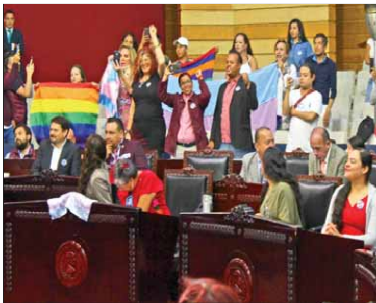
IMPACTO. Dichos ajustes tendrán efecto en Ley de la Familia, indicaron los assembleístas.

En el caso de que no exista acuerdo entre los padres, el Oficial del Registro del Estado Familiar procederá a realizar un sorteo el cual determinará quién de los padres elige el primero de los apellidos.