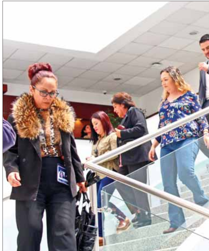
CONTRALORÍA. Entregó trípticos a las diferentes secretarías para dar mayor difusión en el tema.

Así como entes como la Comisión de Derechos Humanos