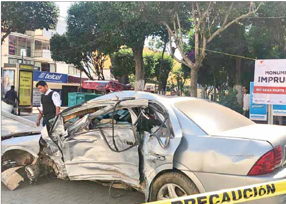
REFUERZO. Monumentos a la imprudencia serán retirados la siguiente semana pero en los días de exhibición se ha logrado el propósito de que la ciudadanía se sensibilice.

Destacó que entre lo ya realizado aparece una jornada informativa en donde la ciudadanía tuvo la oportunidad de experimentar como se distorsiona la visión cuando se sobrepasan los límites de consumo de alcohol y por ende el mensaje que se transmite es evitar manejar cansado o bajo los influjos de bebidas alcohólicas o