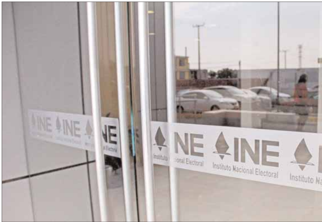
BASES. Deben alcanzar un número mínimo de afiliaciones equivalente al 0.26 % del padrón electoral, es decir 233 mil 945 mexicanos.

"Todavía no nos notifica la Dirección Ejecutiva de Prerrogativas y Partidos Políticos de las que solicitaron registro, cuando estarían en Hidalgo, pero estamos al pendiente en las juntas, ya tuvimos cursos y pláticas para efecto de organizar la logística para poder realizar las asambleas estatales o distritales, como ellos soliciten, nosotros estamos listos y solo esperamos que nos notifiquen y en eso estaríamos trabajando en Hidalgo".