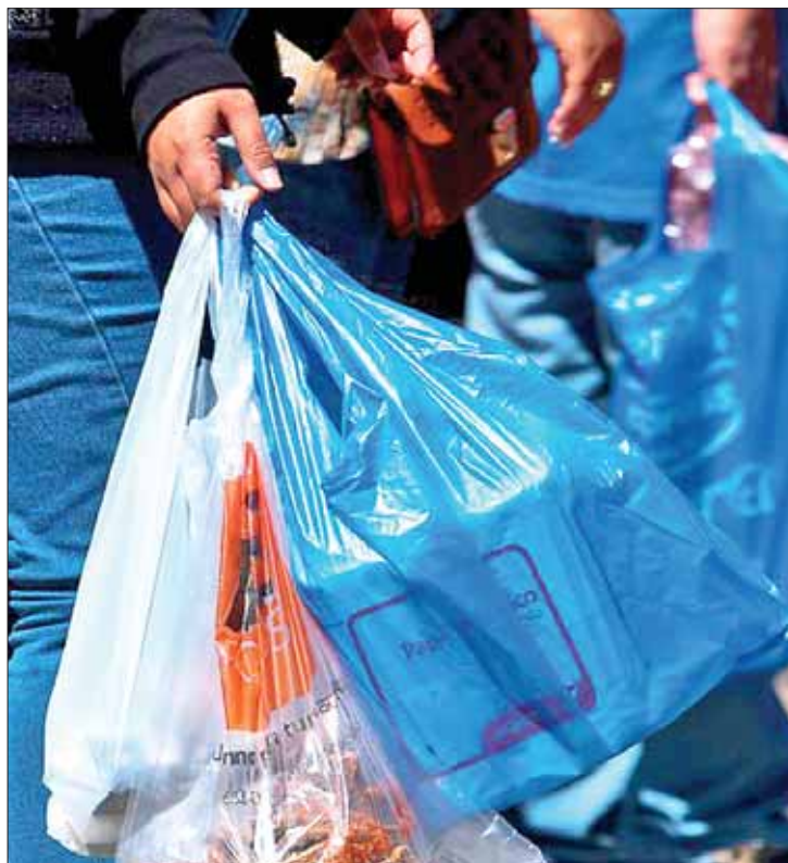
GENERALIDAD. Señalaron que hasta el momento, ni las autoridades municipales, ni estatales, han tenido algún acercamiento para sociabilizar la reforma; pese a que la modificación contempla multas.

Desconocen los montos de las sanciones para quienes incumplen los lineamientos