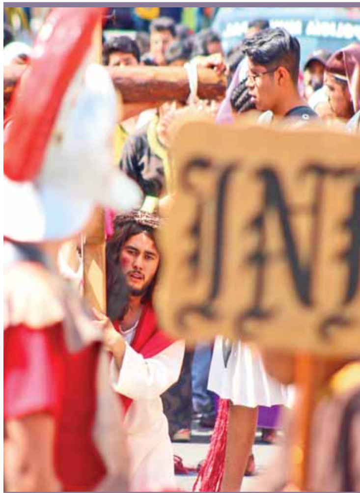
VIACRUCIS. Desde la primera estación marcó su ofrecimiento, pues: "No hemos defendido a los jóvenes de la droga, ni a los pobres de las injusticias"; luego exhortó a defender las causas justas.

Aseguró que a pesar de las caídas, normales en el camino de la vida como Jesús, y que son normales en la vida, en más de una estación del Vía crucis, el obispo destacó el valor de la mujer en la sociedad, ya que "ella es de igual dignidad que el hombre, aunque todavía en nuestro tiempo sea vista de menor valor".