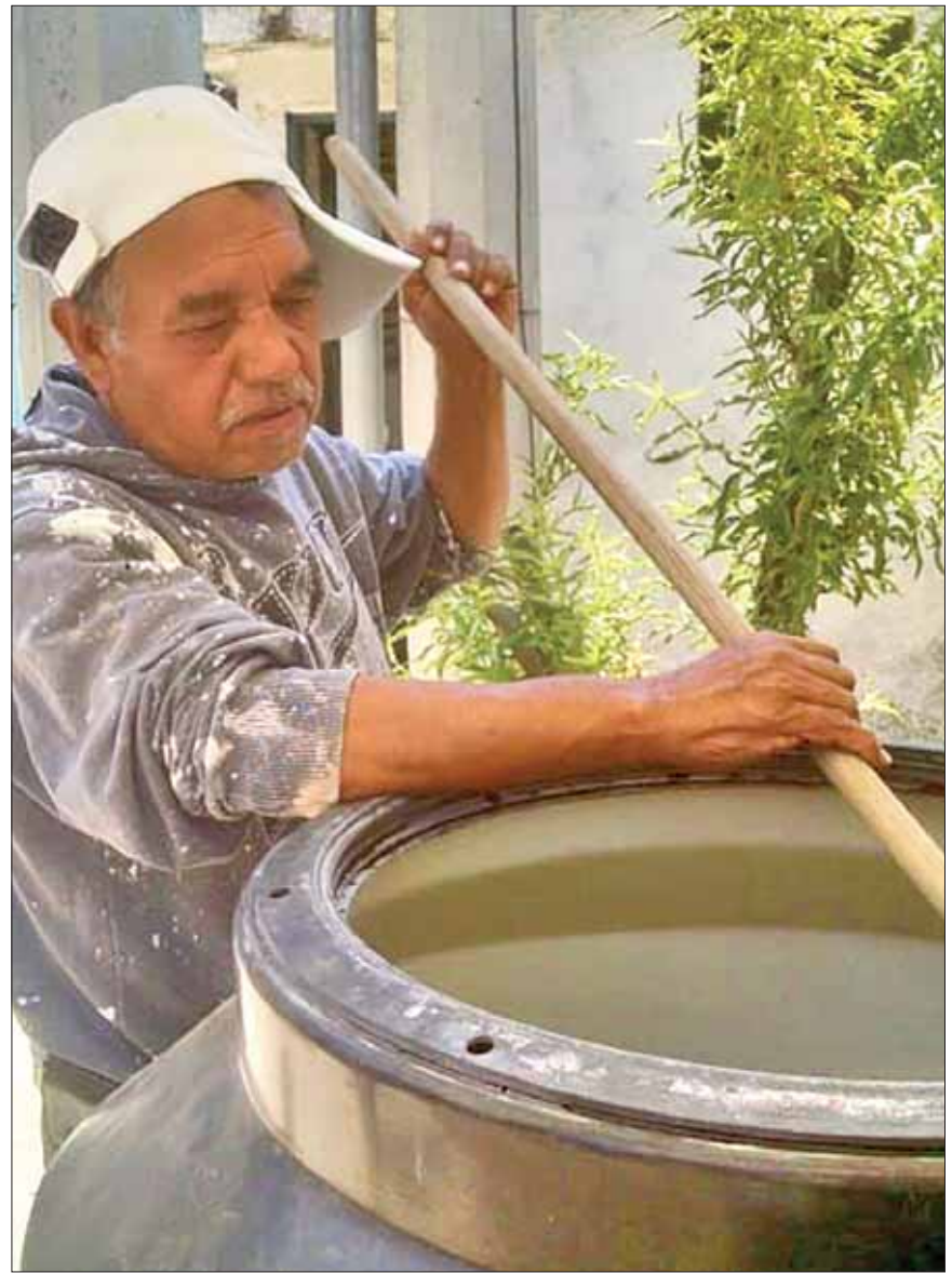
DINÁMICA. Extremo cuidado en el manejo de los alimentos y sobre todo del agua que consumimos.

Por último, enjuagar y tirar el agua en repetidas ocasiones. Al finalizar el lavado, aplicar con cuidado un poco de cloro para desinfectar sobre las paredes, para después volver a colocar el flotador para proceder al llenado del tinaco.