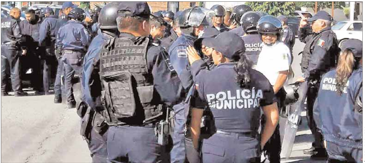
BALANCE. En la mayoría de los casos, la defensoría de los detenidos llega sin abogado por lo que les permiten acceder a uno de oficio; sin embargo, más del 90% de las personas deciden acceder a uno que consideran de confianza.

Detalló que existen situaciones al solicitar el servicio de la defensoría a través de una entrevista inicial para saber si se puede patrocinar o no al detenido de acuerdo con el reglamento bajo el cual se rigen y se estipulan a las personas que no puedan ser patrocinadas y que son las que cuentan con un sueldo oneroso que tienen bienes inmuebles o que rebasan los 100 metros cuadrados en su propiedad y que su delito está dentro de las posibilidades de defensa.