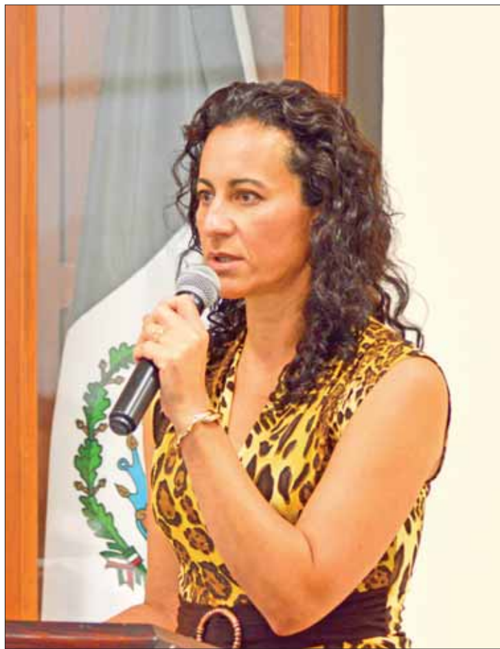
SENTIDOS. Acciones dirigidas principalmente a quienes trabajan en las presidencias municipales con la intención de adiestrar sobre la aplicación de la ley de forma honesta, transparente e imparcial.

"Estamos analizando el tema, realmente no es una propuesta que tenga impacto presupuestal, solo obedece a adelantar el proceso electoral un mes, el argumento es que ellos hacen la cuenta de 21 actividades que tiene el IEEH fuera del proceso que inciden en actividades propias, por eso quieren que esas actividades quedaran dentro del proceso electoral".