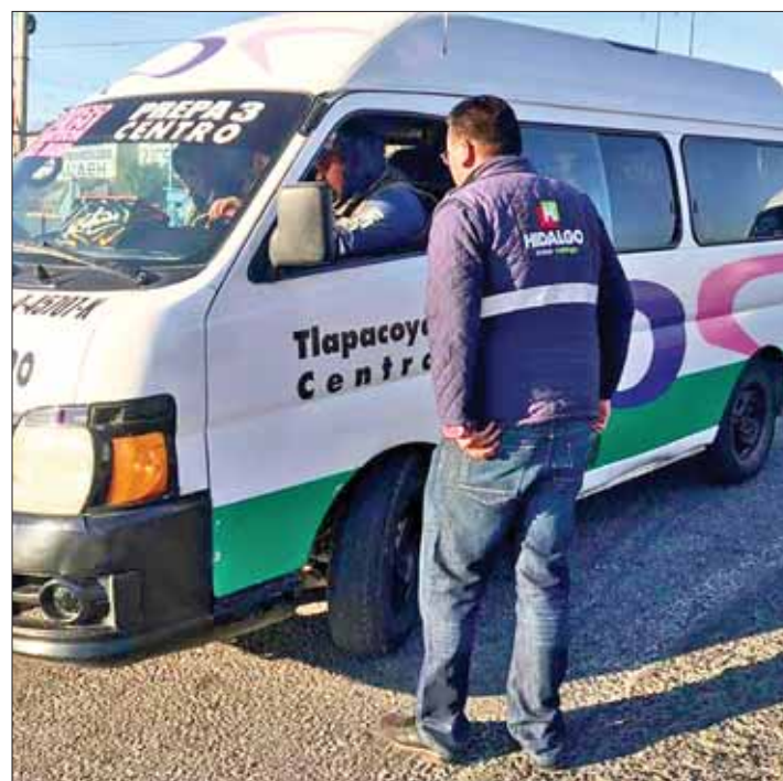
GUEVARA. Estas personas se hacen pasar como gestores que a través de un pago económico pueden conseguir placas del servicio público, porque dicen tener influencias en la Semot, lo que es totalmente falso.

dáviva que lo denuncien en las oficinas del organismo o lo denuncien al 018005032002.