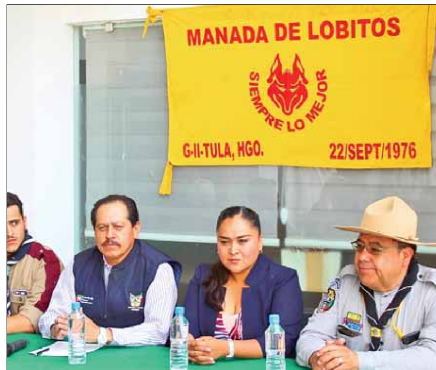
CADENAS. Destaca la Secretaría de Turismo que eventos de este tipo abonan a incrementar la afluencia de visitantes que dejan importante derrama económica en la región.

"La seguridad de los participantes está garantizada por la coordinación que se tiene con las instancias correspondientes"