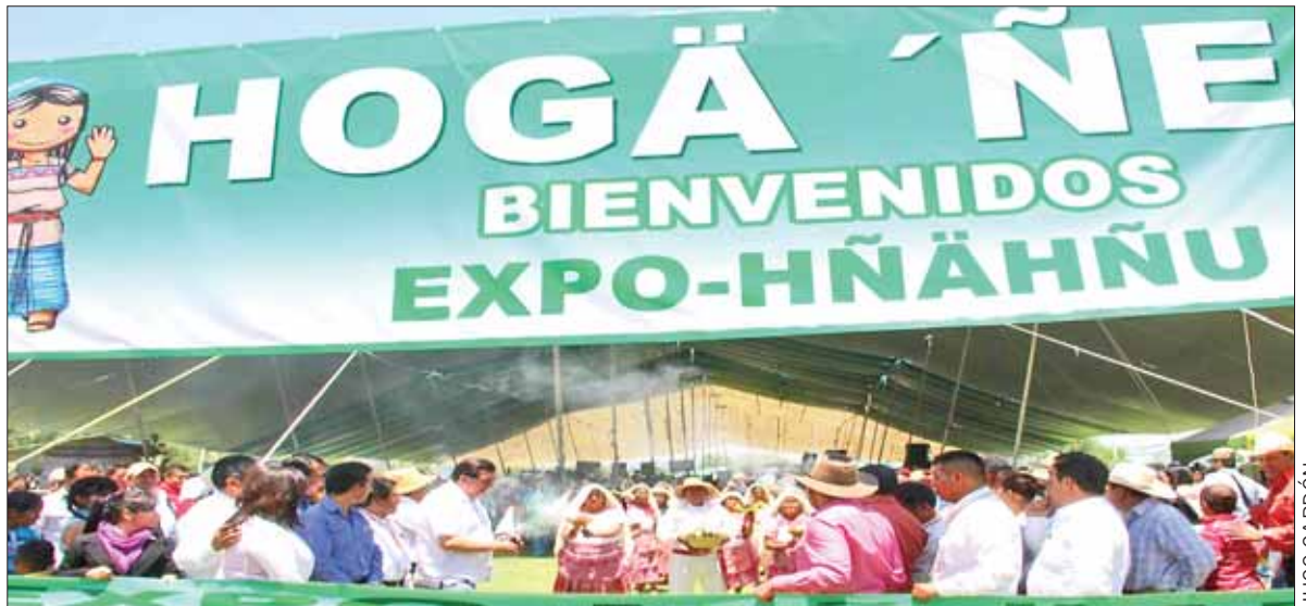
CULTURAS. Contará además con artesanos provenientes de diversas regiones de la entidad.

Expusieron que se ha planteado la iniciativa de llevar este tipo de eventos a Estados Unidos, donde se encuentra un porcentaje importante de migrantes indígenas; no obstante, hasta el momento no se ha podido concretar y también depende del gobernante en turno que se estará requiriendo de su apoyo.