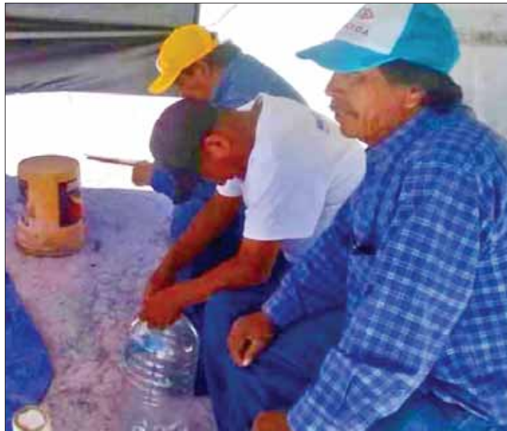
DAÑO. Acusaron quejosos que esta situación afecta a sus familias pues ya tampoco cuentan con servicio médico.

problemática, que no avanza, ya que indicaron que han dejado de percibir recursos econó-