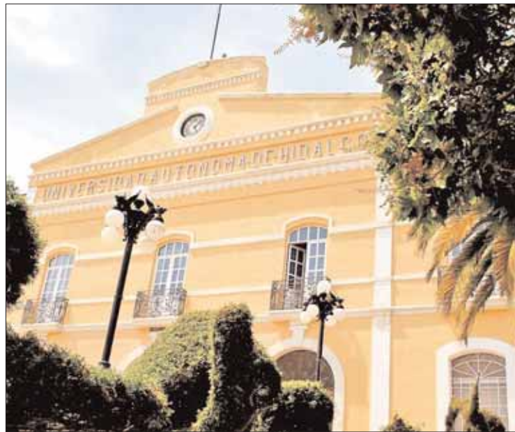
EXPLICACIÓN. Indicó Sosa, en reunión a puerta cerrada, que quiere desprestigiar a la institución; sin decir quién.

El viernes, 224 cuentas bancarias de la UAEH y de personas ligadas a ella (administrativos o funcionarios) fueron bloqueadas, al ser objeto de investigaciones que permitan esclarecer el origen y destino de los recursos que en