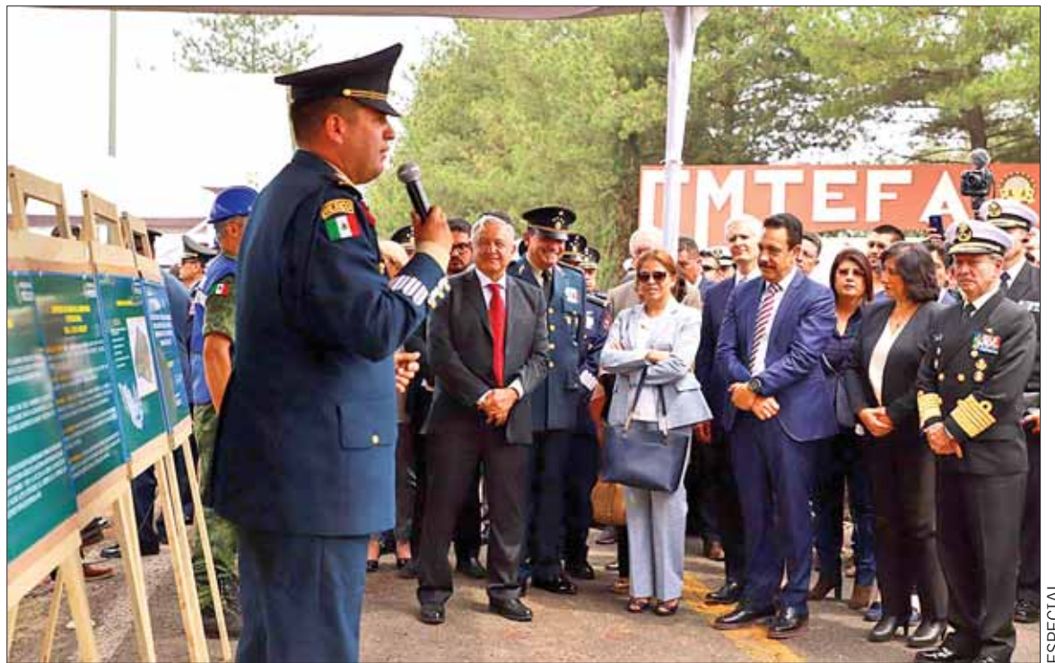
Hidalgo presente en informe sobre el que será el Nuevo Aeropuerto Internacional Felipe Ángeles, acto encabezado por el presidente.

"Algunas veces existen problemas muy grandes, que sólo el gobernador puede resolver", este ejercicio servirá para exterminar elementos como la burocracia. Garantizó que cualquier persona que necesite exponer una necesidad directamente con el gobernador él la atenderá. .3