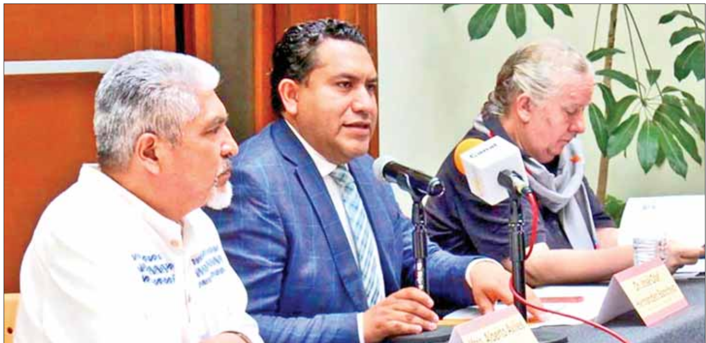
PROPÓSITO. Enaltecer a creadores e investigadores por la labor realizada durante largo tiempo en pro del patrimonio artístico y cultural de la entidad.