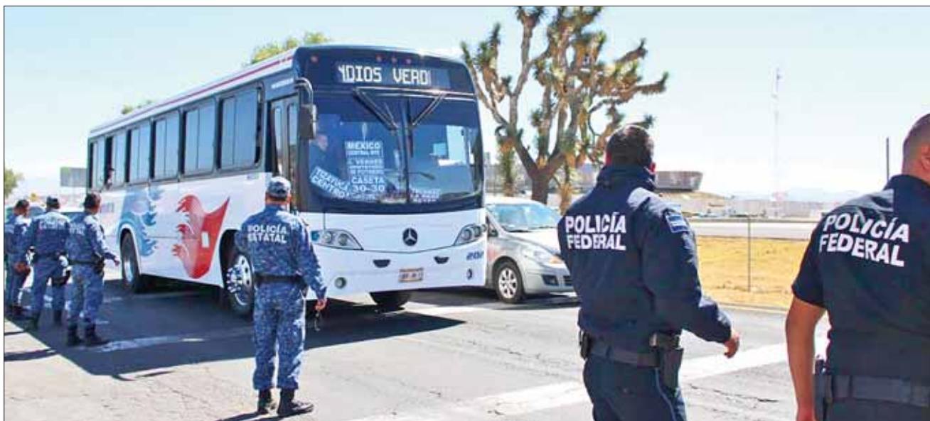
MEDIDA. Fueron 292 chequeos médicos aplicados a choferes de transporte de carga, 63 de autobuses de pasajeros, 23 de transporte doble articulado y 10 de turismo.

Finalmente, exhortaron a la población a mantener la cultura de circular con el respeto a los límites de velocidad en la Red de Carreteras Federales, a fin de mantener bajas las cifras de accidentes carreteros, al señalar que la responsabilidad es compartida y requiere de la participación de transportistas y conductores particulares.