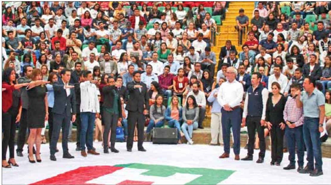
FORO REPÚBLICA JOVEN 2019. Será historia este evento porque es el primer encuentro a escala nacional que realizan el Gobierno de la República, la Organización de las Naciones Unidas y la administración estatal.