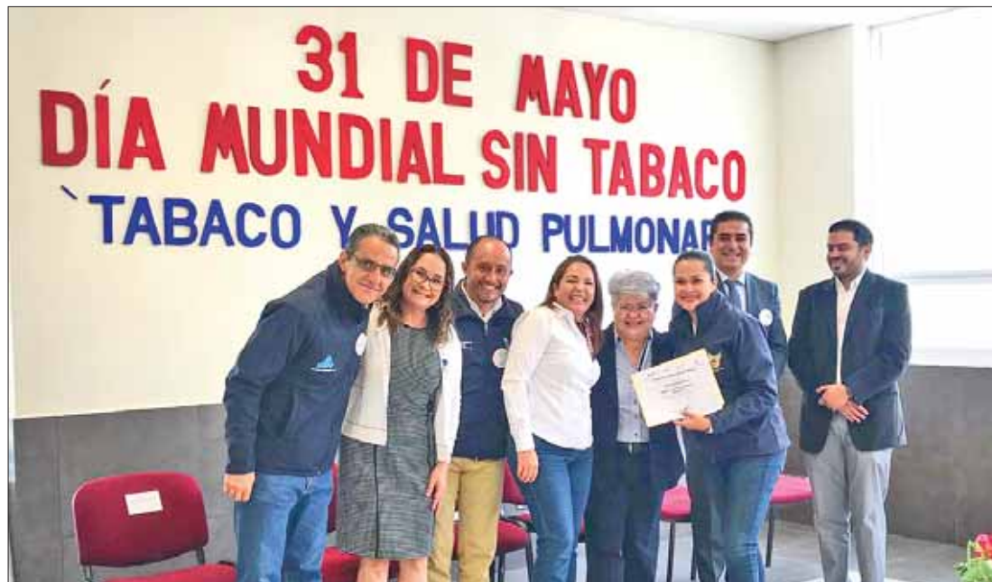
SENTIDOS. Además entregaron 312 reconocimientos a espacios 100 por ciento Libres de Humo de Tabaco.

Dichas actividades, que se llevaron a cabo en el Centro de Salud "Dr. Jesús del Rosal, estuvieron dirigidas a personal de instituciones públicas y privadas de atención a las adicciones e integrantes del CECAH, así como a trabaja-