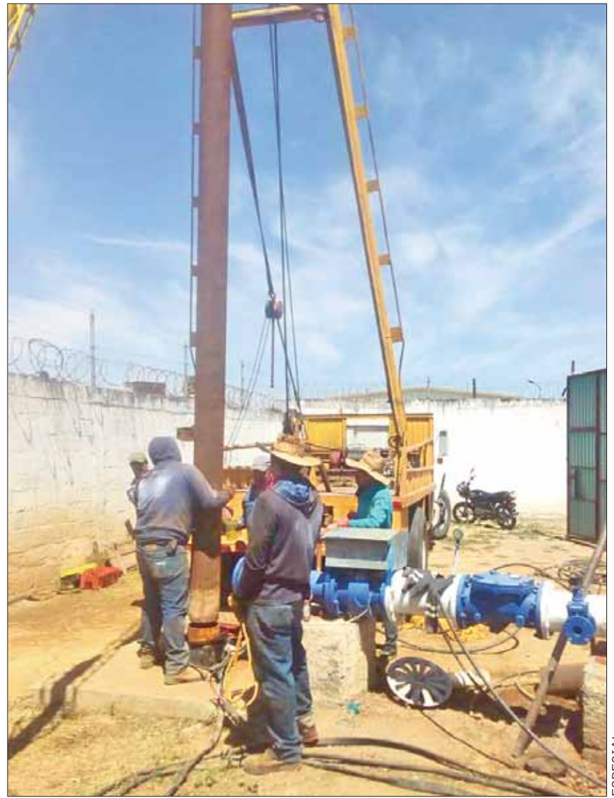
IMPLICACIONES. Para proceder a la compostura correspondiente existieron inconsistencias en el abasto del vital líquido en algunos sectores de la ciudad.

En todo momento el funcionario agradeció la coordinación con los delegados de las demarcaciones que se vieron involucradas.