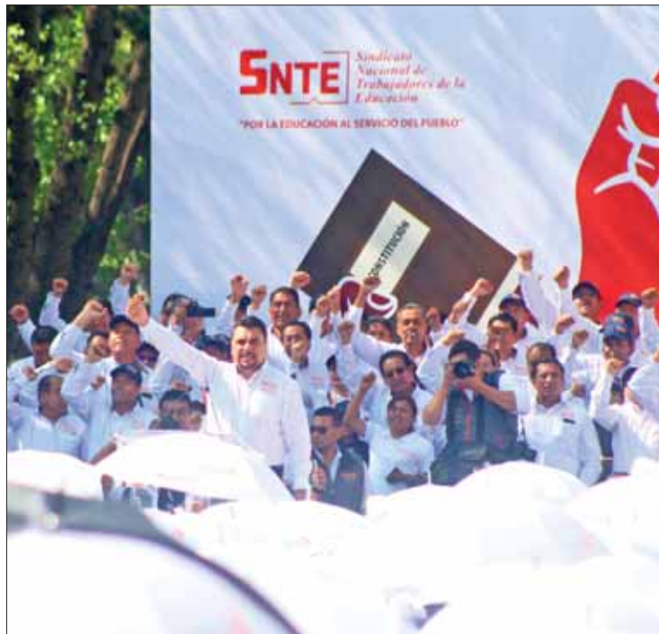
TRADICIÓN. Encabezó SNTE marcha para conmemorar Día del Trabajo, por Pachuca..

Recordó que del foro de consulta ciudadano realizado por el Gobierno de la República el 24 de octubre de 2018, emanaron