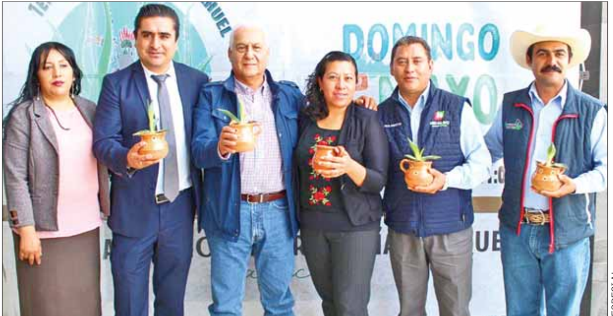
DESTACA. El maguey da identidad como mexicanos y particularmente como hidalguenses, ya que forma parte del paisaje del Altiplano.

Dio a conocer que esperan una afluencia de entre 5 y 6 mil personas que dejarán una derrama económica de un millón de pesos.