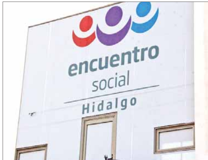
LOGROS. Suma uno más de los partidos a mantener en Hidalgo con el erario.

nimo en la contienda federal, en los comicios de diputados locales obtuvo el 4% de los sufragios, además de que postuló aspirantes propios en 12 de los 18 distritos en disputa, además de que en las seis jurisdicciones restantes conformó candidaturas comunes.