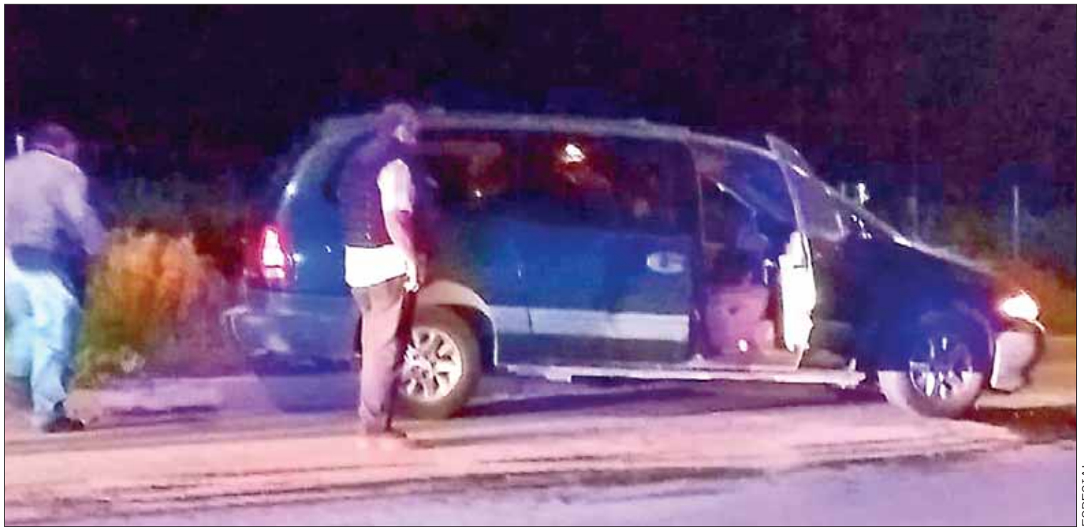
CACERÍA. Indicaciones del procurador Arroyo son llegar hasta las últimas consecuencias para determinar quiénes fueron los responsables.

Derivado de los incendios que se registran en esta temporada del año, autoridades municipales de Zimapán conformaron la denominada Brigada Comunitaria. (Hugo Cardón)