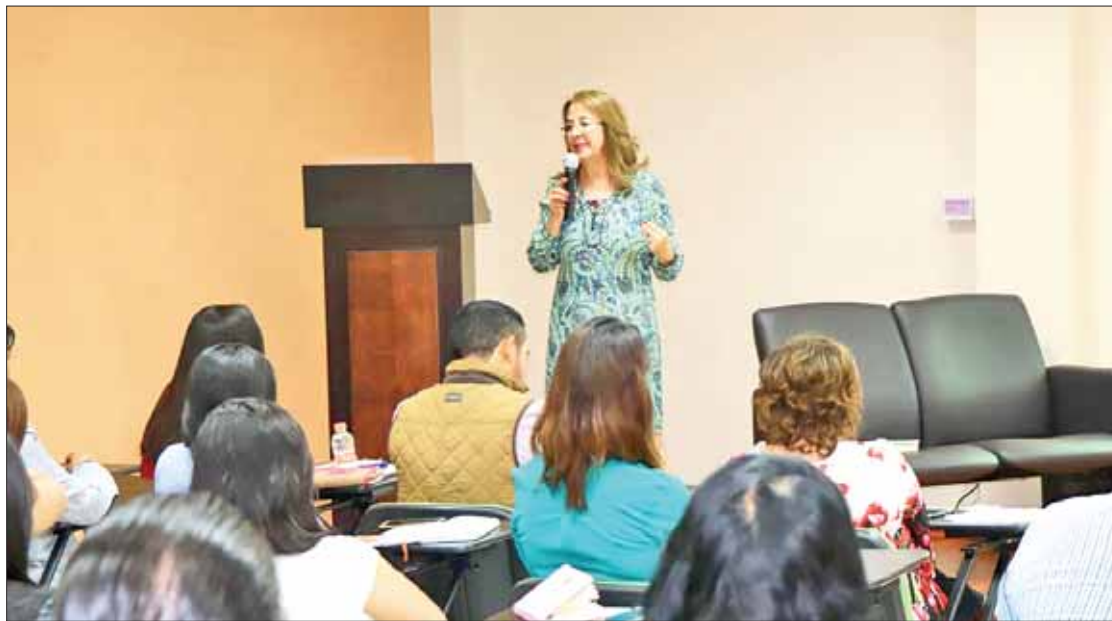
FÓRMULAS. Ampliar las capacidades de este sector en todos los ámbitos.

Reconoció que, como ha instruido el Gobernador Omar Fayad desde el Plan Estatal de Desarrollo, en la Política Transversal de Perspectiva de Género, se deben ampliar las capacidades de las mujeres en todos los ámbitos del desarrollo con la finalidad de garantizar el ejercicio de