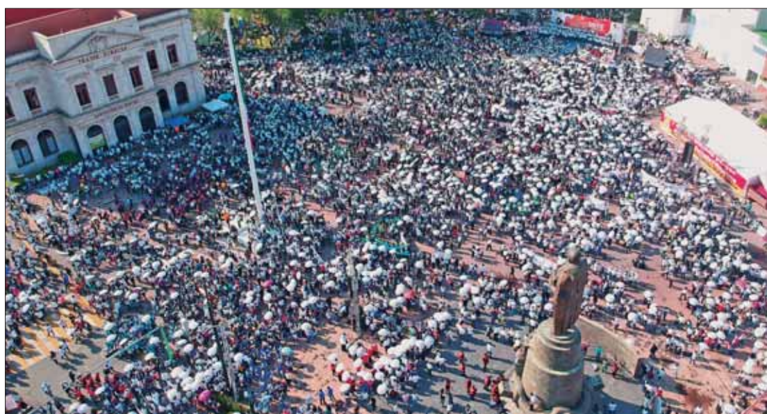
Abarrotada lució la Plaza Juárez este primero de mayo, con contingentes de diversos sindicatos que acudieron para conmemorar el Día Internacional del Trabajo.