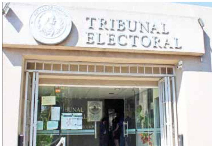
PRECEDENTES. Hay denuncias también por violencia política de género.

Remitieron copias del expediente a la Procuraduría General de Justicia del Estado (PGJEH) por posibles