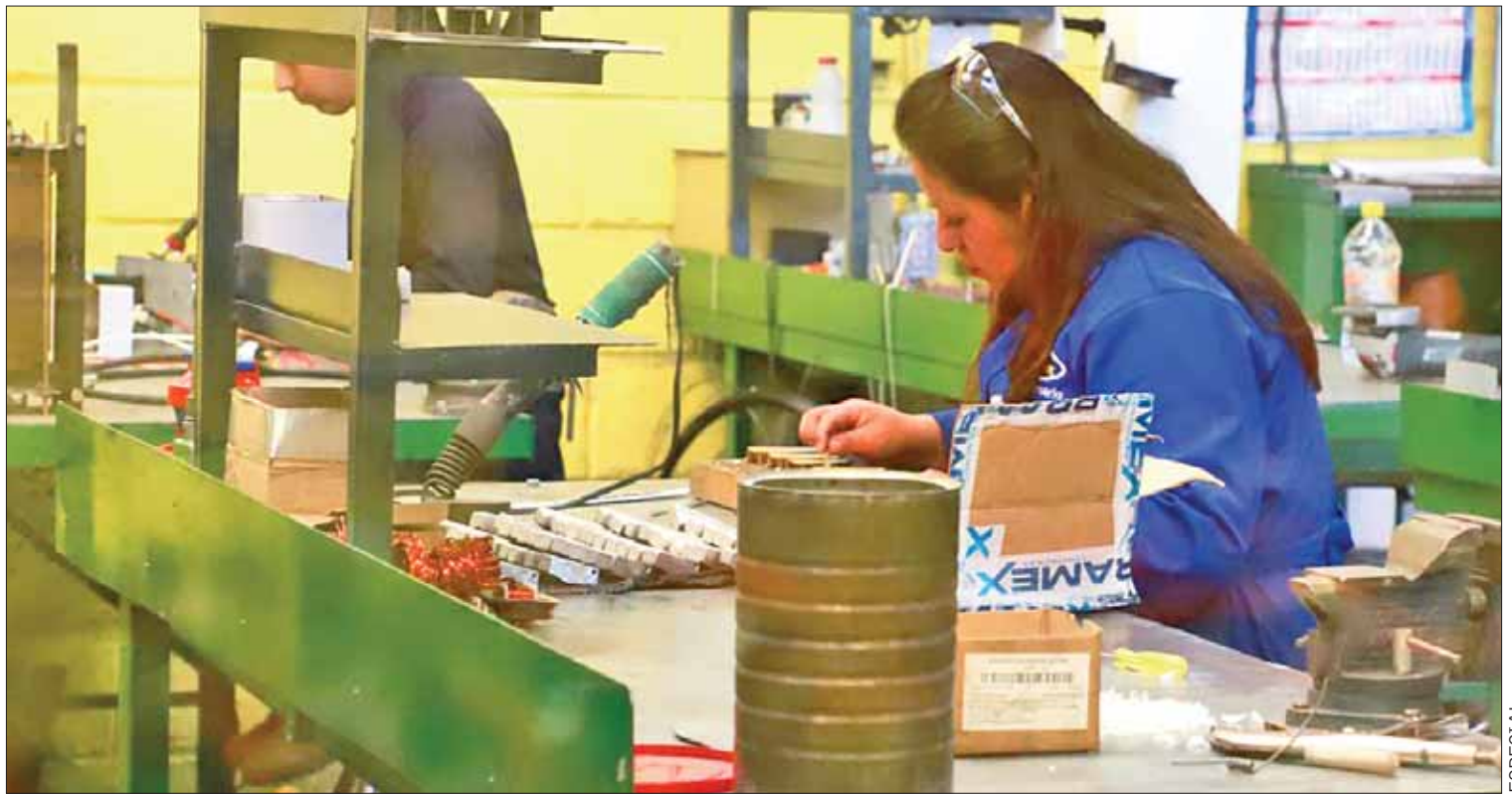
STPSH. En caso de duda, las y los trabajadores pueden acudir a las oficinas de la Procuraduría Estatal de la Defensa del Trabajador (bulevar Ramón G. Bonfil No. 1504, colonia Arboledas de San Javier, en Pachuca).

Quienes conformen la lista de los ganadores de este certamen serán notificados el 28 de junio a través de una llamada telefónica o correo electrónico y la premiación constará de un viaje al Puerto de Veracruz para el primer lugar, un obsequio especial para el segundo y tercer puesto.