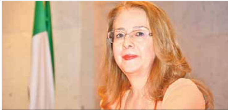
ENCUENTROS. Consideró Oviedo diversas aristas que deben ser puestas sobre la mesa.

Aunque no pormenorizó cifras porque depende de lo que determinen en la reforma política que actualmente discuten partidos políticos, adelantó que los empates de procesos de gobernador,