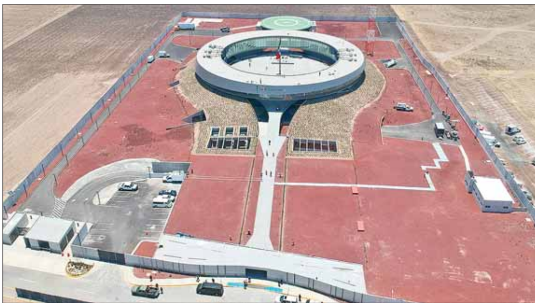
Hoy inaugura AMLO uno de los centros de Seguridad Pública más modernos de toda América Latina, ubicado en Hidalgo.

Ubicado en el municipio de Zapotlán, está dividido en cuatro niveles. 3