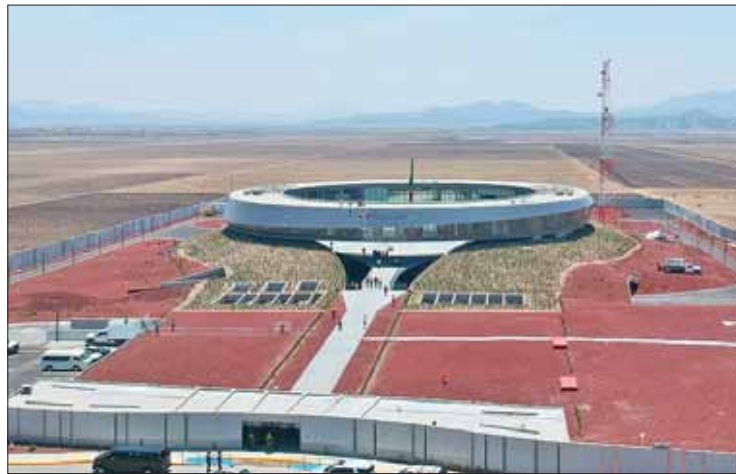
DATOS. Dispondrá de 5 mil cámaras de videovigilancia, diversos niveles y áreas, así como operación de arcos carreteros.

VIGILANCIA URBANA. Consiste en monitoreo de 5 mil cámaras de