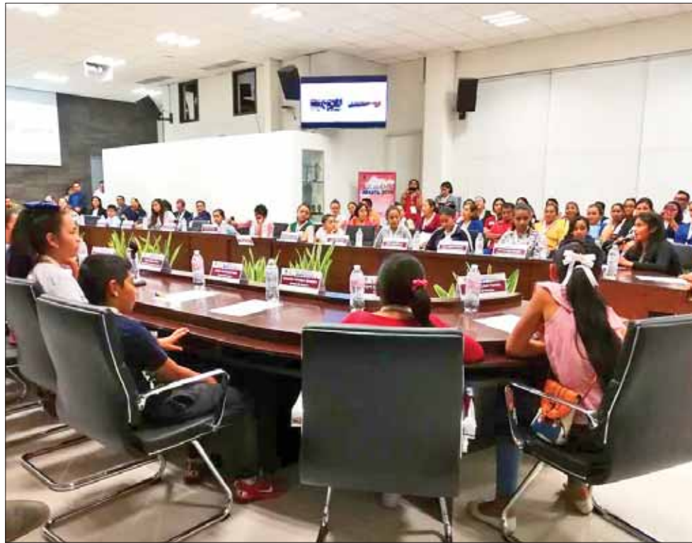
CALIDAD. Esta actividad tiene la idea de escuchar inquietudes de los menores.