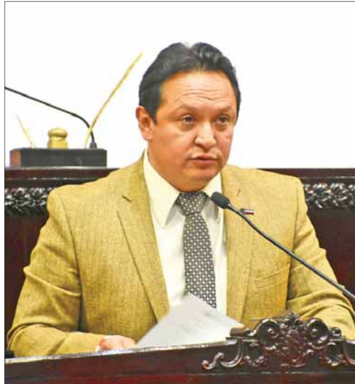
OBRAS. Lanzó Espinoza exhorto para que ayuntamiento diga en qué son utilizados estos montos.

Recordó que en julio de 2017 fue modificado el convenio con la empresa a la que se concesionó el servicio en 2015, en el cual se obliga a pagar 40 por ciento del monto total de las percepciones al ayuntamiento y esos recursos serían destinados a mejorar los espacios públicos; sin