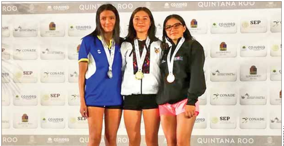
SIGNIFICADO. Es el tercer metal dorado para la delegación del estado que compete en la Olimpiada Nacional y Nacional Juvenil 2019.

Los representantes hidalguenses contabilizan 10 medallas (tresoros, una plata y seis bronce).