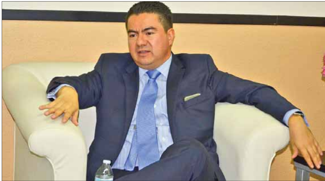
PROYECTOS. Explicó Huerta todos los procesos para que pueda concretarse el destino en ciencia y tecnología.

"Faltó contexto que se planteó que sólo habíamos ejercido, pero tenemos que contextualizar el proceso a seguir con las multas, es medio tortuoso o burocrático, pero garantiza el tema del orden, eficacia, transparencia y rendición de cuentas. El IEEH hace descuentos, pero no de manera inmediata nos los ce-