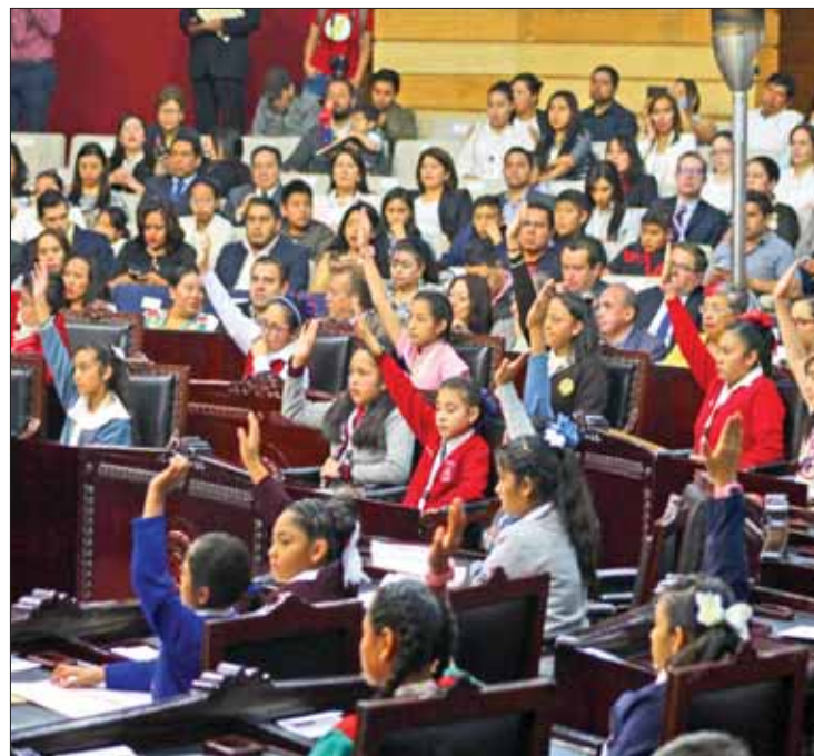
LABOR. Presentaron menores legisladores seis acuerdos en varios temas.

También se exhortó a las autoridades involucradas en el tema de violencia infantil, así como a las educativas, para que emprendan una campaña de difusión y capacitación sobre derechos de los niños y adolescen-