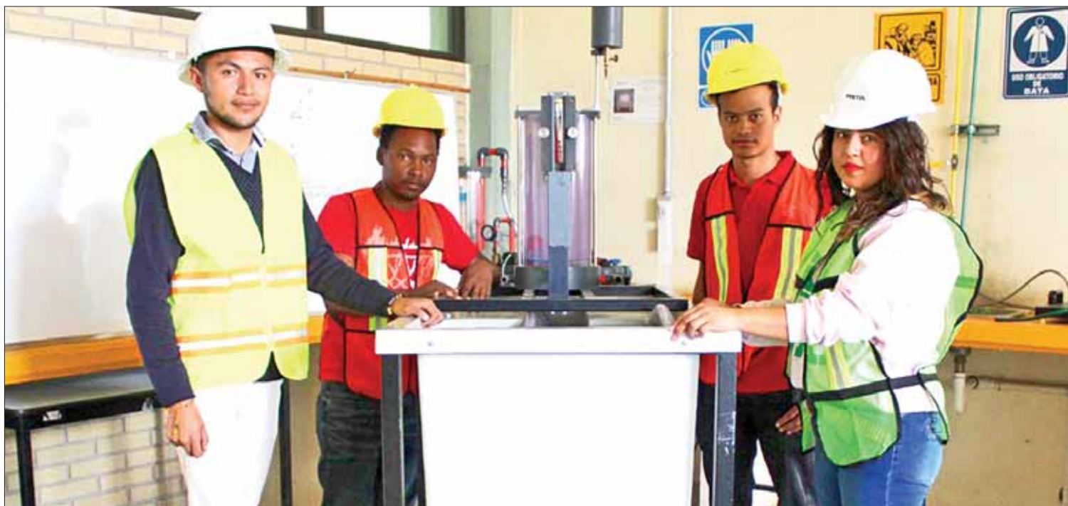
ETAPAS. Competencia servirá de preparación para la Olimpiada Nacional del Conocimiento en Ingeniería Civil, que es realizada a finales de año por el Colegio de Ingenieros Civiles de México.

Los hechos tuvieron lugar en una zona alejada del asentamiento urbano: no se consideraron de alto riesgo.