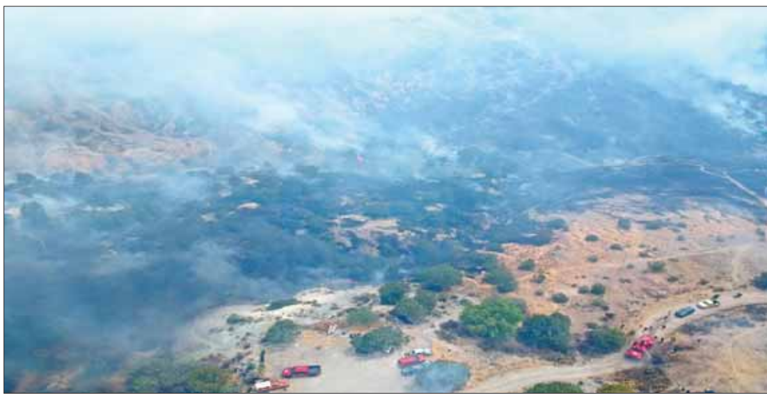
Fuerte incendio registrado ayer en el cerro de Camelia, en Pachuca, obligó a evacuar a pobladores de la zona. Cerca de 150 personas, entre brigadistas de dependencias como la Semarnath, Protección Civil, Bomberos, SSPH, entre otras, actuaron de manera oportuna para abatir las llamas, que generaron una enorme columna de humo.

Citnova respondió en la solicitud de información 00103319, que recibió un total de 27 millones 970 mil 379.19 pesos, emanados de multas que recolectó el IEEH. .3