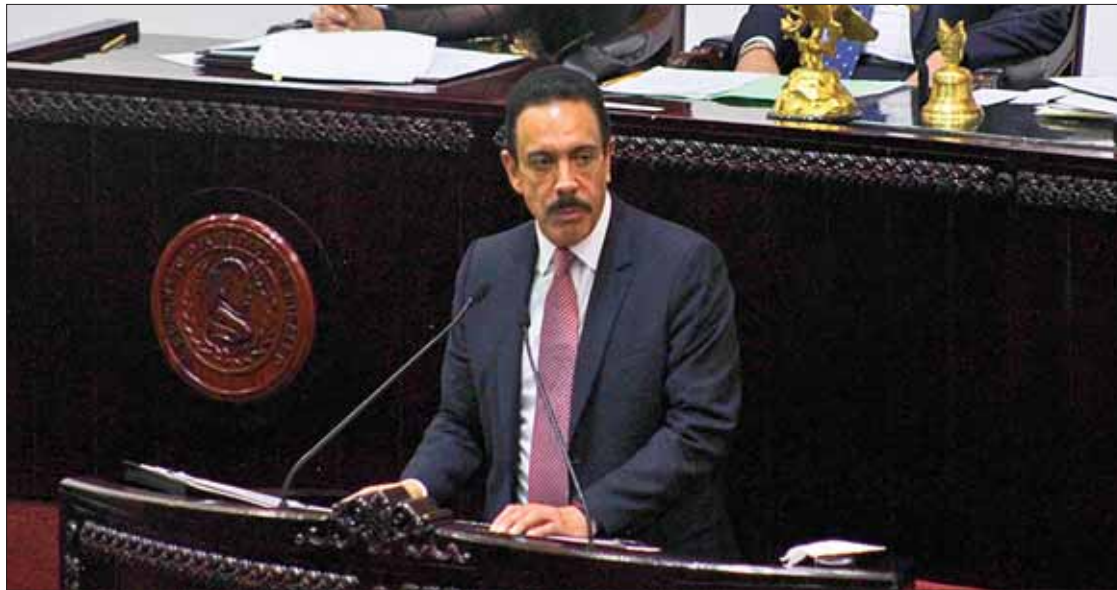
CONFIANZA. Recordó el mandatario estatal que el presidente AMLO tiene un gran aliado estratégico en su administración.

El mandatario estatal reconoció que el Congreso representa un grupo de voces de todo el esta-