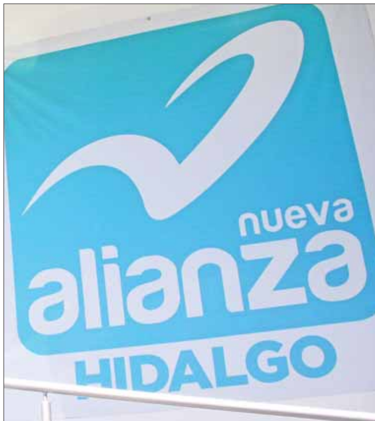
DIRECTRICES. Expuso Luna que este organismo es protocolario y respeta las leyes y los estatutos.

"Nueva Alianza es legal, legítima y en estricto respeto a nuestro estatuto, sobre todo a los aliancistas, buscando las mejores decisiones, también nos ha tardado en algunos municipios porque se ha despertado inquietud, efervescencia, por la ruta diseñada desde el 2 de julio de 2018, cuando les dijimos que esta fuerza no se diluye".