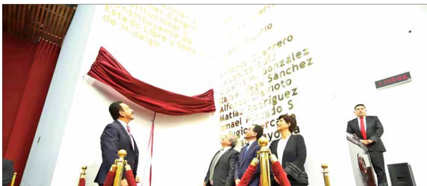
Develaron autoridades federales y estatales, así como del Poder Legislativo, leyendas en letras de oro para conmemorar el 150 aniversario del Congreso hidalguense.

El mandatario estatal reconoció que el Congreso representa un grupo de voces de todo el estado; sin embargo, advirtió que ningún Poder se debe imponer sobre los demás. 3