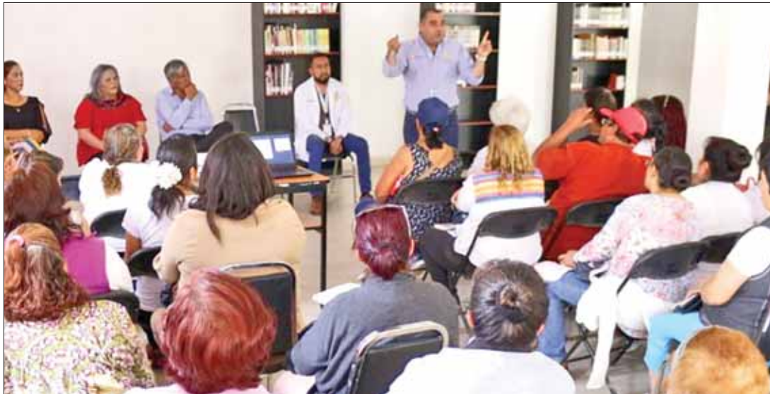
PRINCIPIOS. Acatan las reglas de operación, según criterios que establece la Organización de las Naciones Unidas, e INAPAM.