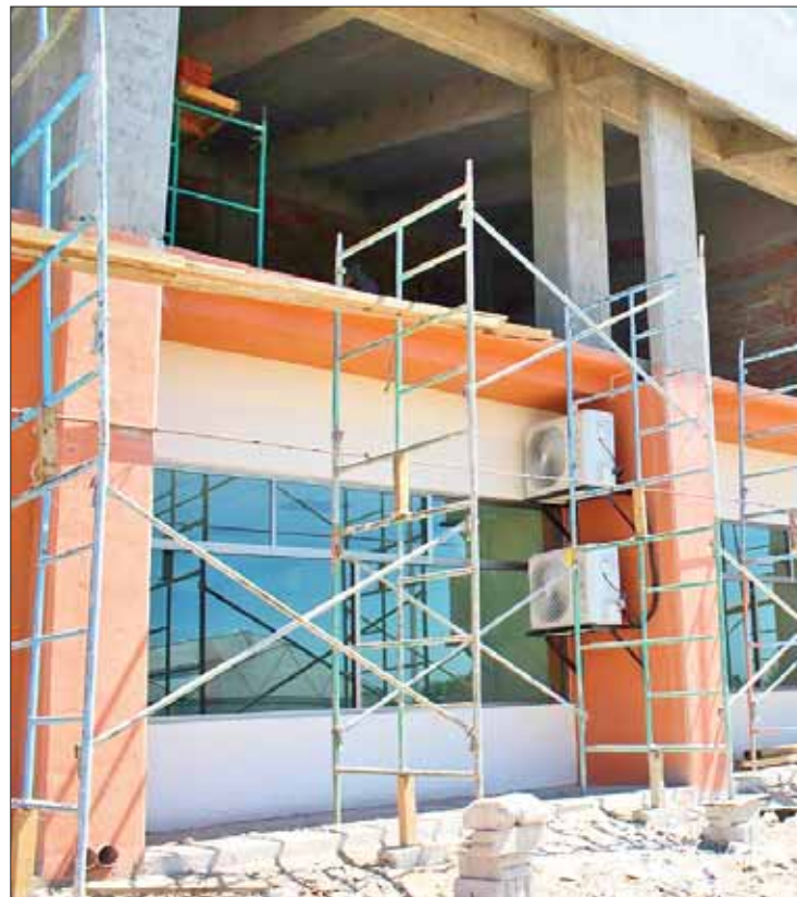
CAUSAS. Objetivo es brindar mejor servicio a la ciudadanía, puesto que antigua presidencia resultaba insuficiente para un municipio que ha crecido exponencialmente en los últimos años.

Anteriormente, Castillo Martínez dijo que el inmueble se remodeló y fue ampliado con el objetivo de brindar mejor servicio a la ciudadanía, puesto que de repente la antigua presidencia ya resultaba insuficiente para un municipio que ha crecido exponencialmente en los últimos