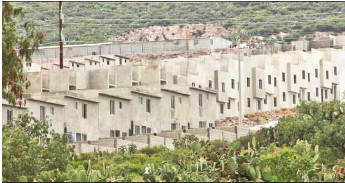
DESARROLLADORES. Recordó titular de oficina que el ayuntamiento no ha dado en esta gestión ni un solo permiso.

Las autoridades de la presidencia municipal solicitaron en estos casos cumplir a cabalidad con el reglamento de construcción,