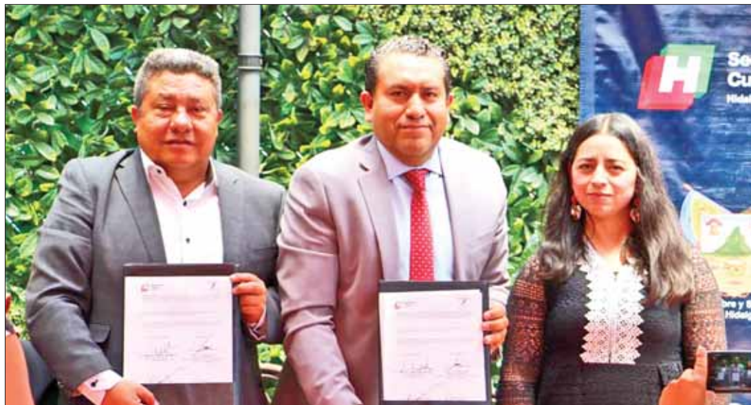
OBJETIVO CLARO. Acercar a mayor número de hidalguenses ofertas artísticas y culturales de calidad.