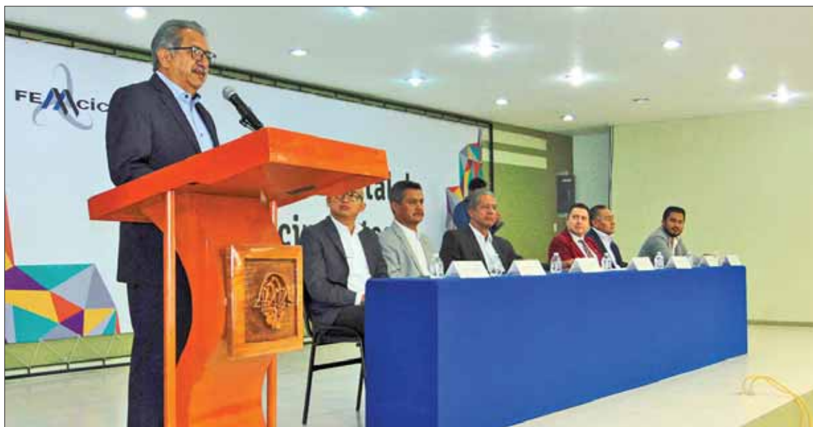
MUESTRAS. Inaugura titular de la SEPH la Segunda Olimpiada de Conocimientos 2019 de Ingeniería Civil.