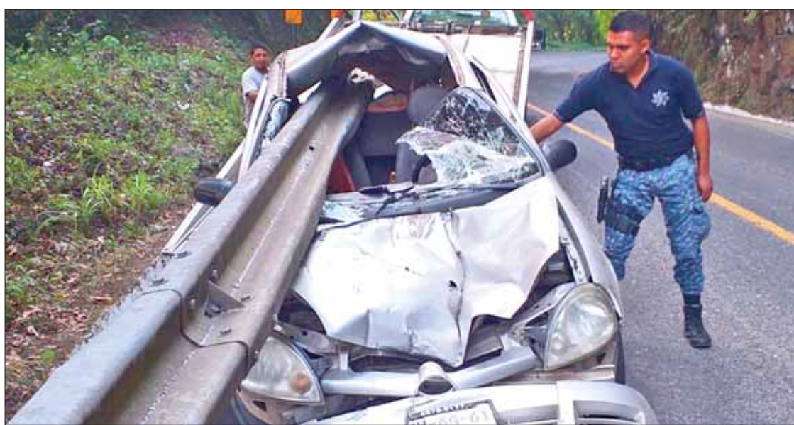
Destrozado quedó un auto compacto al estrellarse contra la barra de contención, en Tlanchinol; una persona resultó lesionada.

"En la presente administración no se han autorizado más licencias de construcción para nuevos desarrollos habitacionales en el municipio". .3