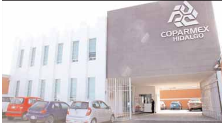
PARADOJAS. Manifestó que ni los mismos Juzgados de Distrito se ponen de acuerdo.

Que la compensación de cantidades que tengan a favor los