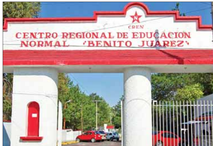
CONGRESO. Tras debates y análisis de condiciones.

ral, multilingüe, va más allá del encuentro de culturas, que caracterizan a la sociedad mexicana. Es necesario mirar perfiles de reformas de escuelas normales para analizar qué se hizo y qué falta, debido a que esas reformas están desfasadas.