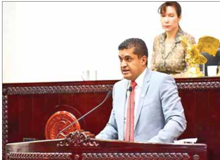
GLOBAL. Desarrollo integral de la sociedad debe apreciar diferentes rubros, indicó el legislador.

La formulación de planes y programas considerarán elementos demográficos, culturales, eco-