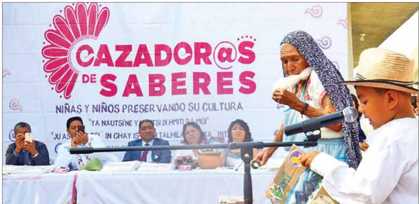
CELCI. Destaca la importancia de vincular a las abuelitas y los abuelitos de la comunidad como fuentes de saberes, que pueden compartir a la niñez su herencia e identidad cultural.

Cabe mencionar que este evento es un hecho inédito, ya que se integra por primera ocasión a estudiantes de preescolar indígena a este programa, para que sean los nuevos promotores de su cultura, quienes dieron una muestra de sus investigaciones de manera bilingüe, apoyándose en todo momento de sus libros cartoneros.