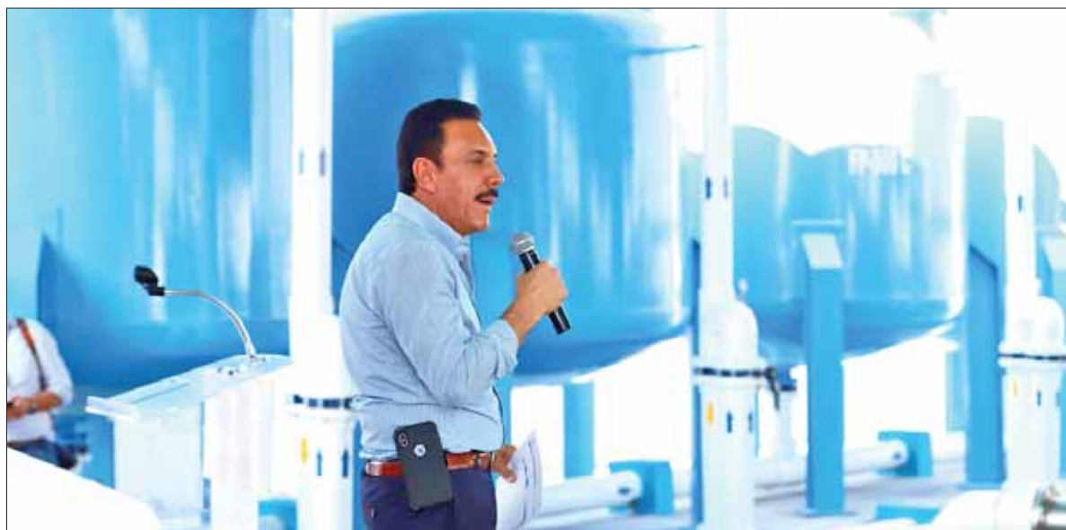
COMPROMISOS. Inauguró gobernador Fayad planta potabilizadora de agua en Progreso, para beneficio de más de 17 mil habitantes, con inversión superior a 3 mdp y anunció gestiones para un nuevo pozo. .2