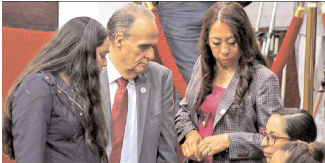
EVASIVAS. Además, según el presidente de la Junta de Gobierno, no había condiciones dentro del recinto.

Recordó la discusión que se efectuó el pasado miércoles al seno de la Comisión de Legislación y Puntos Constitucionales, donde fue aprobada la reforma al mencionado artículo y que solicitó que para la aprobación de cualquier reforma a leyes estatales pueda hacerse sólo con mayoría simple y no califi-