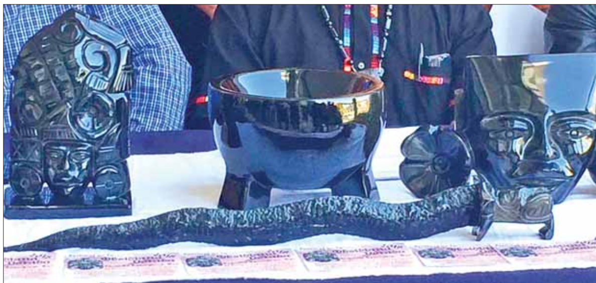
INDICACIÓN. Necesario apoyar a cada una de las personas que se muestran por fortalecer la cultura, en cualquiera de sus manifestaciones.

Añadió que para la dependencia es importante que la cultura llegue a todos los municipios de Hidalgo, como lo ha establecido el gobernador Omar Fayad Meneses, quien tiene la certeza, de que es necesario apoyar a cada una de las personas que se muestran por fortalecer la cultura, en cualquiera de sus manifestaciones, dentro de la entidad.