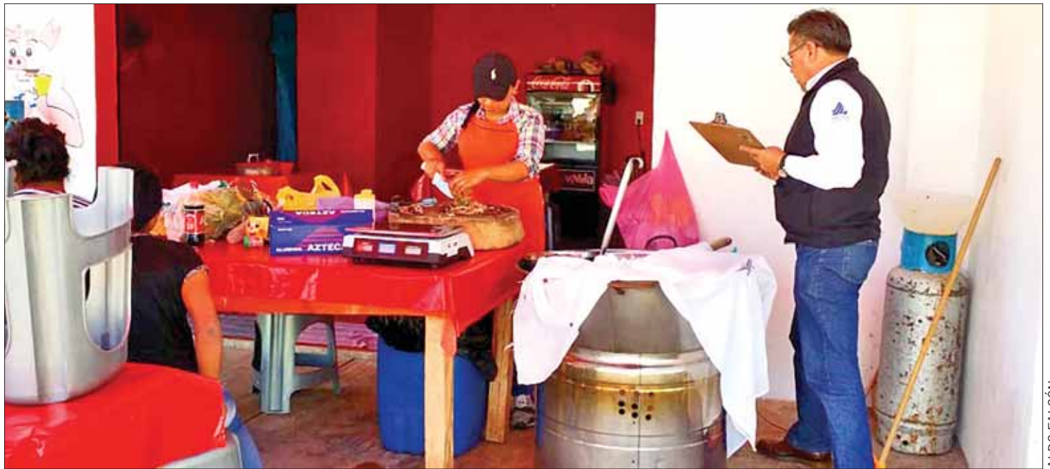
REGLAS. Mantuvo vigilancia estricta en cuanto a venta de productos como pescados y mariscos, así como supuesta purificación del agua.

Destacó que las actividades de difusión y promoción de los derechos humanos encajan en la pluralidad cultural, en afinidad con los estándares internacionales. (Alberto Quintana)