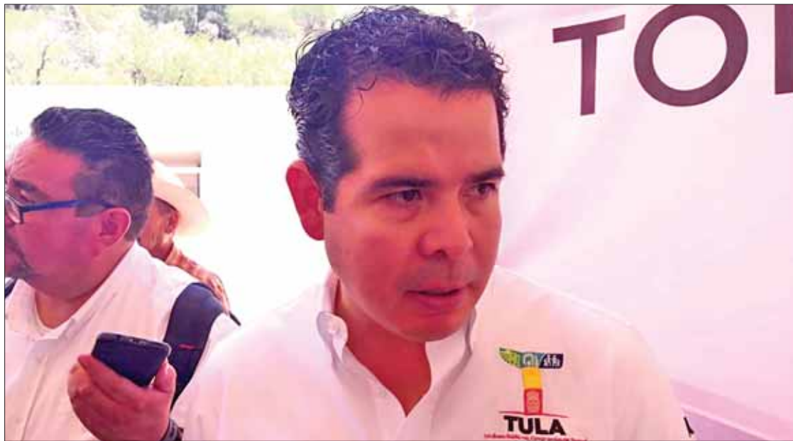
FORTALEZA. Celebró el edil la reciente incorporación de su alcaldía al Protocolo Antilinchamientos.

"De nada servirá mayor equipamiento, mejor armamento o más capacitación si no se dictan