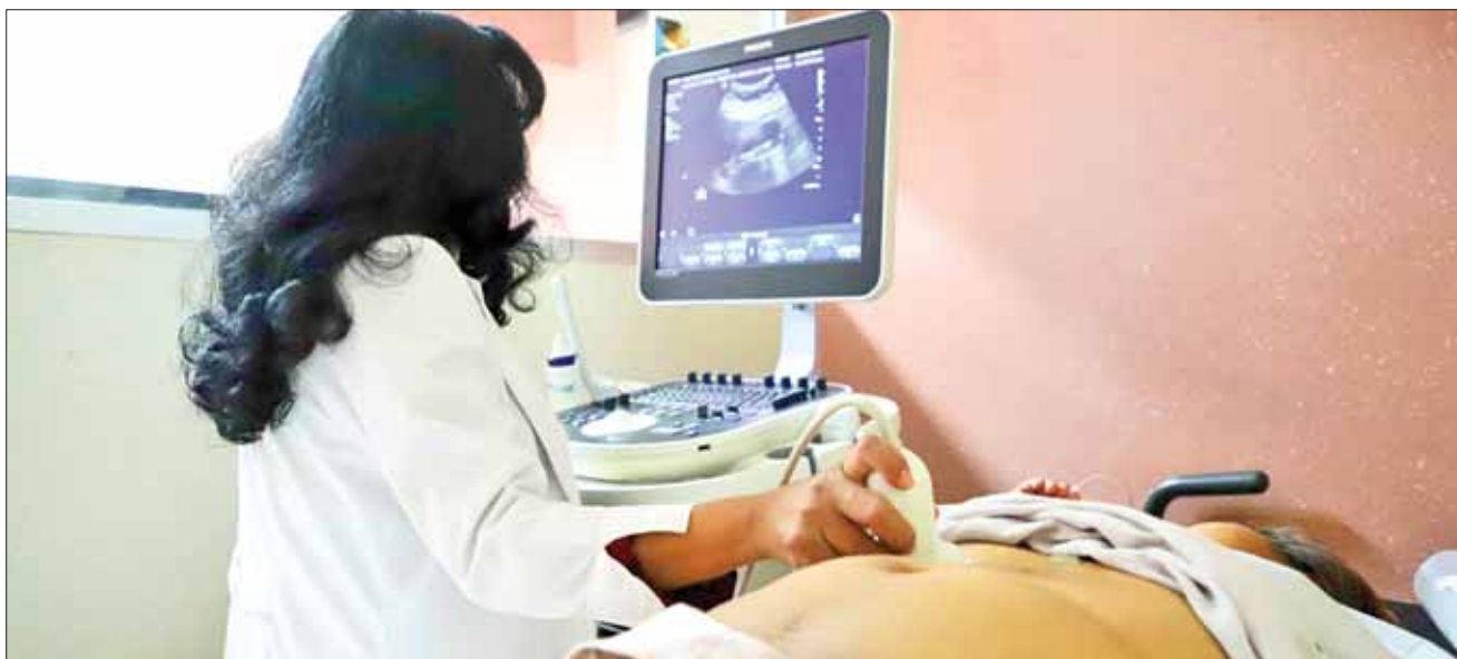
CALIDAD. Subrayó la dependencia programas que ejecuta en la actualidad para la atención en este tema.

Otro de los hábitos a fortalecer es la actividad física, por lo que algunas recomendaciones son caminar, nadar y practicar yoga, por lo menos 30 minutos al día; sin embargo, es necesario evitar deportes de contacto físico y actividades aeróbicas de alto impacto.