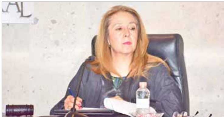
SOLICITUDES. Confirmó presidenta que lugar ya no es suficiente.

La solicitud inicial del órgano jurisdiccional hidalguense para el presupuesto de este año requeriría un monto superior a 19 millones de pesos, finalmente el Congreso avaló un total de 29 millones 614 mil 545 pesos.