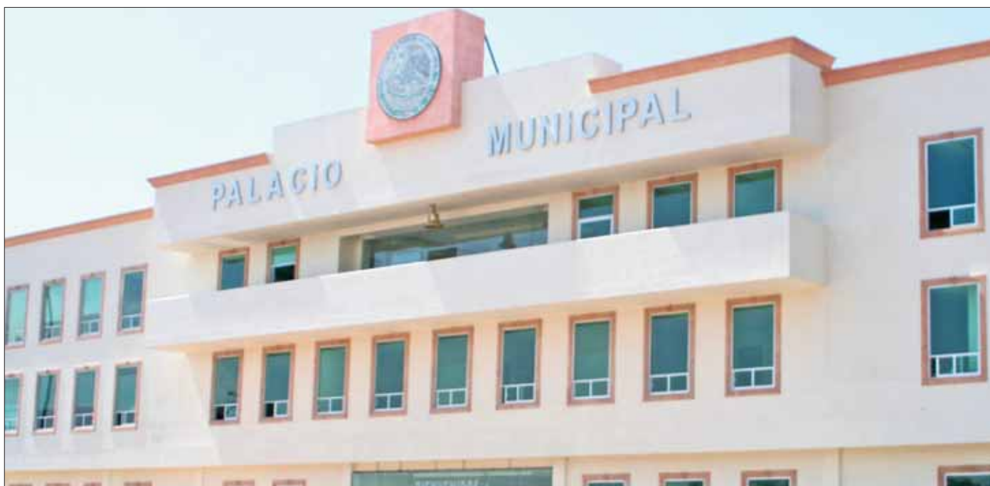
INCONFORMIDADES. Fueron los propios colonos quienes detuvieron las máquinas el pasado 3 de mayo.

Del mismo modo reconoció que deberán reestructurar dicho proyecto conservando espacio para artesanos de la región y el municipio, toda vez que el espacio para aplicarse no será el mismo, aunque prevén mantener la inversión de 2 millones 200 mil pesos, de recurso propio.