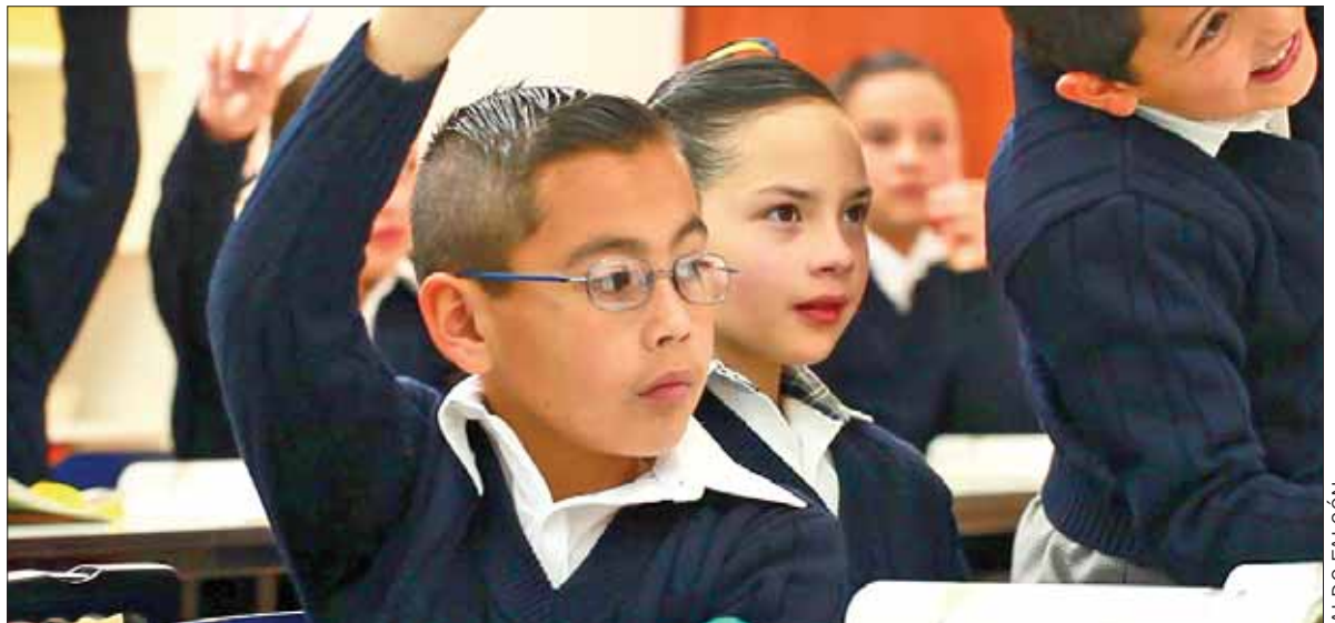
ATENCIÓN. Señaló el titular de la SEPH que no se han presentado casos de este tipo hasta ahora.

De cualquier forma, todos los directores y docentes están notificados sobre la prohibición de estos condicionamientos con el propósito de no incurrir en ellos.