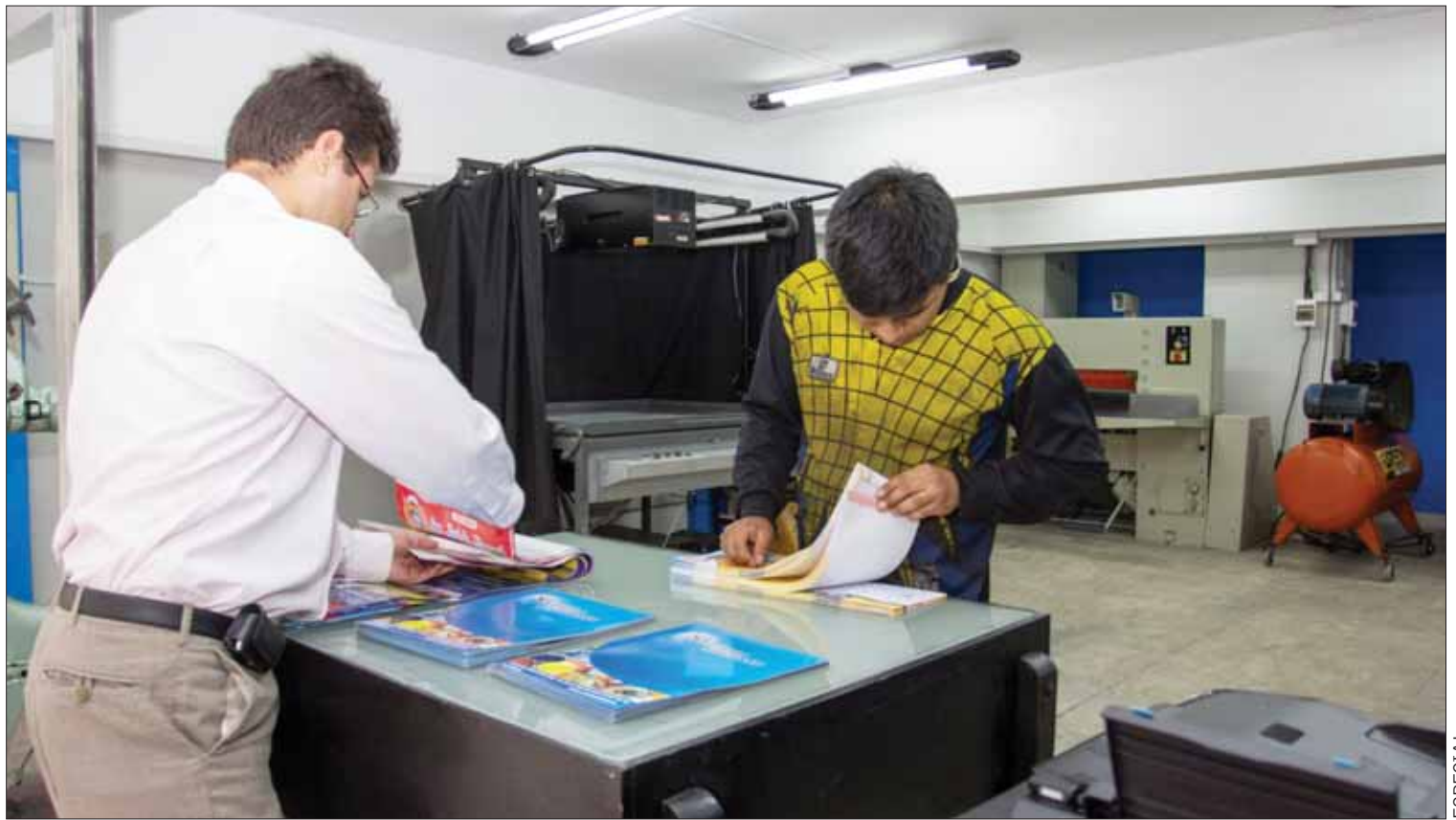
TENOR. En meses próximos han anunciado diversos eventos para este sector.

"Se prevén seis meses con bastante presencia de lluvias y en ese sentido a muchos nos preocupa esta situación, ojalá las autoridades tanto de Mineral de la Reforma como de Pachuca, así como el propio gobierno del estado, se encarguen de velar por la seguridad y por las fuentes de empleo de quienes habitamos en la zona metropolitana de Pachuca", concluyó. (Milton Cortés)