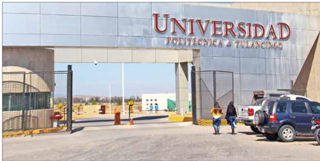
PAUTAS. Colaboración de alumnos de doctorado, maestría, egresados en el sector productivo, profesores investigadores y grupos de investigación de Japón, España, Francia, Italia, Estados Unidos y Canadá.

► Indica UPT que presentaron 64 ponencias