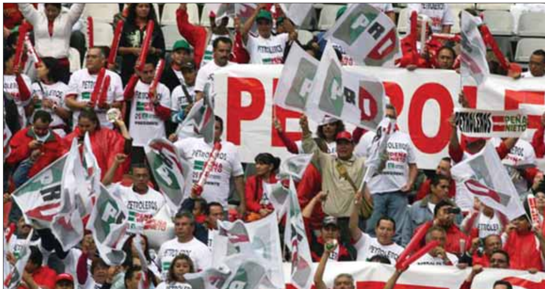
SAZÓN. Destacaron la presencia de hidalguenses, exgobernadores y militantes.