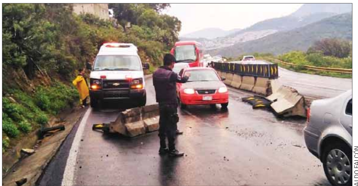
Debido a un accidente en el Corredor de la Montaña, donde el conductor del vehículo implicado huyó, las guarniciones del muro de contención fueron derribadas ocasionando bloqueo parcial en un carril; personal de Protección Civil de Mineral de la Reforma acudió al lugar para el retiro del material y realizar el abanderamiento necesario.