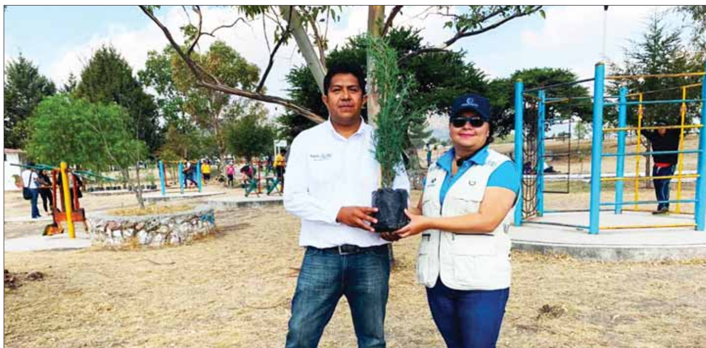
PAUTAS. Pretenden, con estas acciones, contrarrestar de algún modo los efectos negativos causados por plagas como el picudo negro y el heno motita.

Aseveró también que en los próximos días estarán con labores de reforestación en San Miguel de las Piedras, Michimalo-ya y Macuá.