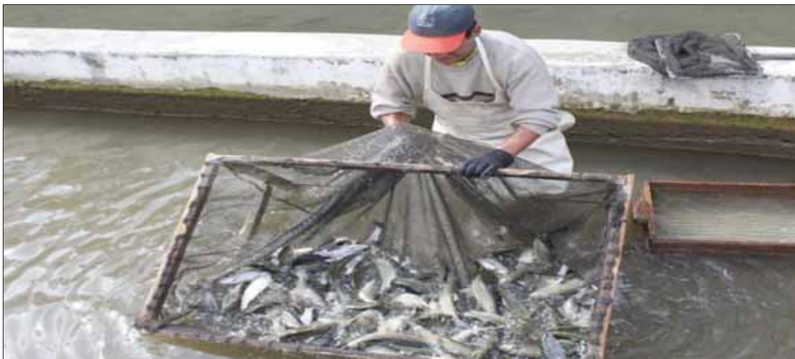
VISIÓN. Con proyecto en Cerro Colorado esperan que genere nuevas fuentes de empleo.

Dijo que la intención de este tipo de proyecto es generar fuentes de empleo que permitan a los hidalguenses poder sostener a sus familias y evitar de alguna forma la migración que se ha registrado en la región durante varias décadas atrás.