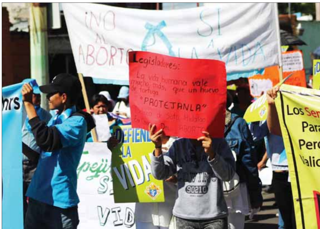
REFERENTES. Discusión sobre el aborto aún se lleva a cabo en comisiones del Congreso hidalguense.