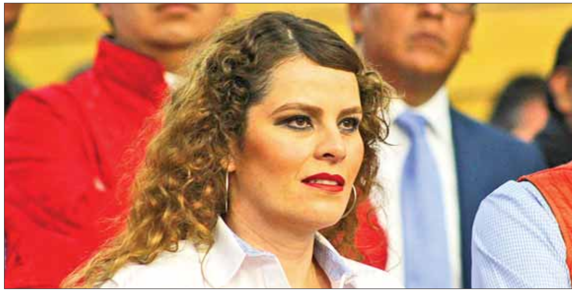
PREMISA. Habrá momento de definir cuál será el mecanismo de coalición, si será mediante convenio o la candidatura común.

No obstante, el partido logró el 4% de sufragios en los comicios de diputados locales, por lo que consolidó su inscripción co-