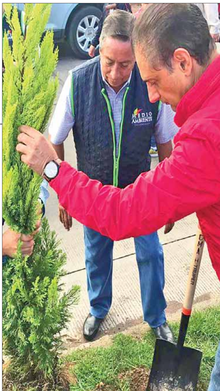
COMPLEMENTOS. Reconocieron que una reforestación exitosa, dependerá del seguimiento y por ello los alumnos y padres serán una especie de vigías.

A FAVOR Descartan plantaciones por ocurrencia o sentimiento: serán fundamentadas con conocimiento técnico y profesional