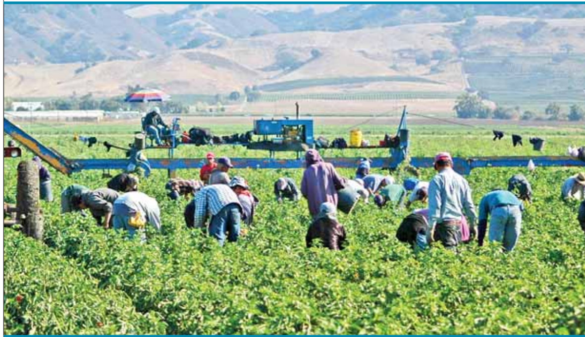
REACCIÓN. Implementa administración estatal diversas acciones para apoyar a los integrantes del sector.

"La indicación del mandatario Omar Fayad es proporcionar los recursos económicos e implementos a quien nunca recibe apoyos por parte del gobierno estatal y federal".