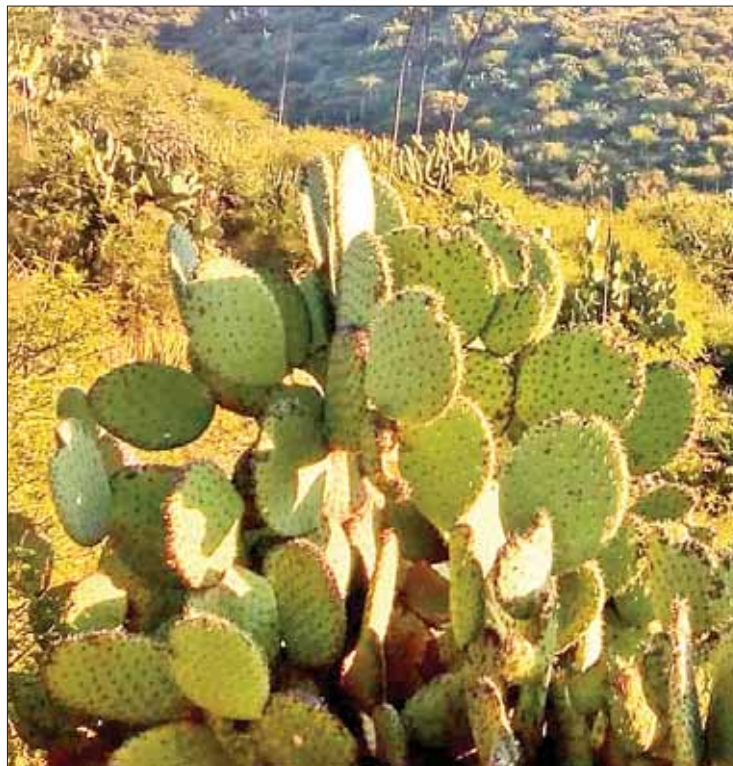
CAMINOS. Severos daños por deforestación y la existencia de plagas.