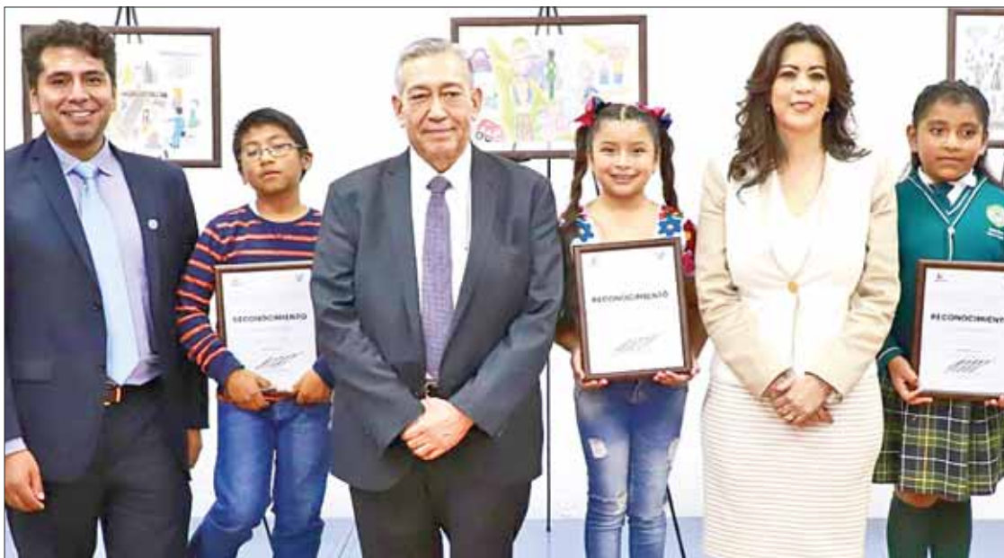
RESPUESTA. En el primer certamen recibieron más de 300 dibujos de 16 municipios.

► Foro de participación para conocer opinión de pequeños hidalguenses sobre este tema