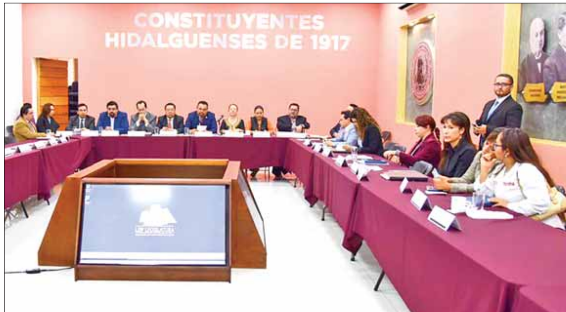
DISCUSIÓN. Planteamientos radicarán en adecuación del Código Electoral con el Reglamento de Elecciones federal.