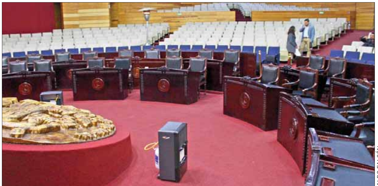
ESPECIFICACIONES. Acciones fueron a través de la Dirección General de Servicios Administrativos.

Cabe recordar que el servicio de limpieza fue suspendido a inicios del año, por considerar que era un gasto innecesario; se volvió a contratar, pues el personal del Congreso era insuficiente para realizar el trabajo.