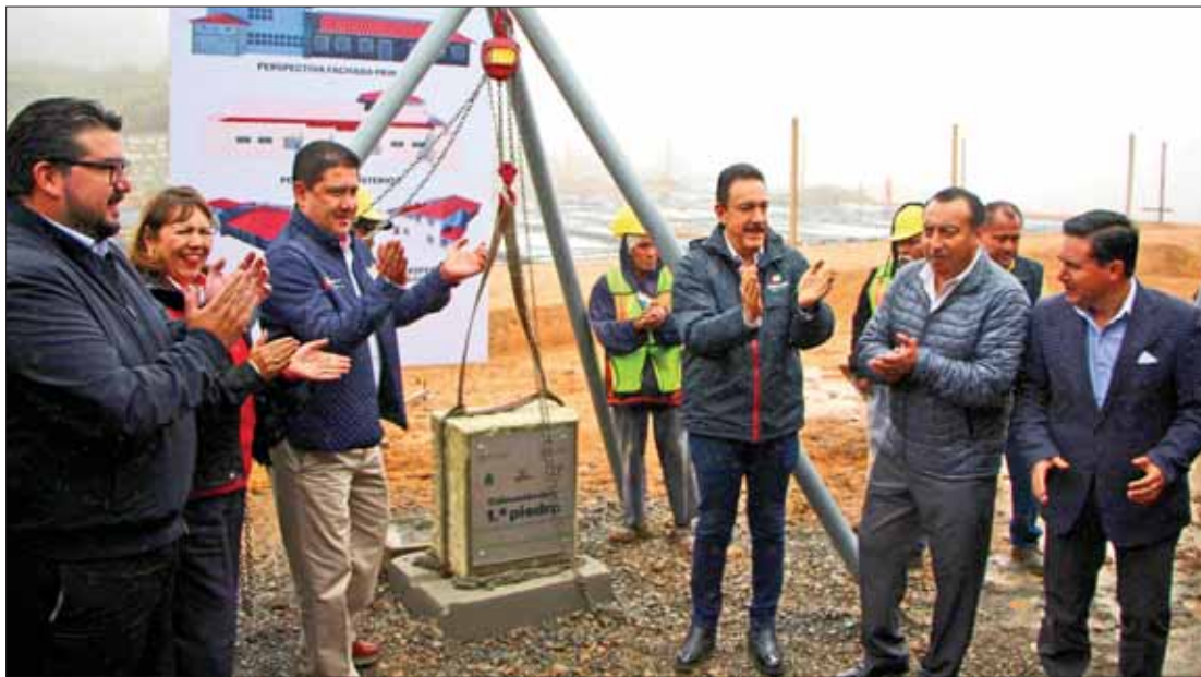
Colocó el gobernador Omar Fayad primera piedra para edificación del centro médico de Mineral del Monte.

"El gobierno del estado no puede permitir que se deje de prestar el servicio por parte de la empresa, por distintas razones y grillas que hay al interior desde hace meses".