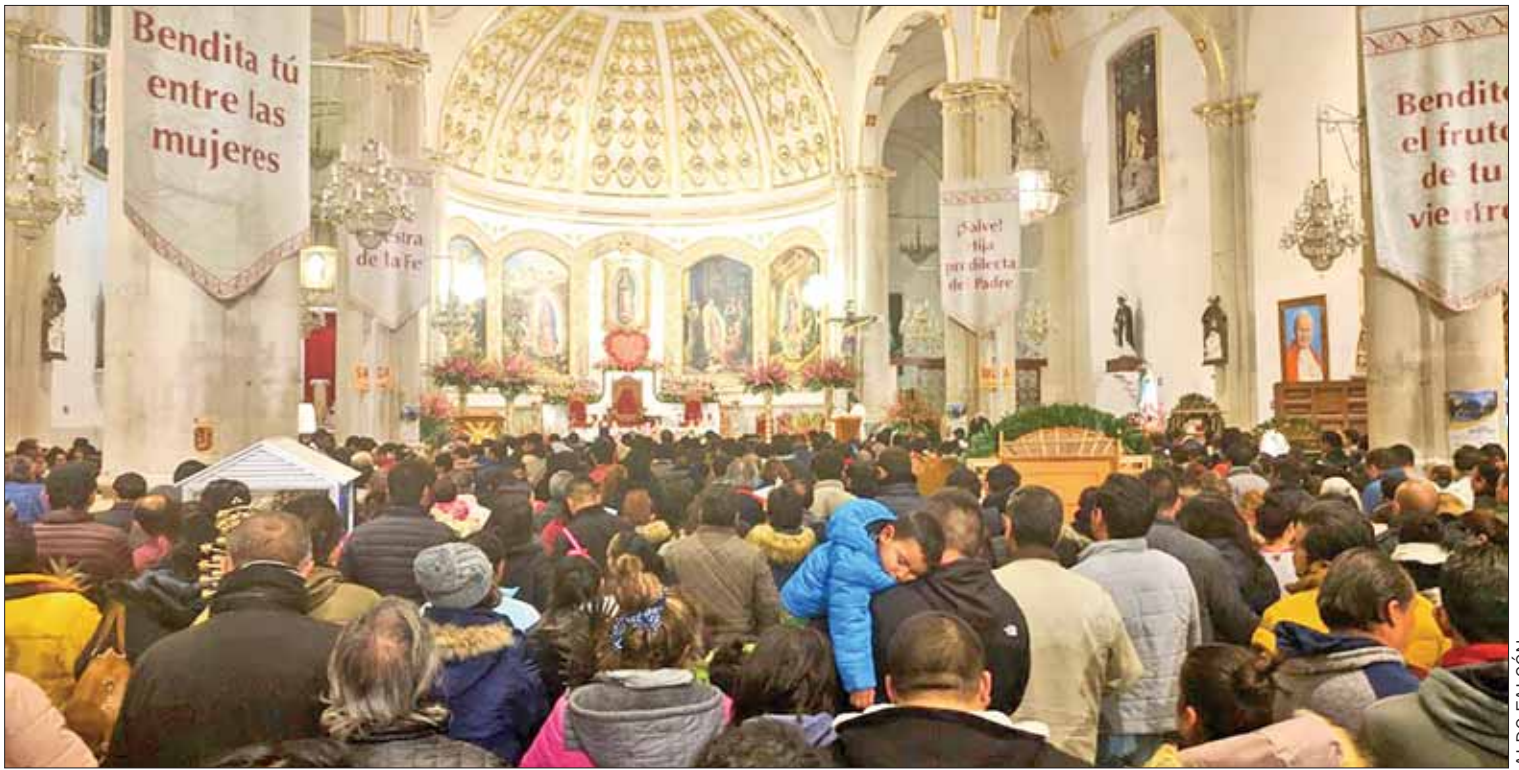
CONCORDANCIA. Durante el fin de semana fueron diversos los exhortos a dicha lucha por parte de los párrocos de Pachuca y zona conurbada.