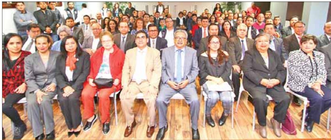
ESFERAS. Administración ha implementado un gobierno digital.