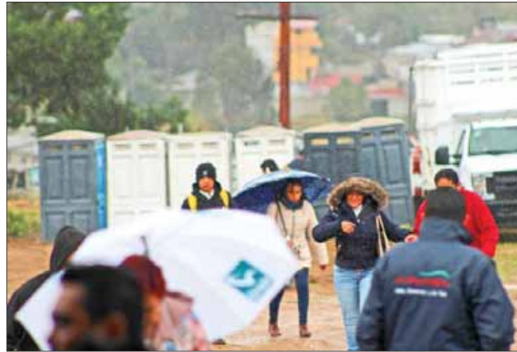
EJE. Alto potencial de tormentas principalmente en las zonas: centro, sur, Valle de Tulancingo y la región Otomí-Tepehua.

Protección Civil de Pachuca también alertó para mantener las medidas de prevención que sean necesarias, con la finalidad de no exponerse a los efectos de las lluvias en los diferentes barrios y colonias.