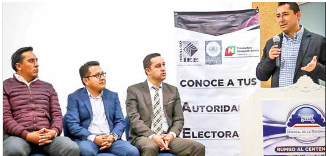
CAMINOS. Reiteran autoridades electorales la importancia de la colaboración interinstitucional para favorecer la consolidación de la democracia.