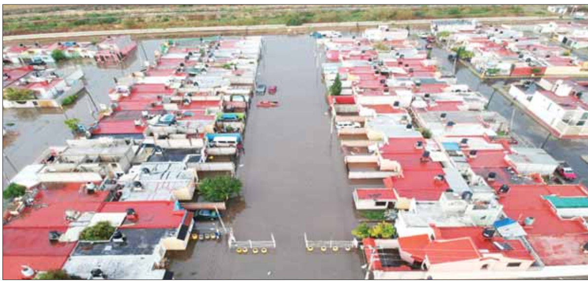
TORMENTA. Ayer una tromba en Pachuca y su zona conurbada generó estragos en la colonia Los Tuzos, de Mineral de la Reforma. Debido a la inundación, decenas de viviendas sufrieron afectaciones. No es la primera vez que en este lugar se padece por anegaciones.