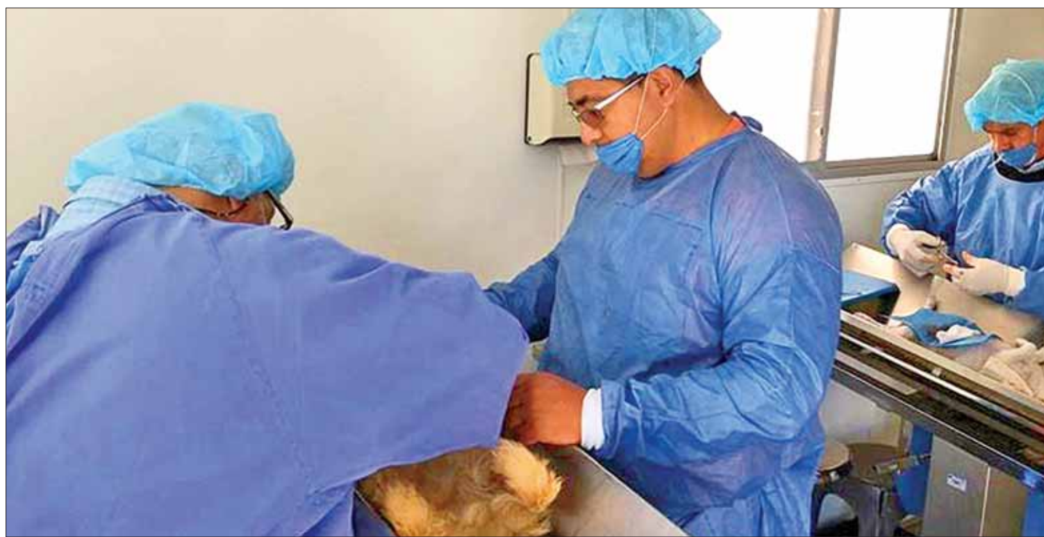
LUGARES. En Atotonilco el Grande se sumaron a las actividades programadas para dar cumplimiento a la meta estatal anual.

DATO. El dueño debe llenar una responsiva y presentar mascotas aseadas con ayuno de 12 horas; hay más especificaciones. (Redacción)