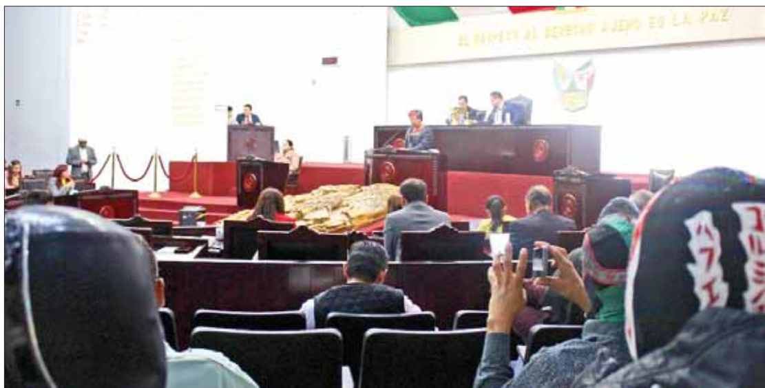
IGNORANCIA. Al cuestionarla sobre el tema apuntó que desconocía documento presentado por Legislatura anterior.

El artículo segundo, en ambas iniciativas, establece las definiciones de: anunciador, arena, ring, comisión, comisionado, empresa, inspector, lucha libre profesional, luchador, promotor, representante, reglamento y ring o cuadrilátero; y en la presentada por Martínez se agre-