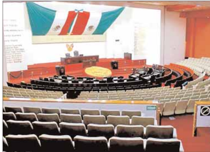
LECTURAS. Fue emitido el dictamen pese a no cumplir requisitos.

El edicto mencionó que el Consejo Estatal Ciudadano tendría que integrarse por dos personas que representen a familiares de víctimas, dos especialistas de reconocido prestigio y dos representantes de organizaciones de la sociedad civil; no obstante, las comisiones le-