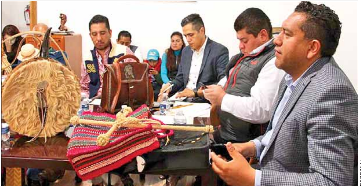
ÉNFASIS. Recordó el secretario los compromisos hacia estos sectores desde la administración de Omar Fayad.