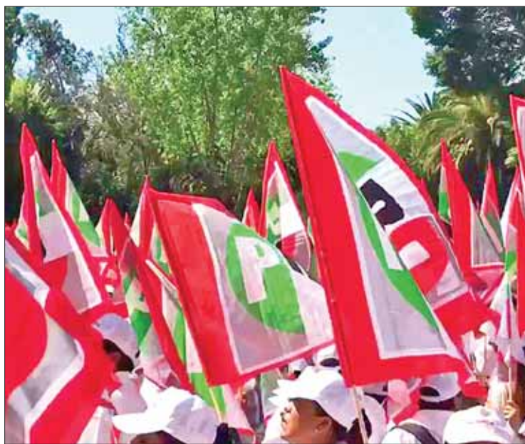
SEÑALES. Trascendió que dichos perfiles cumplirían requisitos.

de Procesos Internos del PRI emitió convocatorias y requisitos para celebrar esta jornada electiva por consulta directa a la militancia, el próximo 11 de agosto, en tanto el 22 de junio es la fecha de registro, de 10 a 14 horas, y para el 25 de este mes otorgará dictámenes de procedencia de candi-