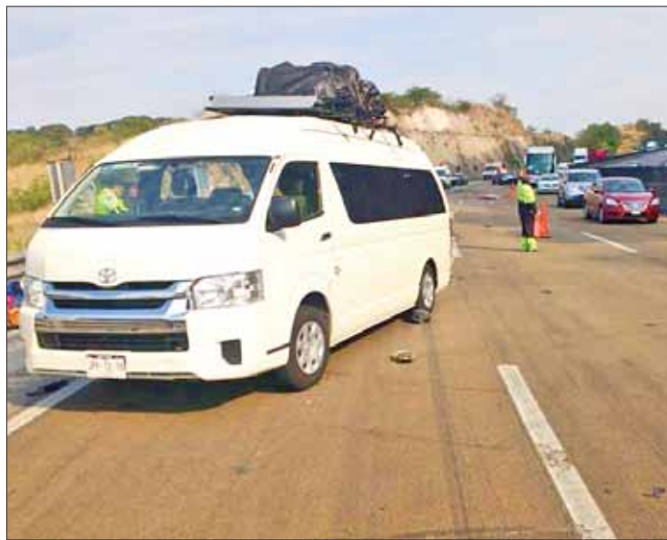
LAMENTABLE. Como resultado hubo además 11 personas lesionadas.

Además 11 personas resultaron heridas y fueron trasladadas por unidades de Caminos y Puentes Federales (Capufe); sin embargo, no se informó a qué nosocomio serían llevados, a excepción de un menor de dos años, identificado como S.G.N.G, trasladado a la clínica del Instituto Mexicano del Seguro Social (IMSS) en Tepeji, para descartar un presunto traumatis-